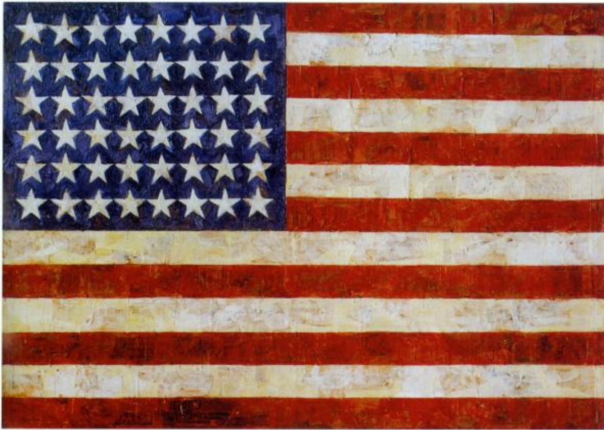
Jasper Johns, Bandiera , 1954-1955, New York, MoMA.

Nell'uno e nell'altro caso l'artista dichiara l'esigenza di raccoglimento, pausa o silenzio e mostra di affidare la propria attività a un ritmo mai predeterminato, intermittente. Alla svolta in senso magico-ritualistico di Celant contribuisce in misura decisiva, tra 1969 e 1970, la conoscenza di Beuys, artista la cui affermazione in ambito internazionale matura tra le due Dokumenta del 1964 e del 1968 ed è legata a performance (o "azioni") volte a produrre la crisi del linguaggio.