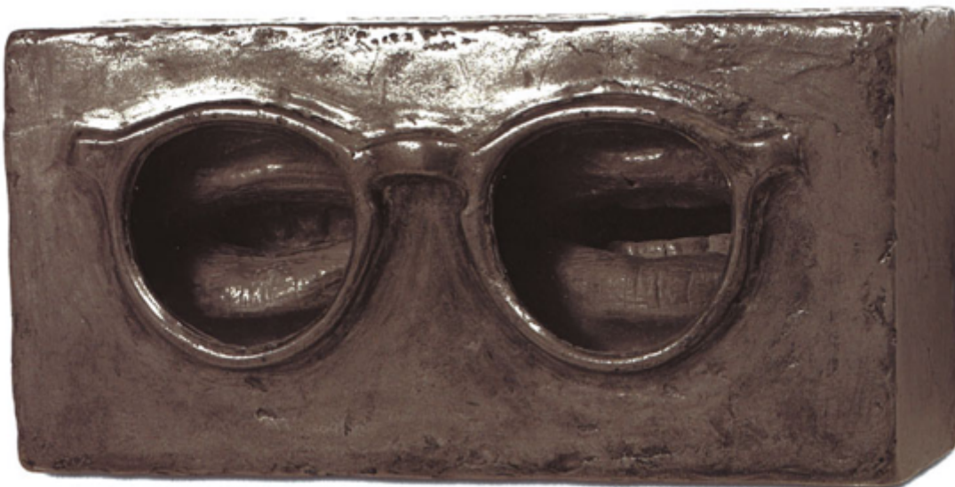
Jasper Johns, Il critico vede , 1961

La polemica "contro l'interpretazione" diviene meglio comprensibile se collocata sullo sfondo appena considerato, e ha delicati caratteri propedeutici. L'autrice non intende in nessun modo portare obiezioni