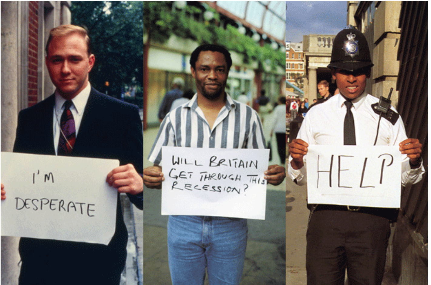
Gillian Wearing, Signs that Say What You Want Them to Say and Not Signs that Say What Someone Else Wants You to Say (1992–3).

In ambito artistico, usano la stessa metodologia alcune opere di Gillian Wearing. Nel suo primo lavoro, Signs that Say What You Want Them to Say and Not Signs that Say What Someone Else Wants You to Say (1992–3), l'artista britannica chiedeva ai passanti che incontrava nelle strade di Londra di scrivere una frase e poi li fotografava con il cartello in mano: per esempio, un poliziotto con la scritta "Aiuto!".