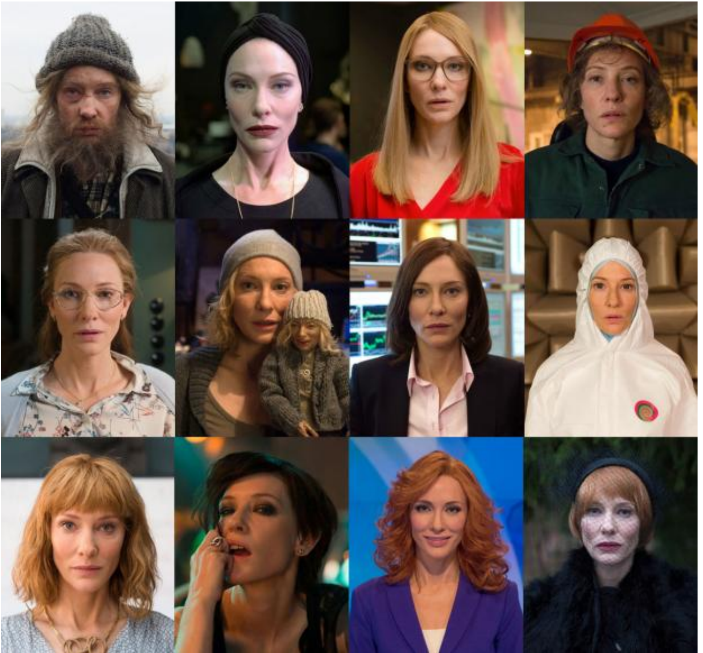
Julian Rosefeldt, Manifesto (2015).

Nei video che compongono l'installazione, l'attrice Cate Blanchett impersona dodici personaggi femminili (l'insegnante, la musicista punk, la presentatrice televisiva, la barbona...), che declamano frammenti di manifesti artistici e politici.