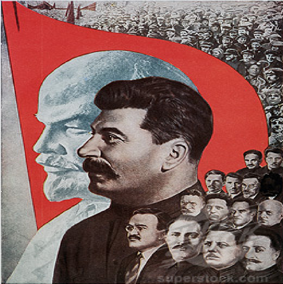
Gustav Gustavovic Klutsis, La bandiera di Lenin (1933).

Tuttavia zoomando resta possibile cogliere le caratteristiche di ciascuno, perché i singoli volti tornano riconoscibili. Quello raffigurato in queste icone è quello che potremmo battezzare Everybody, dove i singoli sono gli elementi che compongono il corpo (“ body ”) collettivo.