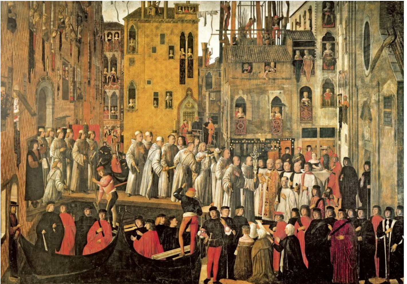
Giovanni Mansueti, Miracolo della reliquia della Santa Croce in Campo San Lio (1496).

Diers riconduce la fotografia a un celebre antecedente, il frontespizio del Leviatano di Hobbes (1651). E trova un antenato di quelle immagini nell'opera di un allievo dei Bellini, Giovanni Mansueti: il Miracolo della reliquia della Santa Croce in Campo San Lio (1496) mostra la folla degli uomini nelle strade e nella piazza, osservata dalle donne affacciate alle finestre, in una dialettica tra interno ed esterno, tra spazio pubblico e privato, tra maschile e femminile.