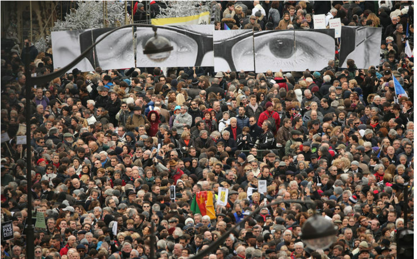
Parigi, Place de la République, 11 gennaio 2015.

Per tracciare un identikit dell'Uomo Qualunque si può partire da un'immagine rubata dall'attualità. Il metodo lo ha indicato Carlo Ginzburg, quando ha ricondotto l'iconografia del celebre manifesto che raffigura Lord Kitchener – “Your Country Needs You” – ai suoi antecedenti, la tradizione pittorica del ritratto frontale e quella del gesto di invocazione: è un'immagine “performativa”, che funziona sulla base della reazione dello spettatore più che sui contenuti che veicola.