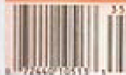
"Time" (18 novembre 1993).

How Immigrants Are Shaping the World's First Multicultural Society