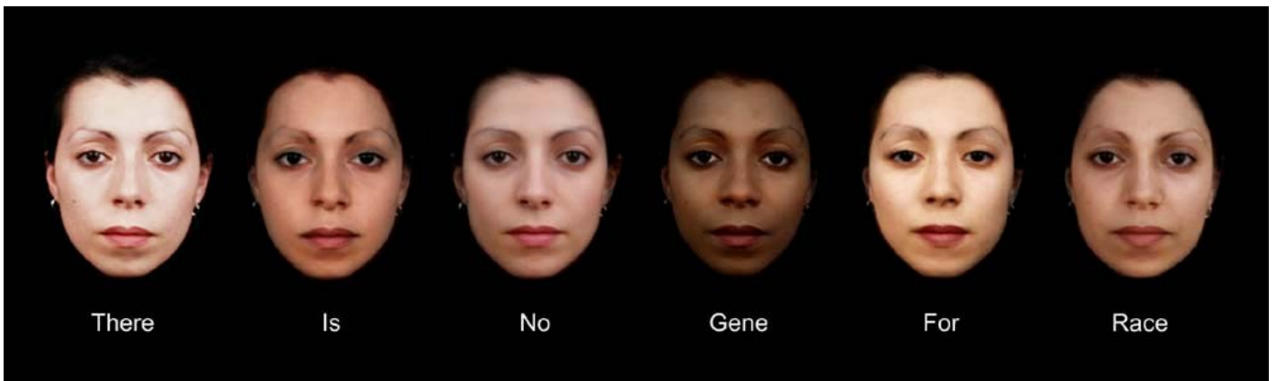
Nancy Burson, The Human Race Machine.

Ma è anche possibile ottenere effetti stranianti e conoscitivi, come fa dagli anni Settanta Nancy Burson, per studiare la nostra reazione (anche emotiva) di fronte all’Altro. Come lo vediamo, un volto umano? Come lo guardiamo? Come lo giudichiamo? In particolare, l’artista (che collabora con il MIT) ha costruito immagini che deformano i volti facendo loro assumere caratteristiche che associamo a etnie diverse, per vedere le reazioni che suscitano le diverse tipologie somatiche, dall’empatia alla repulsione.