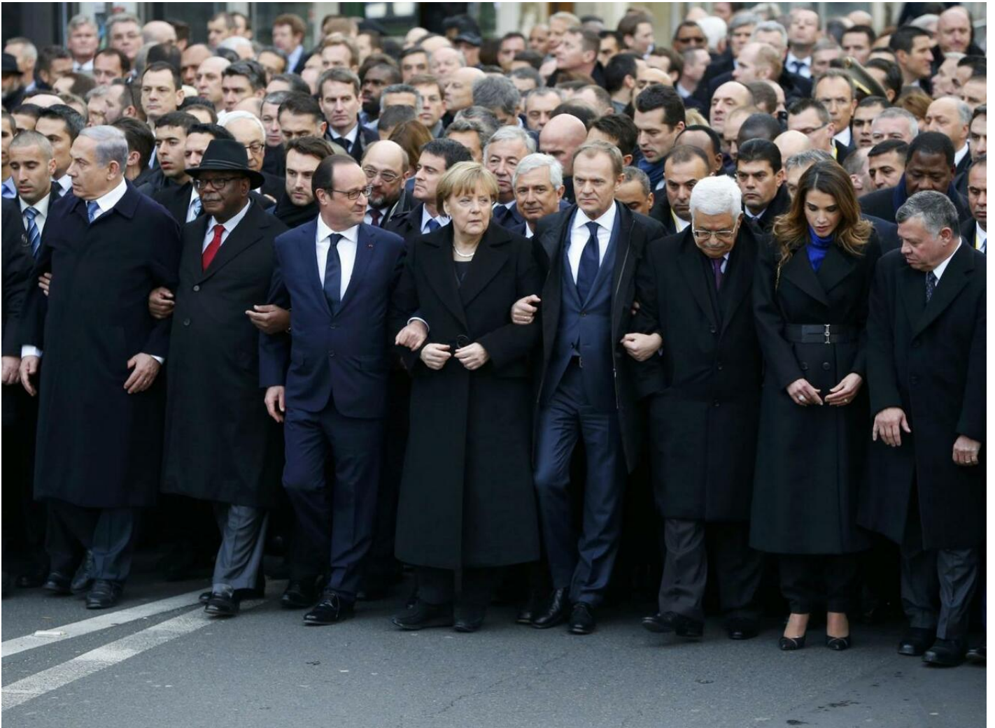
La manifestazione dei Capi di Stato, Parigi, 11 gennaio 2015

Nella figura del Leviatano, il corpo dell'Everybody trova una testa.