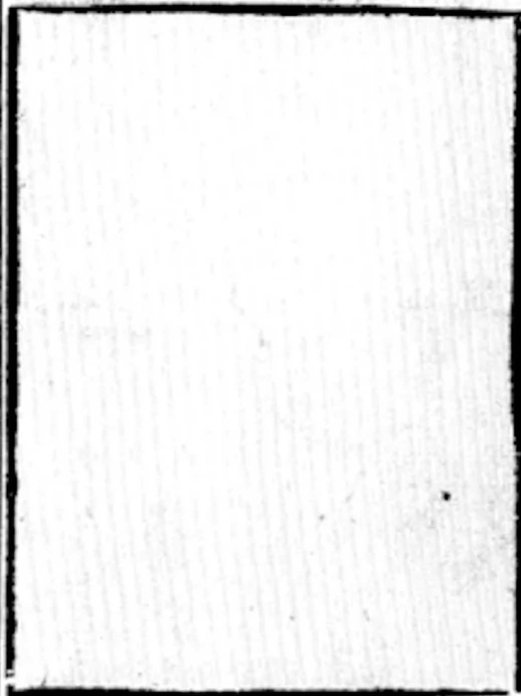
Figura neminis. quia nemo in ea depictus.

de sancto Nemine cum presertuatio regni mine eiusdem ab epidemia.