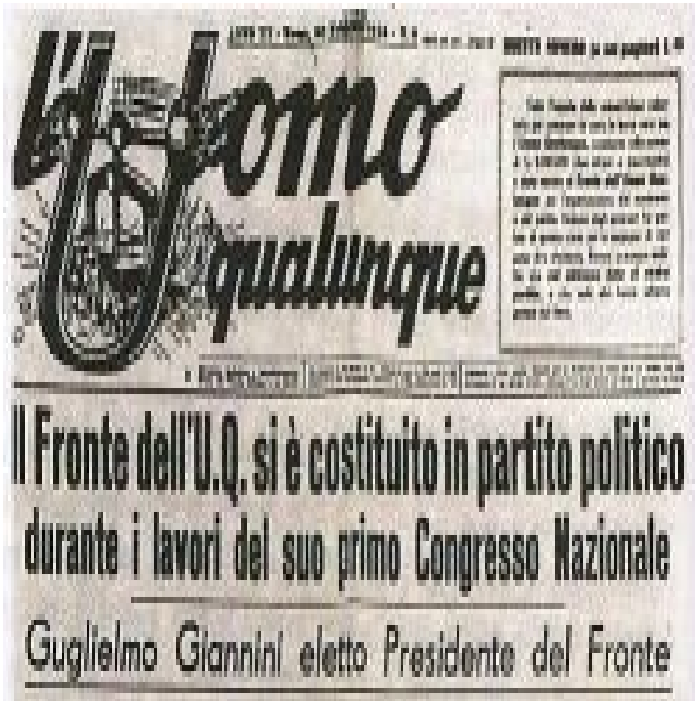
Il settimanale “L’Uomo qualunque” (1946).

Nella sua parabola, lo Everybody è agito da due paradossi simmetrici. Il primo nodo riguarda le modalità in cui il particolare – la differenza – si riconnette con l’universale, senza annullarsi ovvero senza perdere la propria identità. Simmetricamente, come è possibile che dalla molteplicità degli Everyone, dalla volontà di ciascuno di noi, si crei una public authority ? Come le singole determinazioni si possono coagulare in una volontà collettiva? Da sempre la filosofia politica si interroga sulle modalità con cui l’individualismo del singolo può risolversi nell’individualismo dell’universale. Oggi questo processo trova una nuova esplosiva declinazione nel web: a caratterizzare la nostra presenza in un social network come Facebook è la dialettica tra l’aspirazione alla stardom e la tendenza all’egualitarismo. Questa mutazione della nostra immagine pubblica e dunque della nostra identità non può non avere conseguenze politiche.