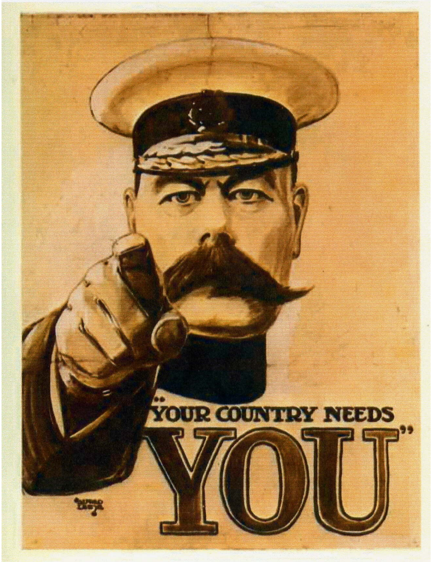
Your Country Needs You (manifesto, 1914).