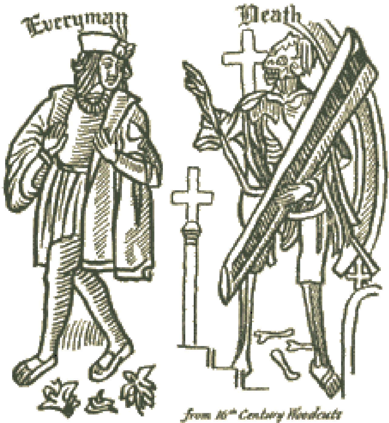
Frontespizio dell'edizione di Everyman pubblicata da John Skot (c. 1530).

Parlare di populismo e qualunquismo per interpretare la scena politica europea contemporanea può apparire semplicistico, o addirittura fuorviante. Spesso queste categorie vengono utilizzate per liquidare gli avversari e sono prive di valore aggiunto interpretativo.