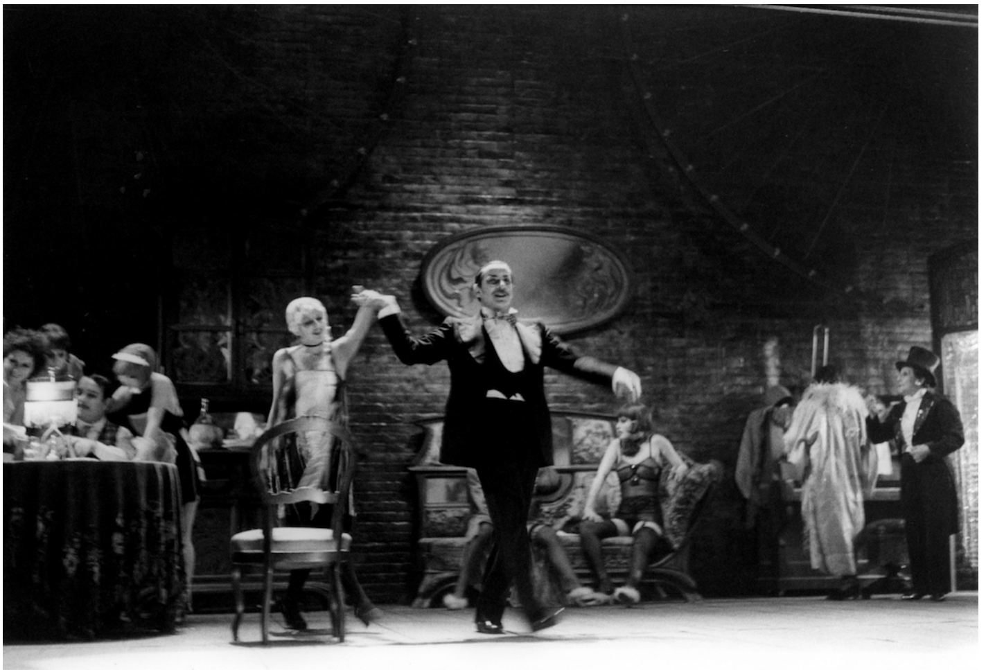
Opera da tre soldi, 1972-73, Domenico Modugno, foto Luigi Ciminaghi/ Piccolo Teatro di Milano – Teatro d'Europa.