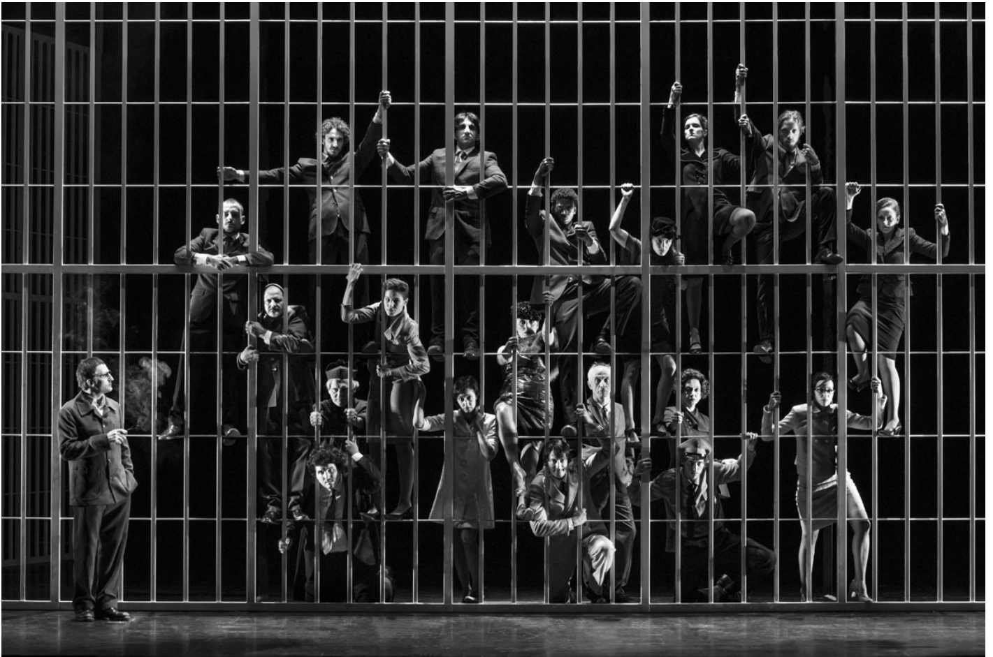
Opera da tre soldi, 2016, regia Damiano Michieletto.

Ed è, deriva, è basato anche sulla sua fede materialista?