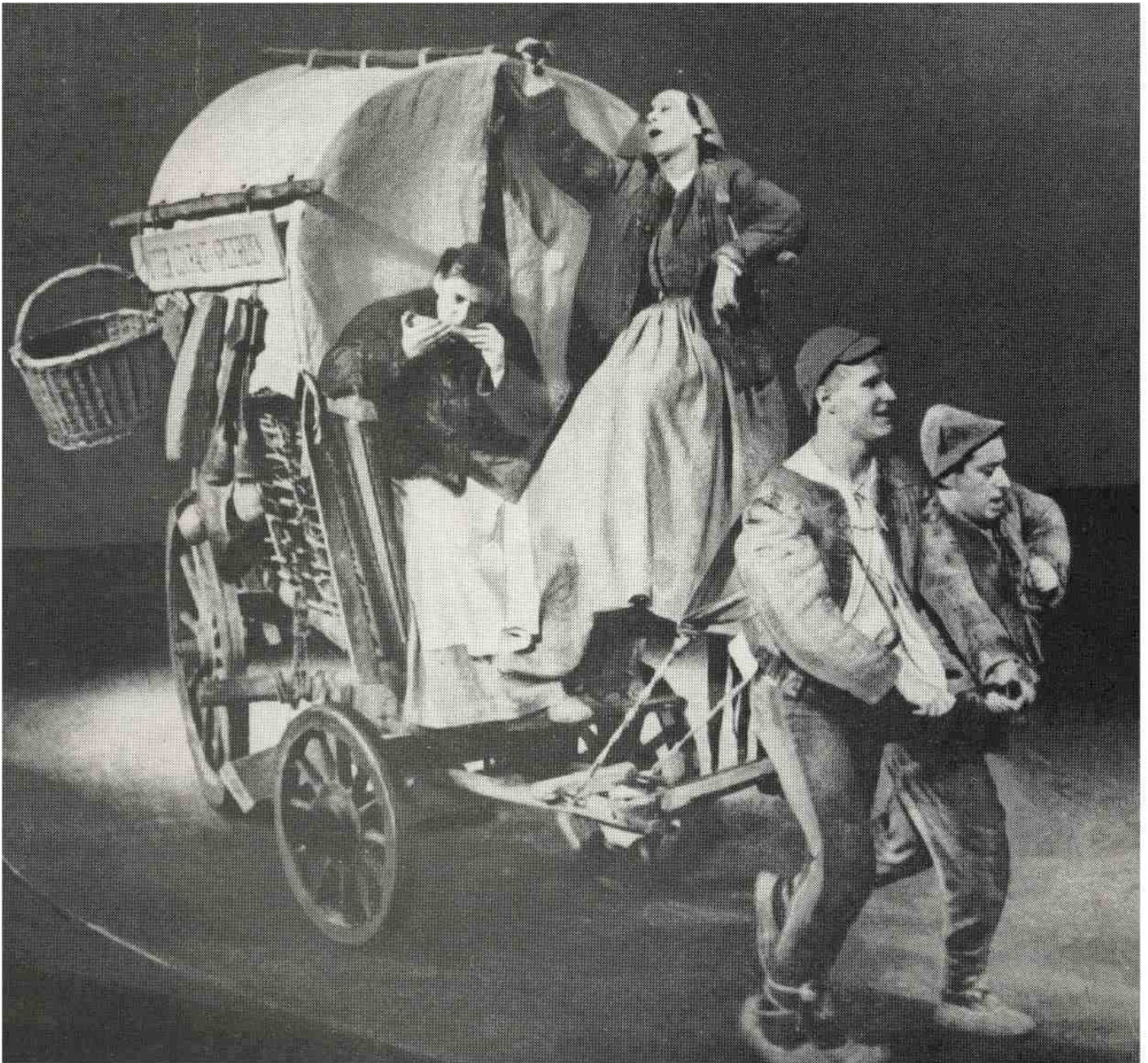
Mutter Courage, con Helene Weigel.

L'inattualità del teatro brechtiano realizzato deriva dalla complessità del compito che lui si era proposto? I risultati del metodo brechtiano si vedono forse solo con la troupe del Berliner Ensemble, per pochi anni. Ci sono stati critici e filosofi conquistati proprio dal Berliner Ensemble. Prima hai citato Benjamin, ma c'è Roland Barthes che inizia la sua carriera come critico teatrale della rivista "Théâtre populaire" e si sposta verso la riflessione filosofica e la semiologia proprio dopo l'incontro con il teatro e con la compagnia di Brecht, in particolare con la Mutter Courage interpretata da Helene Weigel.