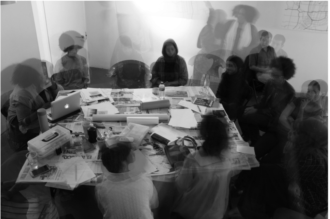
Photos from Numbi Heritage walk Intersectionality workshops and Numbi Rio exhibition.

Il Rich Mix non è la sola sede delle attività del collettivo Numbi Arts, ma lo sono anche altri luoghi che ben rispondono al suo spirito. Nelle nostre peregrinazioni londinesi, uno dei nostri spazi prediletti era l'iklektik Art- Lab, dove si realizzano laboratori, conferenze, proiezioni, concerti, letture e, che nelle parole del suo direttore, Eduard Solaz, è una performance costante, un'installazione sociale, un luogo dove persone diversissime si incontrano e interagiscono.