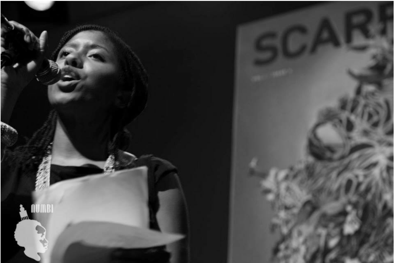
Numbis Scarf magazine launch @ Rich Mix.

Sono passate ormai tre decadi da allora, eppure quella delicata armonia, la complicità e spensieratezza con cui vivevamo le nostre piccole avventure, sono ancora oggi vividi sentimenti, capisaldi di quegli anni di formazione.