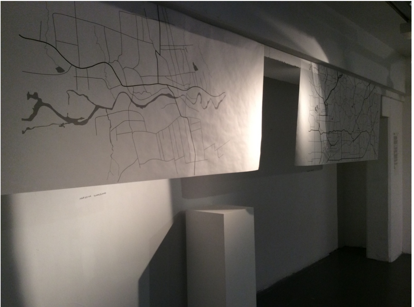
Photos from Numbi Heritage walk Intersectionality workshops and Numbi Rio exhibition.