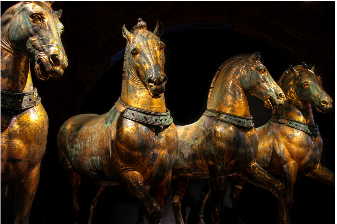
Cavalli bronzei, S. Marco.

Si ha come la sensazione che questa ricchissima città, sorta in posizione strategica sulla via della seta, custode di un incredibile tesoro di sculture, tessuti pregiati, gioielli giunti dal vicino e dal lontano Oriente, dalla Grecia alla Cina attraverso la Persia, assomigliasse in tutto alla sua sovrana.