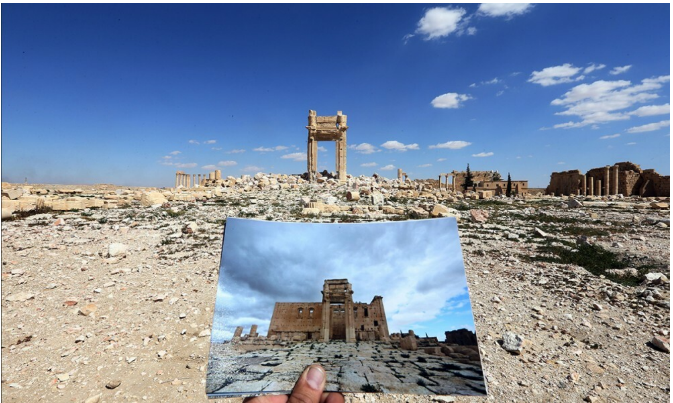
Palmira prima e dopo, panorama.

Nella premessa è insito un cortocircuito: per un archeologo è, ad un tempo, essenziale e imbarazzante (sperare di) trovare i resti di una distruzione, perché permette che le tracce di una pregressa civiltà siano comunque conservate, congelate, e possano finalmente parlarci . In alcuni casi è proprio il frammento a restituire un ricordo e un'impressione preziosi.