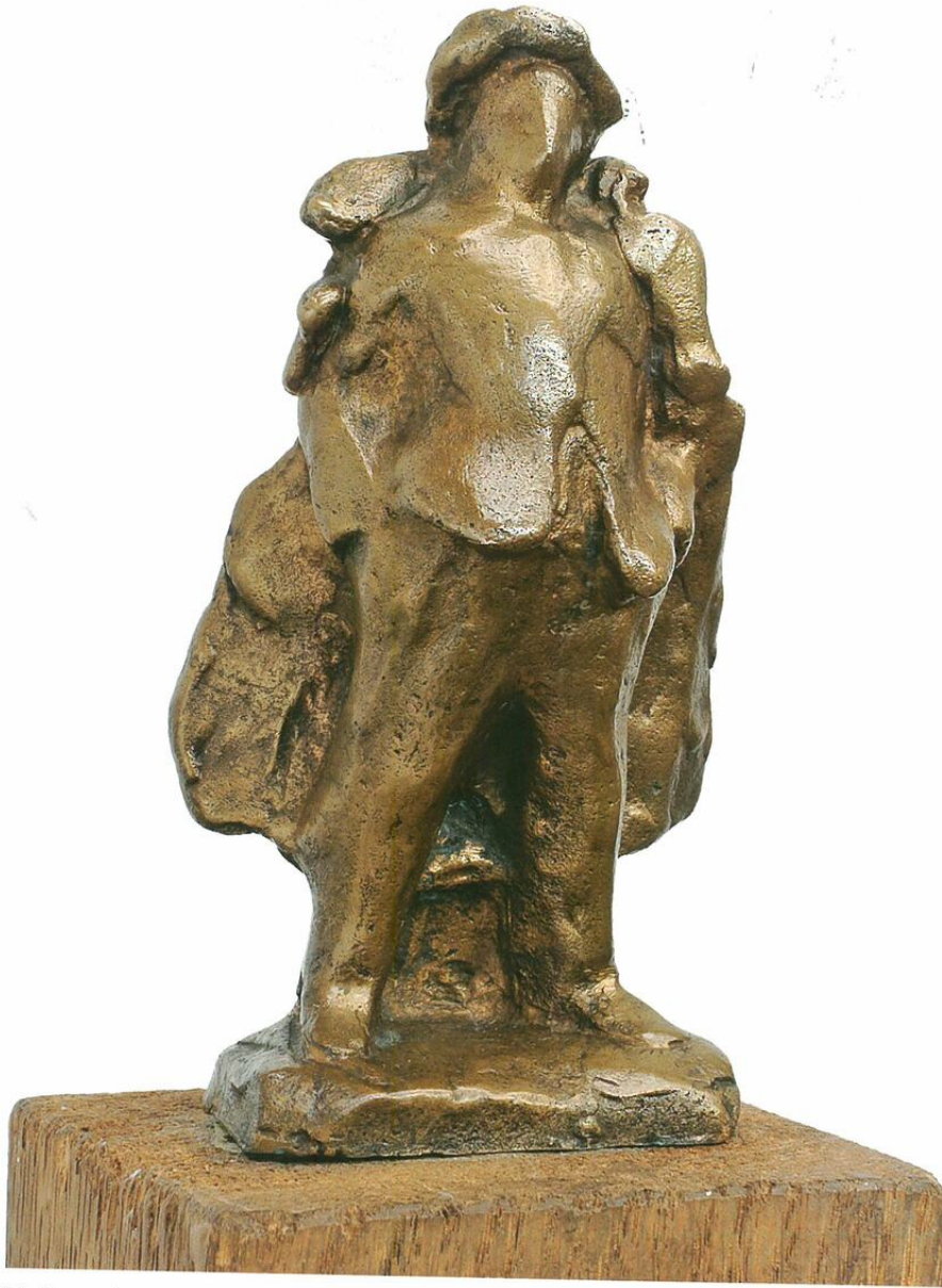
21. Antun Augustinčić: Miroslav Krleža, 1969.