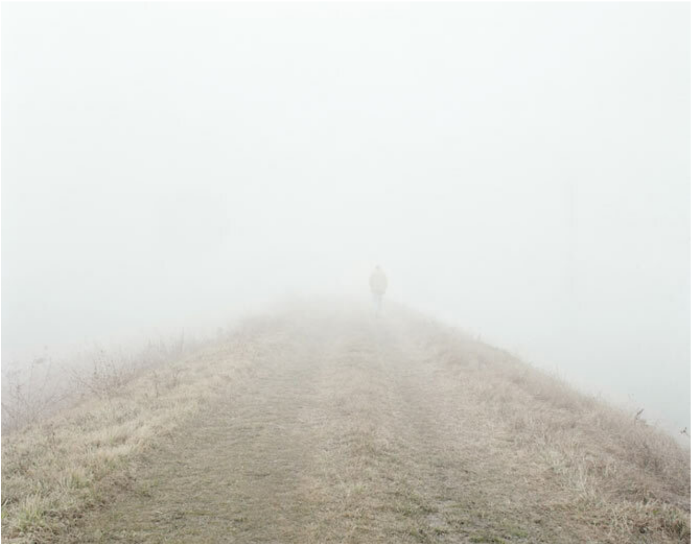
Luigi Ghirri, Roncocesi 1992.

In un altro scatto dell'ultima serie si vede una persona, di spalle, che si allontana percorrendo una strada di campagna, mentre la sua immagine viene assorbita nella nebbia, nell'atmosfera straniante, che invita a riflettere sul destino ultimo dell'essere umano e sull'universo, tra tempo, memoria e morte. Roncolo (1992) e altre fotografie di Roncocesi testimoniano ulteriormente la modalità abituale di Ghirri messa in atto in tutta la sua ricerca, ovvero il suo rapporto con l'esistente, cercando il punto di equilibrio tra la sua interiorità e ciò che vive all'esterno, nel mondo, che continua ad esistere anche dopo lo scatto: "Guardare alla fotografia come a un modo di relazionarsi col mondo, nel quale il segno di chi fa fotografia, quindi la sua storia personale, il suo rapporto con l'esistente, è sì molto forte, ma deve orientarsi, attraverso un lavoro sottile, quasi alchemico, all'individuazione di un punto d'equilibrio tra la nostra interiorità – il mio intento di fotografo-persona – e ciò che sta all'esterno, che vive al di fuori di noi, che continua a esistere senza di noi e continuerà a esistere anche quando avremo finito di fare fotografia. È quello che ho sempre cercato, alla ricerca di quello strano e misterioso equilibrio tra il nostro interno e il mondo esterno" (L. Ghirri, Lezioni di fotografia , Macerata 2010, p. 21).