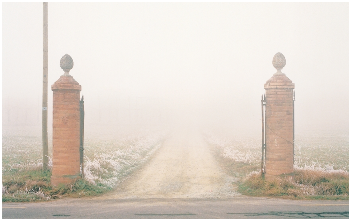
Luigi Ghirri, Formigine 1985.

A Milano, attorno al 1991, Luigi Ghirri confida a Mario Cresci che, dopo aver esplorato per tanti anni il paesaggio e le cose dell'esistenza con innumerevoli scatti, sta pensando ad altro, e in quel momento non gli resta che fotografare la sola nebbia della sua terra, come segno estremo di cancellazione del mondo, per dirigersi verso l'imponderabile o l'ignoto. Roncocesi , una delle ultime fotografie, scattata nel gennaio del 1992, coglie la luce che avvampa come un cielo di bruma, facendosi orizzonte tra due campi separati da una roggia. L'acqua nel fossatello pare latte di brina, specchio del biancore nebbioso. Lo stato di sospensione, sia della luce sia della bruma, viene colto in una visione estatica, così come avrebbe potuto viverla un mistico medievale. In questa immagine il fotografo si lascia condurre nella non delimitazione del reale, in una frazione del tempo in cui è in atto una rarefazione dello spazio.