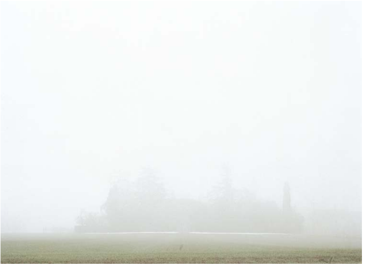
Luigi Ghirri, Roncolo 1992.

Ghirri ha reso visibile la preziosità della geografia sentimentale. Sul destino dell'appartenenza a un luogo e a una sua memoria condivisa da molte generazioni incombe la cancellazione del mondo. Ma l'opera intera dell'artista emiliano suggerisce che al di là di quello che può accadere attraverso l'oblio, ogni luogo del mondo condurrà sempre una nuova prospettiva del guardare e dell'abitare. La sua ricerca concettuale ha dato vita a innumerevoli "immagini impossibili" (ovvero a sintesi tra la staticità della pittura e il movimento del cinema), che hanno preso corpo nello svolgersi del tempo feriale, da soggetti umili e periferici, da piccole cose e vicende marginali, trasmutati in forme liriche e tradotti in lucide riflessioni da una sensibilità che ha cercato di comprendere il senso dell'esistenza ponendo continuamente domande con il suo sguardo: "Credo che la fotografia possa metterci in relazione con il mondo in maniera profondamente diversa.