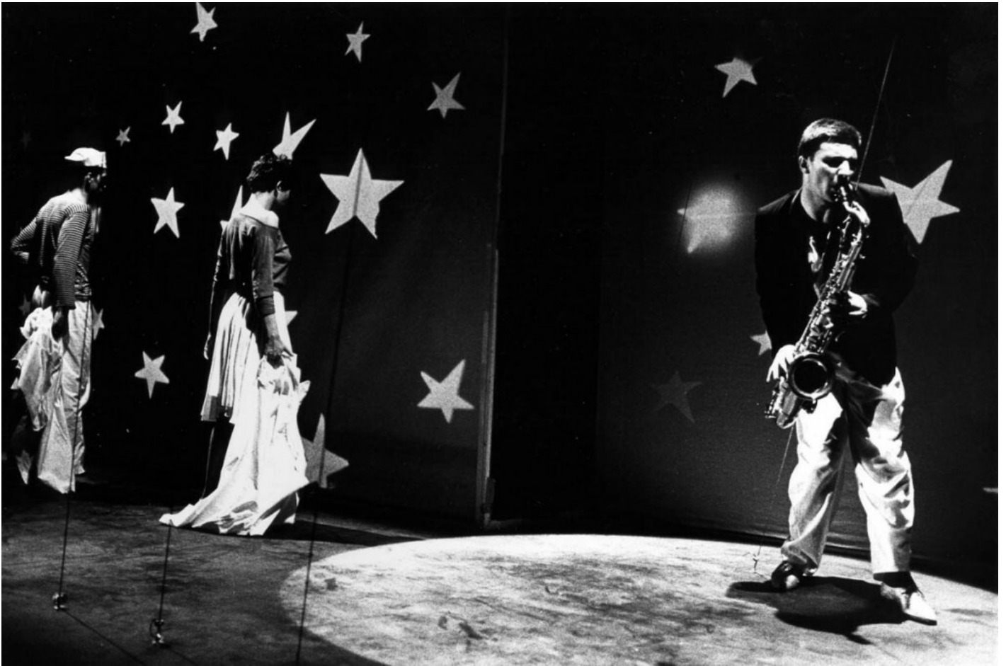
Falso Movimento, Tango Glaciale, ph. Bob Van Dantzig.

Il testo di Valentina Valentini ben focalizza l'inizio di questo percorso che nel tempo portò al disegno di un nuovo assetto produttivo, estetico, linguistico e organizzativo: lo fa con una scrittura agile, ariosa, mai puntigliosa. Uno dei punti forti di questo libro è la capacità di inquadrare il tema scelto in un'ottica non esclusivamente teatrologica, anzi il respiro rispetto a quello che accadeva nelle piazze, alle tendenze della letteratura, del cinema, della musica è sempre presente e dialogante con l'universo descritto del Nuovo Teatro. Questo procedere rende la complessiva lettura ben inquadrata e correlata a quello che era l'intorno. Ciò non toglie chiarezza né profondità all'esposizione, ma la arricchisce delegando poi gli approfondimenti a percorsi monografici (sul sito e in altre pubblicazioni). È un modo di procedere includente, aperto non solo a studiosi, ma anche a chi ne è semplicemente incuriosito (va rilevato, comunque, che alcune critiche metodologiche sono state avanzate da Marco De Marinis sulla rivista "Culture teatrali" ).