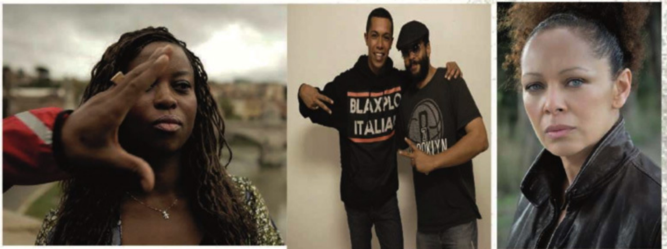
Blaxploitalian film poster.

A new film documentary by Afroitalian Filmmaker Fred Kuwornu