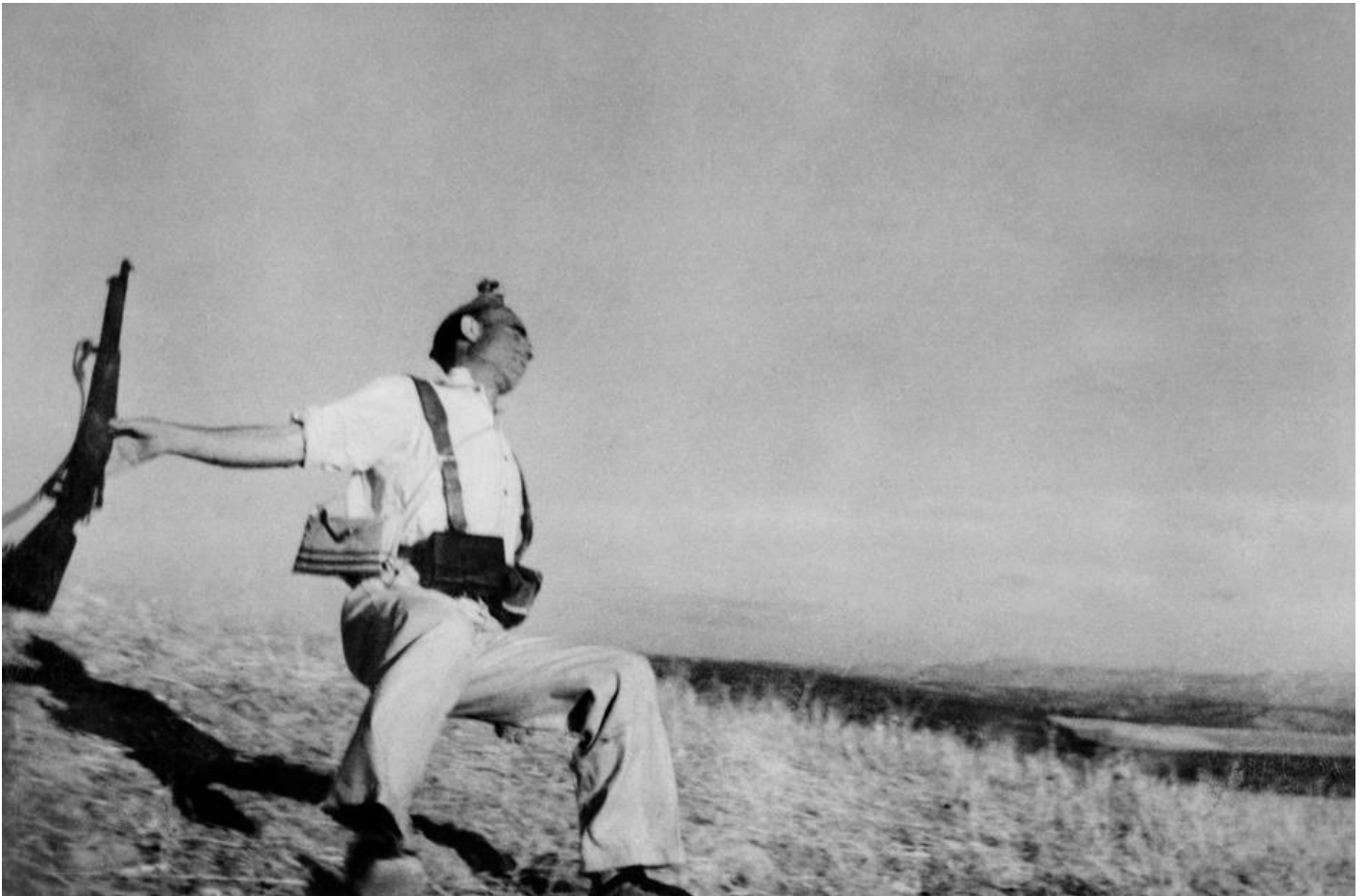
Il miliziano colpito a morte, Robert Capa.