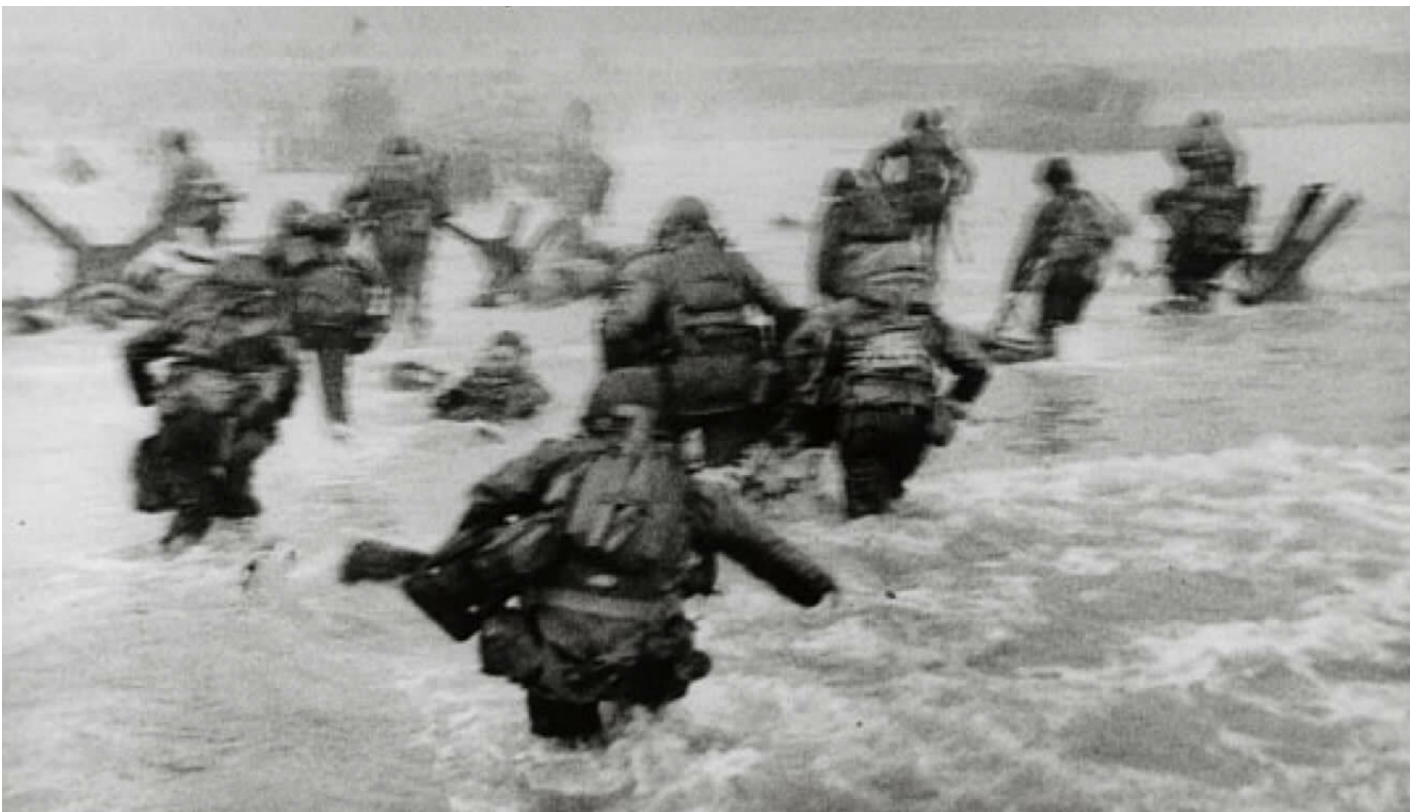
Lo sbarco in Normandia.