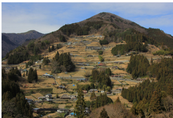
Il villaggio di Ochiai nella Valle di Iya.