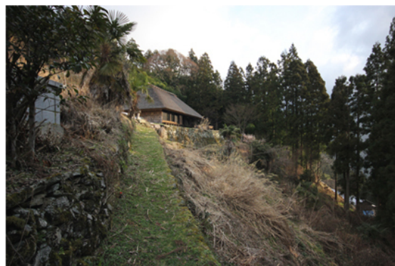
Chiiori nell'ambiente circostante.