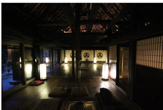
L'interno di Chiiori: trionfo dello spazio vuoto intorno al fuoco.

Qualcuno potrebbe rimanere molto stupito nel sapere che questo spazio così raffinato e ricco di qualità era una volta una casa di contadini. Tutta questa bellezza, oggi ulteriormente sottolineata da piccoli tocchi squisiti del proprietario come Ikebana o meravigliose calligrafie sulle Shôji (le porte scorrevoli con la struttura di legno ricoperta di carta giapponese), era a portata del popolo. La qualità e la bellezza non erano concetti necessariamente legati al lusso, che Bruno Munari considerava stupido. La minka è il risultato di una progettazione coerente con l'ambiente, con la tecnica e i materiali disponibili sul territorio. È una specie di corpo semi-vivente che sembra cresciuto dalla terra stessa e respira e invecchia col tempo. Non si oppone né ignora l'entropia come l'architettura moderna. Per questo vi regna un'estetica realmente organica che l'uomo da solo difficilmente riuscirebbe a realizzare. Eravamo letteralmente ammirati da quella casa, e profondamente riconoscenti del pensiero e dell'azione di Alex Kerr, proprio perché in questo viaggio, più entravamo a conoscenza del vecchio Giappone, più ci rendevamo conto di cosa e quanto abbiamo perso nel corso della costruzione del nuovo Giappone: conoscenza del territorio, rapporto sostenibile con esso, con il tempo, qualità altissima della progettazione, bellezza... sotto tutto questo scorreva la vita.