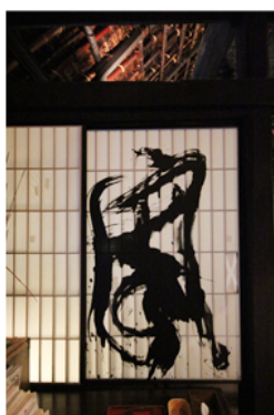
Calligrafia di Kerr.