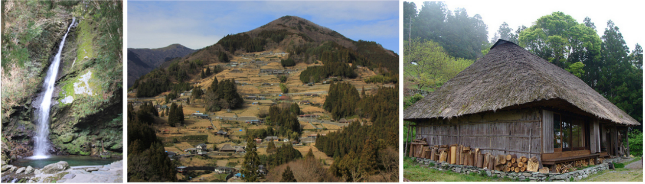
Una cascata a Iya. Chiiori.