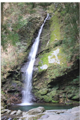
Una cascata a Iya.

Oggi Kerr non vive più a Chiiori, che è diventata anch'essa una struttura alberghiera. Si può prenotarla e dormire lì. Così abbiamo fatto anche noi. Verso la fine di marzo abbiamo soggiornato a Chiiori una notte. Ed è stata un'esperienza memorabile. È forse la minka meglio ristrutturata che io abbia mai visto. Ha un grande spazio vuoto, bellissimo. L'amico architetto, entrandoci dentro, ha esclamato "il trionfo dello spazio vuoto!". Chiiori ha mantenuto molto bene la sua fisionomia originale fatta di legno massello con travi e pilastri molto grossi, muri di terra e vegetali e tetto di paglia mirabilmente restaurato, ma è dotata di tutte le innovazioni tecnologiche che rendono possibile viverci anche in pieno inverno, tutte abilmente nascoste, a cominciare dal riscaldamento sotto il pavimento. All'interno delle minka di una volta, d'inverno, faceva molto freddo e a marzo a Iya la temperatura è ancora molto bassa.