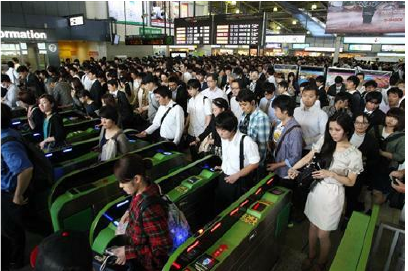
Il flusso continuo di una grande quantità di passeggeri.

Non crediate che i giapponesi siano chiamati a fare un addestramento specifico per passare velocemente l'ingresso della stazione (anche se ne sarebbero capaci), è l'intera educazione scolastica che mira a impartirci questo senso di disciplina e prontezza. Sembrano piccoli dettagli, ma quando tutta la popolazione delle zone urbane si comporta in un dato modo e ripete diligentemente gli stessi gesti, fa un certo effetto. Voi direte che è un segno di civiltà. In parte è vero, ma bisogna leggere lo scopo finale di tutto questo.