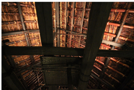
Il soffitto di Chiiori.