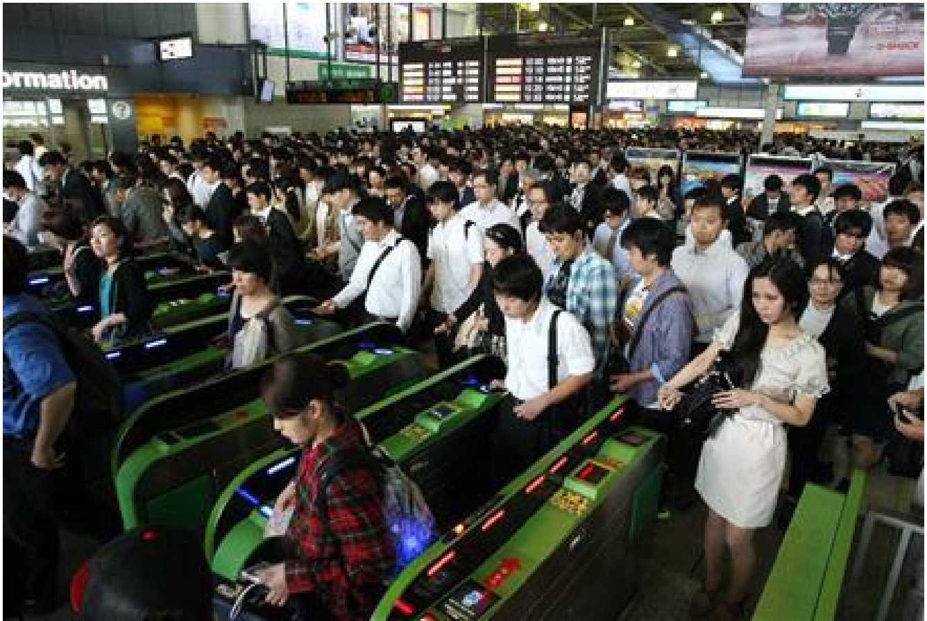
Il flusso continuo di una grande quantità di passeggeri.

all'uscita, ci mettevamo a cercare il biglietto in tutte le tasche creando una "vergognosa" congestione dietro di noi. Agli occhi di tutti, risultavamo chiaramente elementi difettosi della società.