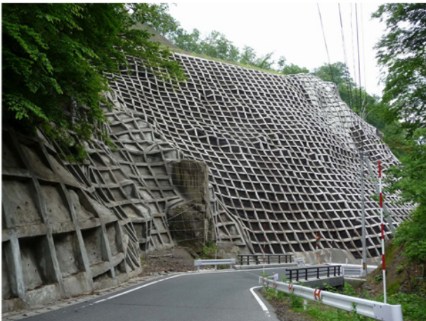
Tipica "protesi" applicata al versante di una montagna.

Nel 1998, i lavoratori del settore rappresentavano il 10.1 % di tutti i lavoratori giapponesi, il doppio rispetto all'UE. I soldi spesi per l'edilizia in Giappone superano di gran lunga quelli spesi negli USA per gli armamenti. Nel 2001 l'edilizia rappresentava il 13% del PIL giapponese, mentre nello stesso periodo in America lo stesso settore registrava solo il 5% del PIL. Il Giappone ha speso per i lavori pubblici realizzati nei 13 anni tra il 1995 e il 2007 circa 650mila miliardi di yen, quasi 4 volte più di quanto spendeva l'America nello stesso periodo, nonostante il Giappone abbia una superficie (di cui tra l'altro il 70% è zona montana, quindi non idonea all'edificazione) pari a un venticinquesimo del suolo americano. Kerr continua a snocciolare dati. Abbiamo 2800 dighe sul nostro territorio (che è poco più grande di quello italiano) e in programma (nel momento della pubblicazione del libro) altre 500 da costruire (!!!). Tutte queste cifre sull'edilizia sono impressionanti e i promotori principali sono i due ministeri, il Ministero del Territorio e dei Trasporti e il Ministero dell'Agricoltura, delle Foreste e della Pesca.