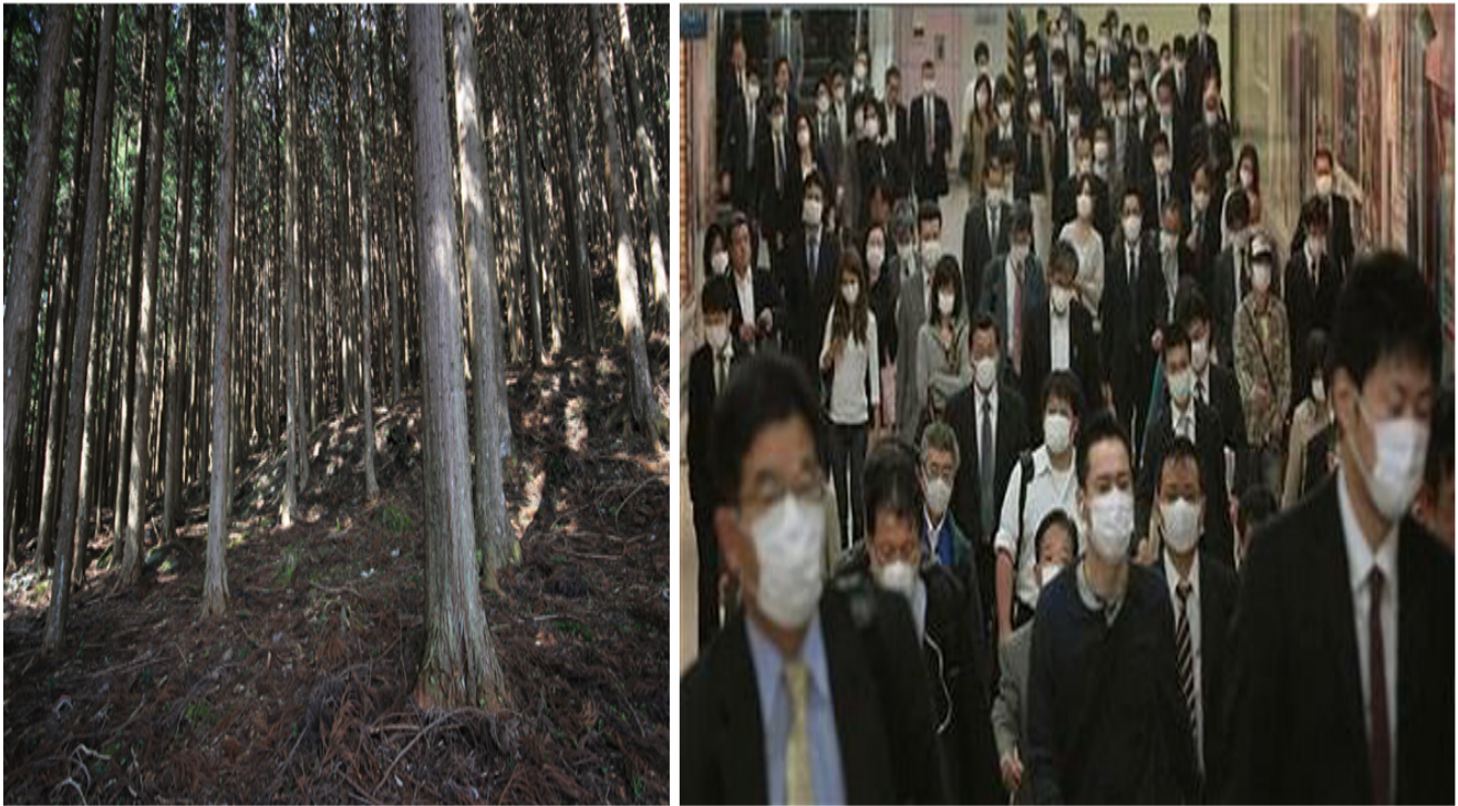
Bosco di monocoltura di sugi.

È un territorio, quello giapponese, che assomiglia sempre di più a un robot se non a un cadavere stretto nella sua protesi di cemento, piuttosto che un ambiente naturale della vita. E nonostante questi scempi, diretti dallo Stato, che durano ormai da decenni, Kerr sostiene che la situazione non accenna a cambiare.