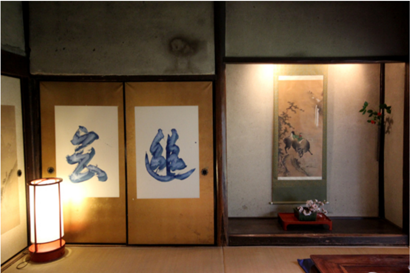
Il soggiorno con oggetti da collezione e la calligrafia in cui si legge “Yû-gen”