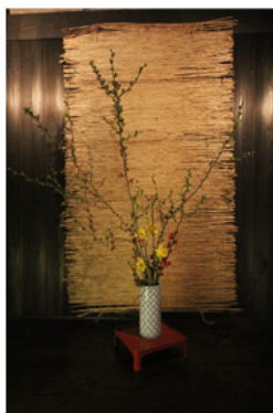
Ikebana a Chiiori.