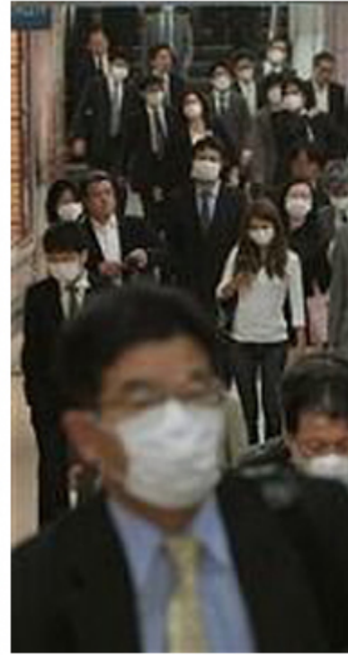
Bosco di monocoltura di sugi. Allergici ai pollini di sugi.