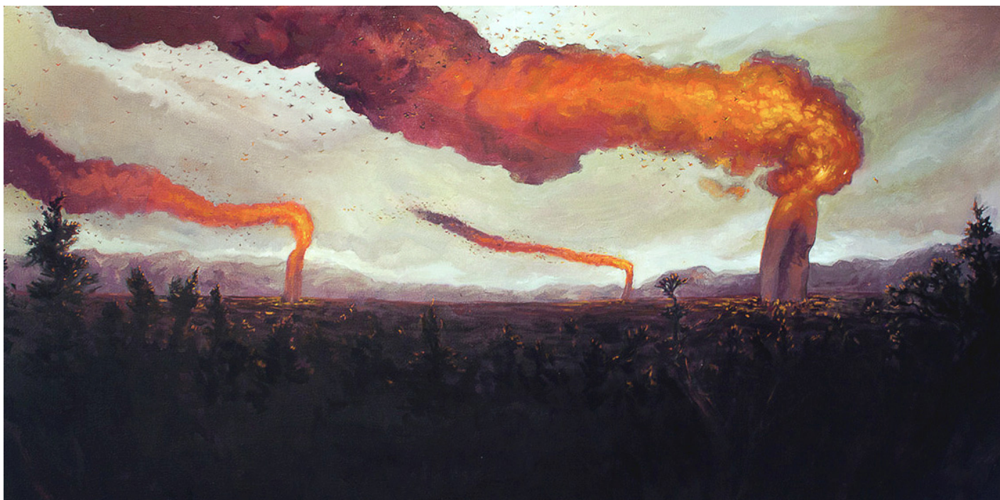
Illustrazione di T. Dylan Moore.

stilistica. Questa influenza si può trovare chiaramente anche nella sua illustrazione. Qui il LAVORO è declinato nel mondo animale, e l'attenzione si posa sull'insetto che nella cultura popolare rappresenta da sempre il LAVORO e la collaborazione: le formiche. Queste sono tratteggiate con pochi tratti di matita, per una tavola caratterizzata da una semplicità disarmante ma di sicuro impatto.