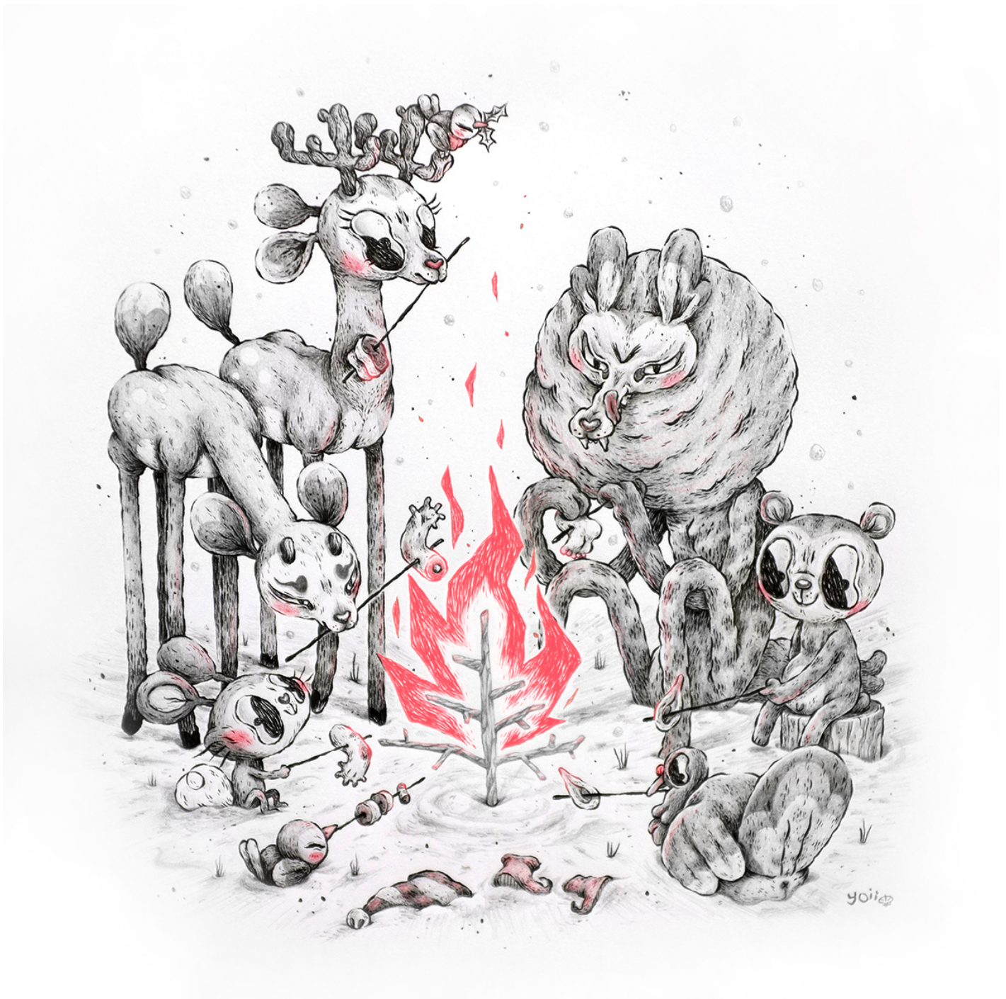
Illustrazione di Anna Johnstone.