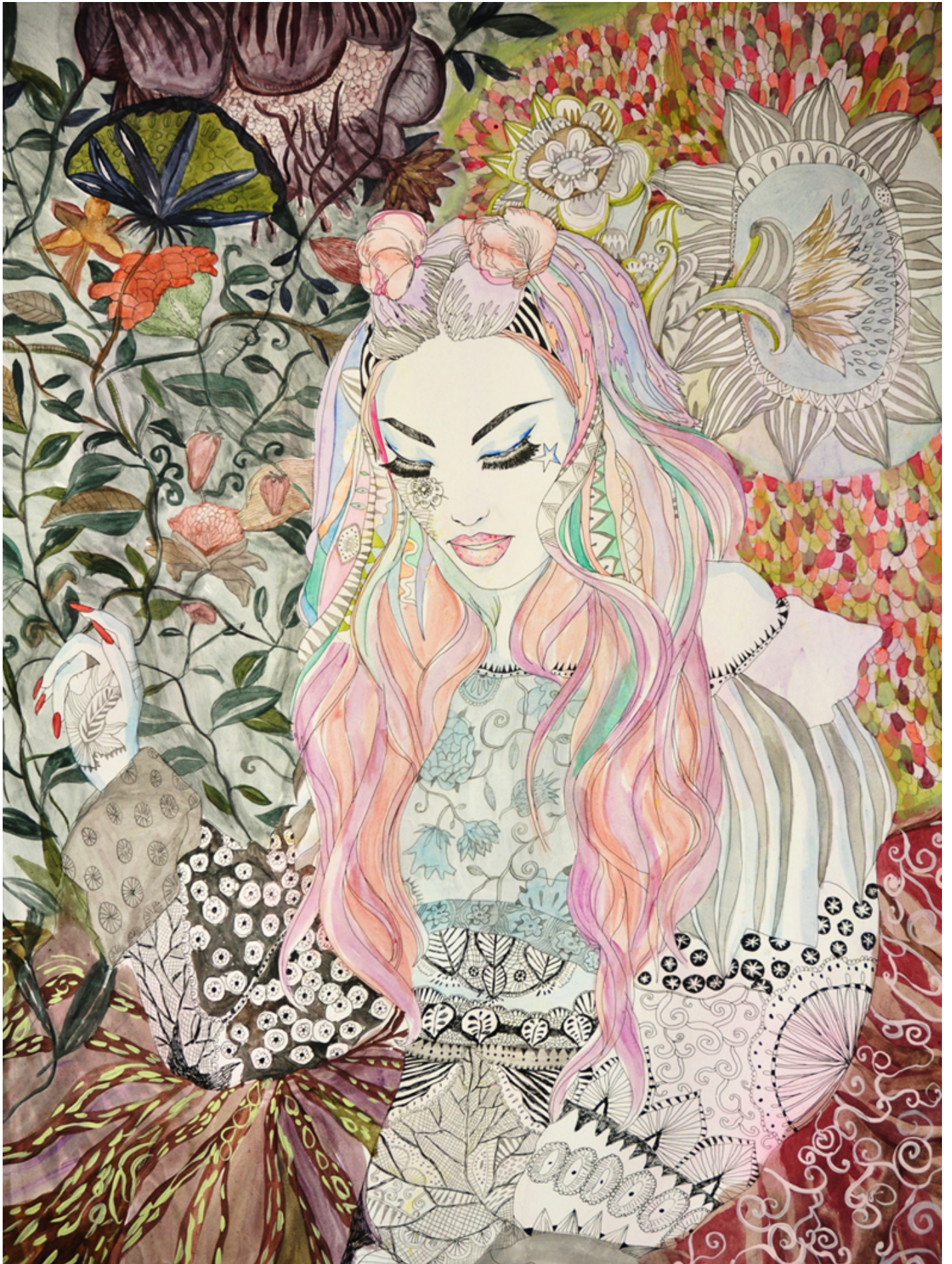
Illustrazione di Aisté Bileviciute.