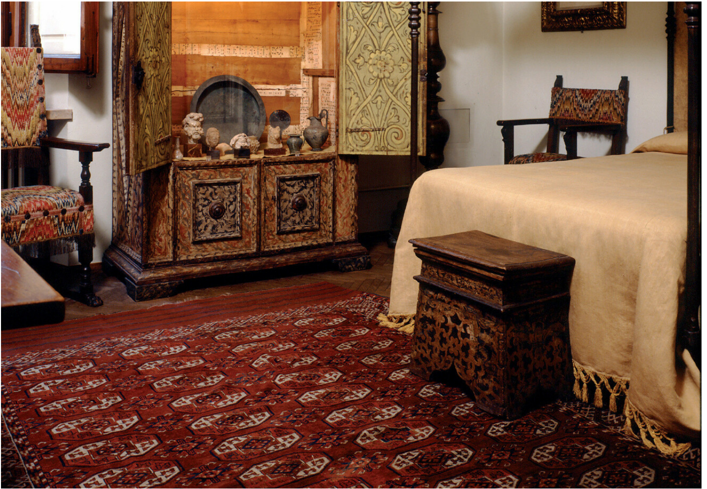
La camera del letto a baldacchino del museo casa Rodolfo Siviero.

L'Accademia dei Lincei, però, le ha tributato un premio nel '61. Enrico Molè, allora senatore e presidente del comitato degli artisti e degli scrittori italiani, le ha scritto: "della gioia, della soddisfazione, della riconoscenza della nostra gente ti do atto e ti ringrazio".