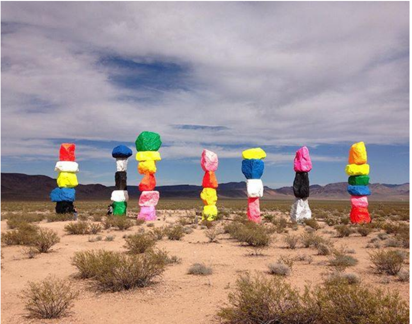
Ugo Rondinone, Seven Magic Mountains, 2016, large-scale site-specific public art installation located near Jean Dry Lake

Le pietre non sono solo statiche e inamovibili. In molti miti e leggende si animano, si muovono. Fissità e movimento sono la coppia che definisce la pietra. Nell'Isola di Metà esiste una pietra che ha figli. La pietra hsiung-huang in Cina ha un sapore freddo e amaro; ad Asso, in Asia Minore, c'è invece una pietra che si fende e si solleva a strati ed è carnivora. In Spagna sono note da molti secoli pietre che partoriscono. Altre ancora, in Irlanda, gridano, oppure, come in Vietnam, sanguinano sotto i colpi di zappa. E ancora una pietra del Nilo somiglia a una fava e possiede la facoltà di non far abbaiare i cani, mentre sul monte Tmolo esiste una pietra che cambia colore quattro volte al giorno e la scorgono solo le bambine piccolissime, che non hanno ancora raggiunto l'età della ragione; questa pietra ha la prerogativa di proteggere dagli oltraggi le fanciulle nubili.