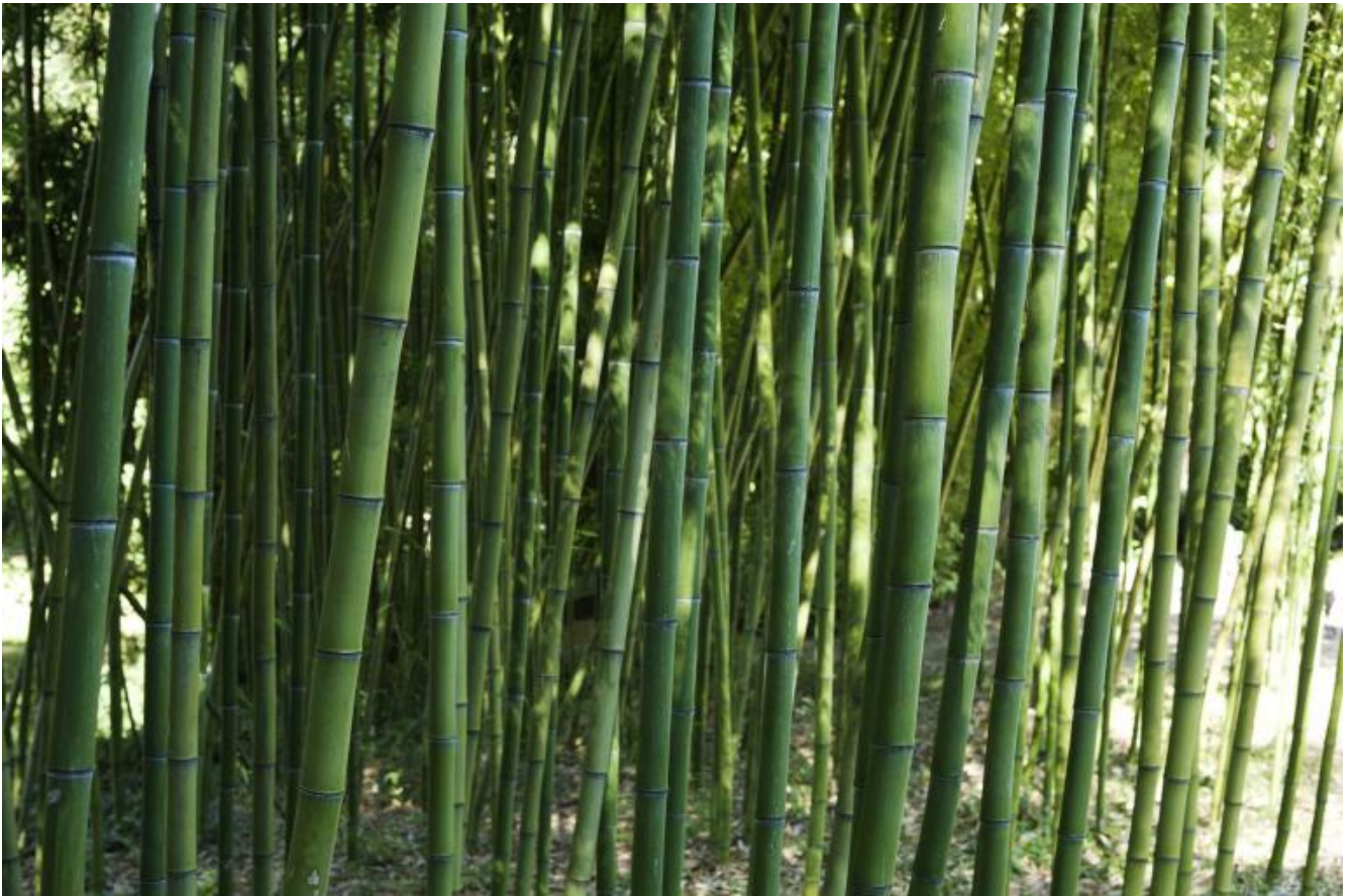
bambù credit Marco Campanini.

Il labirinto che si snoda nell'immaginario di ciascuno ha muri che moltiplicano stanze e impediscono la vista, consentendo a ogni angolo ancora nascosto di ospitare un mostro mitologico o una via d'uscita. Quello di Ricci è un labirinto ludico, in cui i percorsi possibili sono molteplici e così i vicoli ciechi, e in cui si può sempre intravedere qualcosa oltre il proprio sentiero - un altro sentiero, forse quello giusto, e gli altri che magari lo stanno già percorrendo, oltre i fitti muri di canne screziate di giallo e di verde.