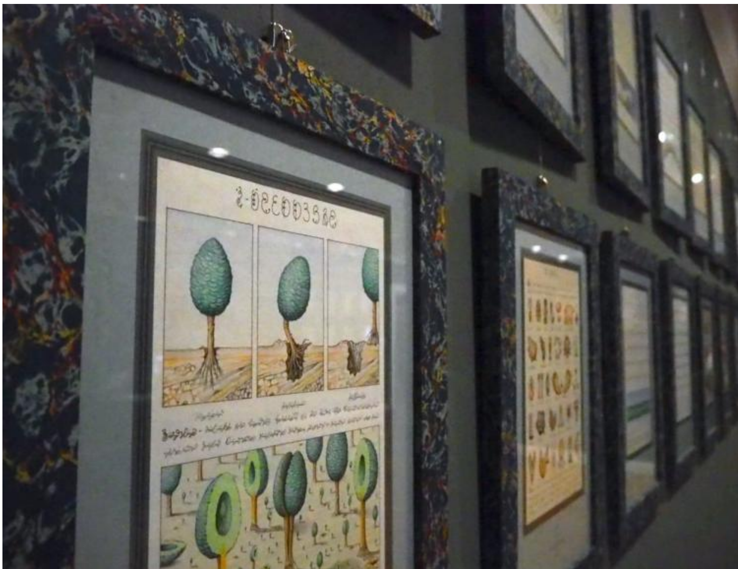
La mostra delle tavole del Codex Seraphinianus di Luigi Serafini al Labirinto della Masone.

Era il 1976 e Luigi Serafini aveva per le mani alcune delle prime tavole, fitte di segni sinuosi e minuti disegni a china e pastello, parimenti incomprensibili, di quello che sarebbe diventato il Codex , enciclopedia perfettamente ordinata di un mondo immaginario e incomprensibile sottoposto a leggi diverse dalle nostre, in cui coccodrilli nascono dall'unione-intersezione di uomo e donna, macchine producono arcobaleni ed esistono serpenti che fanno da lacci per le scarpe. FMR (da leggersi alla francese, ovvero éphémère ) era già FMR, con la Biblioteca di Babele di Borges e la ristampa dell' Encyclopédie . Serafini decise di fare la posta a Ricci sotto il suo studio, tutti i pomeriggi, finché non fosse riuscito a incontrarlo e a squadernargli davanti, senza dire una parola, quei bozzetti sparsi. E così fu, con l'esito che possiamo sfogliare ancora oggi (grazie, tra l'altro, a una più recente edizione Rizzoli, molto più accessibile dell'originale).