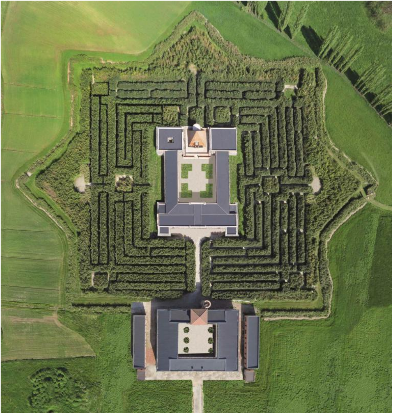
Foto aerea del Labirinto della Masone

Si arriva dopo chilometri e chilometri di pianura Padana, e di campi color stoppa tagliati dalle lingue grigie delle stali intorno a Fontanellato. Si arriva e ci si trova di fronte una costruzione in muratura, a piccoli blocchi regolari dal colore uniforme, scolpiti dalla luce del pomeriggio. Il tempo non ha ancora lasciato segni, sulle mura, e l'aria di nuovo che si respira all'arrivo al grande portale è quasi straniante. Come stare all'interno del sogno di qualcun altro.