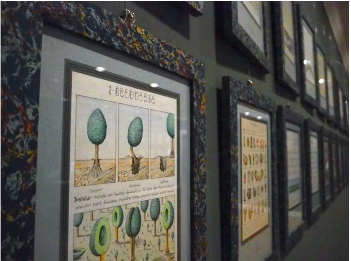
La mostra delle tavole del Codex Seraphinianus di Luigi Serafini al Labirinto della Masone.

Era il 1976 e Luigi Serafini aveva per le mani alcune delle prime tavole, fitte di segni sinuosi e minuti disegni a china e pastello, parimenti incomprensibili, di quello che sarebbe diventato il Codex , enciclopedia perfettamente ordinata di un mondo immaginario e incomprensibile sottoposto a leggi diverse dalle nostre, in cui cocodrilli nascono dall'unione-intersezione di uomo e donna, macchine producono arcobaleni ed esistono serpenti che fanno da lacci per le scarpe. FMR (da leggersi alla francese, ovvero éphémère ) era già FMR, con la Biblioteca di Babele di Borges e la ristampa dell' Encyclopédie . Serafini decise di fare la posta a Ricci sotto il suo studio, tutti i pomeriggi, finché non fosse riuscito a incontrarlo e a squadernargli davanti, senza dire una parola, quei bozzetti sparsi. E così fu, con l'esito che possiamo sfogliare ancora oggi (grazie, tra l'altro, a una più recente edizione Rizzoli, molto più accessibile dell'originale).