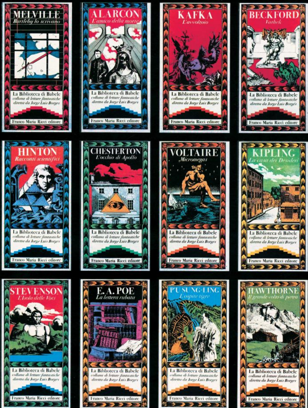
Copertine della Biblioteca di Babele (Archivio Franco Maria Ricci).

Il Labirinto, a quanto ribadisce Ricci, è il precipitato, solido e concreto, in mattoni rossi e canne di bambù, di una promessa fatta a chi di labirinti di carta ne aveva