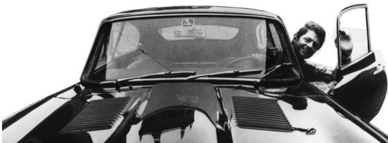
Franco Maria Ricci ritratto da Ugo Mulas.

Jaguar non è una marca, qui, ma un nome proprio, quello della vettura lanciata in velocità per le strade di Milano, in quei veloci anni Ottanta in cui FMR rallentava il tempo della lettura per concedere ai suoi happy few libri sontuosi come codici. Ora la Jaguar, nera come neri sono i libri di Ricci, riposa in mezzo a quel tempio della memoria, del tutto personale e multiforme, che è la Masone. Ed è stato proprio lì che lo abbiamo incontrato, proprio poco sotto il celebre ritratto di Ugo Mulas che lo ha fissato al volante, la consueta rosa all'occhiello, con la sua Parma sullo sfondo.