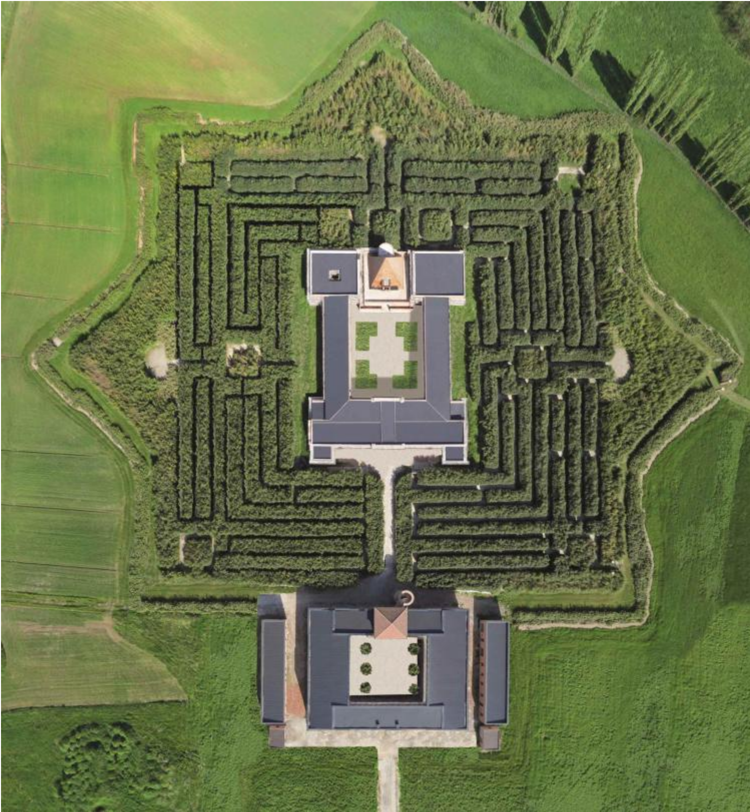
Foto aerea del Labirinto della Masone

Si arriva dopo chilometri e chilometri di pianura Padana, e di campi color stoppa tagliati dalle lingue grigie delle statali intorno a Fontanellato. Si arriva e ci si trova di fronte una costruzione in muratura, a piccoli blocchi regolari dal colore uniforme, scolpiti dalla luce del pomeriggio. Il tempo non ha ancora lasciato segni, sulle mura, e l'aria di nuovo che si respira all'arrivo al grande portale è quasi straniante. Come stare all'interno del sogno di qualcun altro.