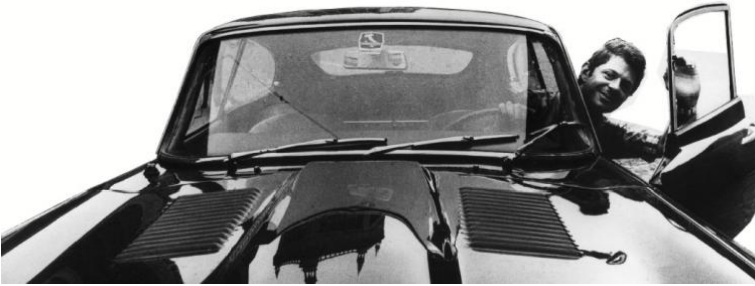
Franco Maria Ricci ritratto da Ugo Mulas.

Jaguar non è una marca, qui, ma un nome proprio, quello della vettura lanciata in velocità per le strade di Milano, in quei veloci anni Ottanta in cui FMR rallentava il tempo della lettura per concedere ai suoi happy few libri sontuosi come codici. Ora la Jaguar, nera come neri sono i libri di Ricci, riposa in mezzo a quel tempio della memoria, del tutto personale e multiforme, che è la Masone. Ed è stato proprio lì che lo abbiamo incontrato, proprio poco sotto il celebre ritratto di Ugo Mulas che lo ha fissato al volante, la consueta rosa all'occhiello, con la sua Parma sullo sfondo.