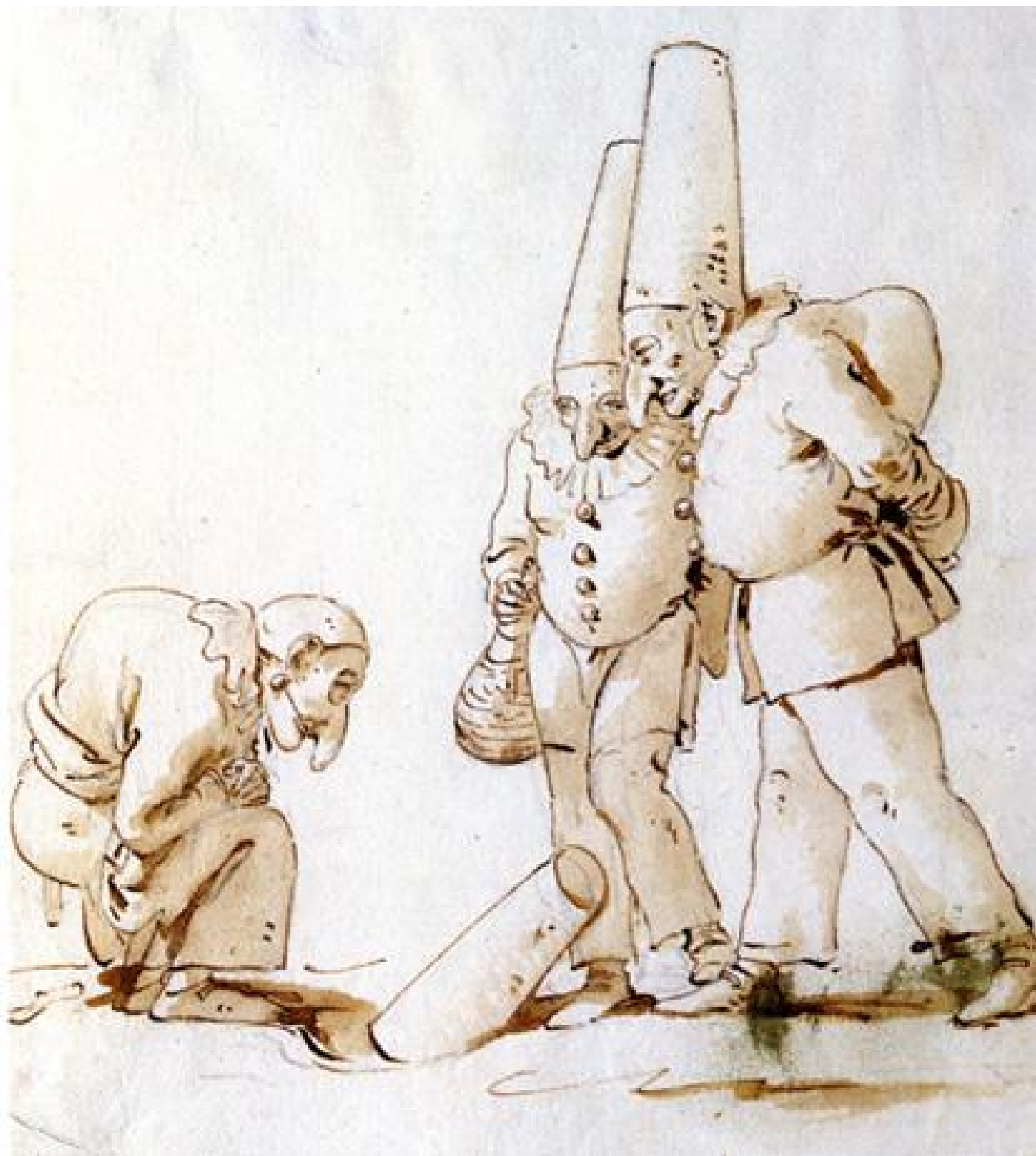
Giambattista Tiepolo, Due Pulcinella e i postumi della Festa degli Gnocchi, 1725-'50, penna, inchiostro, acquerello, Fondazione Giorgio Cini – Gabinetto Disegni e Stampe, Venezia

È in fondo questo che ci consegnano le molteplici immagini di Pulcinella: un io sfuggente e plurale, un'esistenza larvale che accompagna quella degli uomini "veri" e che avrebbe il potere di inceppare la "macchina antropologica dell'occidente" grazie a un corpo ilare e deforme, sospeso fra l'umano e l'animale; un carattere che presenta un tratto di non-vissuto che è come "un clandestino senza volto che mi accompagna giorno dopo giorno senza che io riesca mai a rivolgergli la parola".