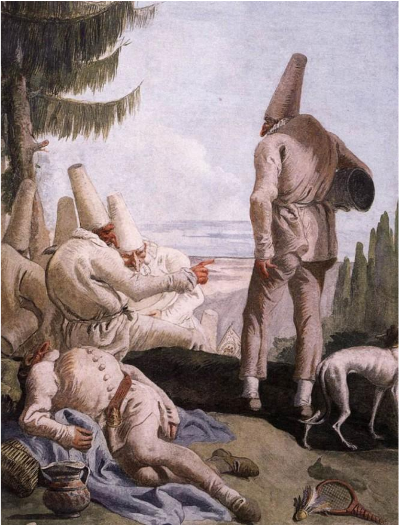
Giandomenico Tiepolo, La partenza di Pulcinella, 1797, affresco. Ca' Rezzonico, Venezia

Agamben intreccia più regimi discorsivi (filosofico, storico, politico, iconografico, autobiografico) entrando e uscendo dai personaggi che il filo del suo pensiero incontra.