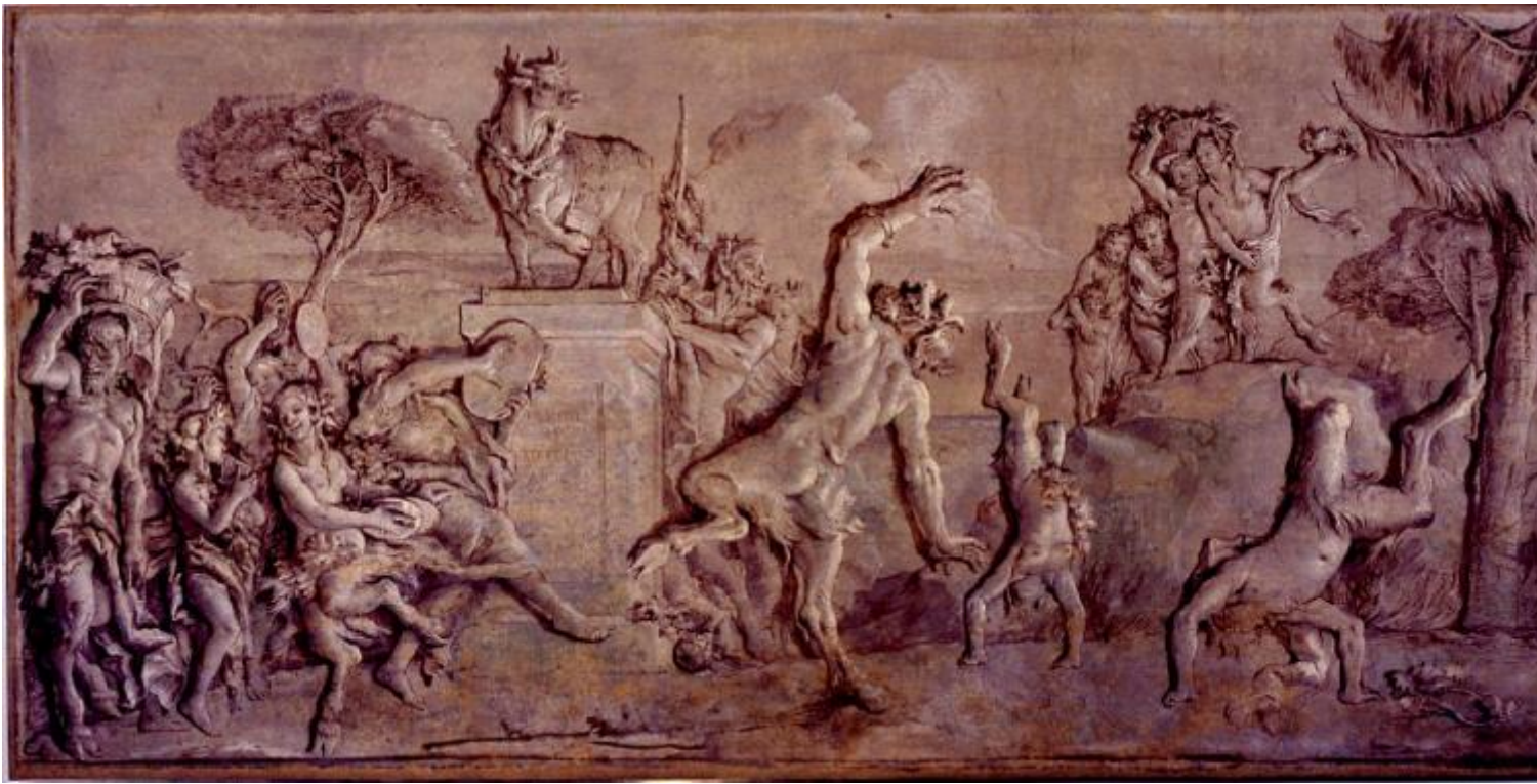
Giandomenico Tiepolo, Baccanale con satiri e satiresse, 1771, affresco. Ca' Rezzonico, Venezia

Agamben scrive che questa simmetria non è casuale, ma è anzi una costellazione visuale dove tali personaggi semi-umani sono i nuovi attori che entrano in scena alla fine di un mondo storico, dotati di una saggezza, una gaia scienza che disinnesci lo “spirito di gravità” in favore di una potenza irragionevole. La parabasi, cioè il momento in cui la commedia si interrompeva e il coro, togliendosi la maschera, si rivolgeva direttamente agli spettatori, sembra essere la condizione di Pulcinella, che “non recita un dramma, lo ha già sempre interrotto, ne è sempre già uscito, per una scorciatoia o una via traversa [...] nella vita degli uomini – questo è il suo insegnamento – la sola cosa importante è trovare una via d’uscita [...] Ubi fracassum, ibi fuggitorium – dove c’è una catastrofe, là c’è una via di fuga”.