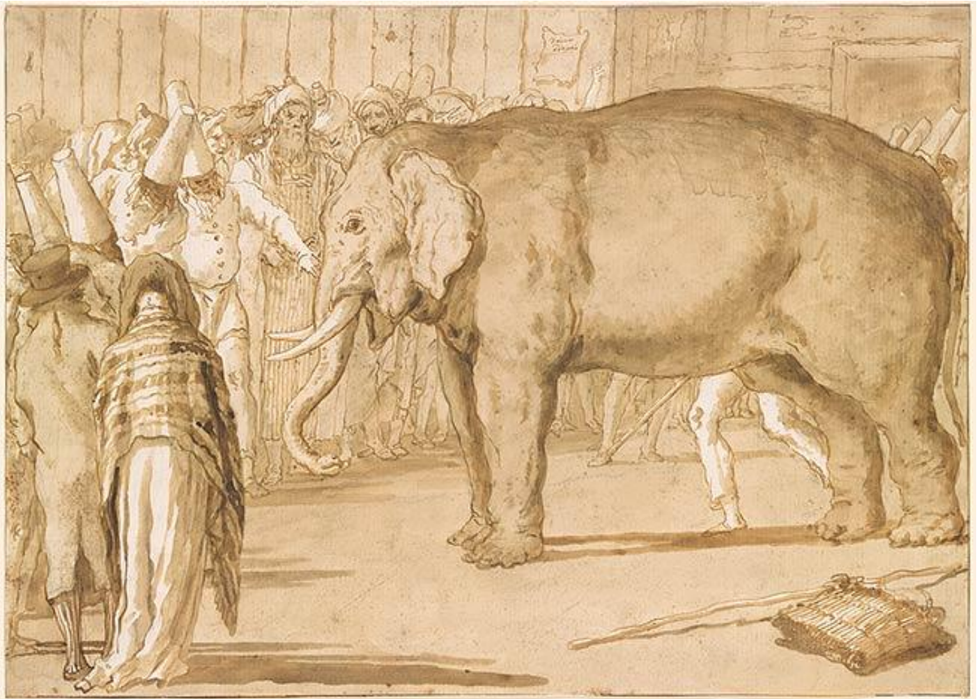
Giandomenico Tiepolo, Pulcinella con un elefante, 1797-1804, penna e inchiostro marrone su carta, The Morgan Library & Museum, New York.

Ma di quale catastrofe si tratta? Qui la riflessione entra in un campo storico e politico. L'impresa artistica delle "pulcinellerie" avviene quando Giandomenico Tiepolo ha settant'anni e si è ritirato nella villa ereditata dal padre Giambattista, dopo che, nel 1797, la Repubblica di Venezia era crollata nelle mani napoleoniche, perdendo una millenaria autonomia. Era la fine di un mondo e "nell'economia di questa fine dei tempi, tutte le cose si ricapitolano in Pulcinella". Questo personaggio filosofico con il quale il pittore si accompagna era già stato il muto testimone, in un grande affresco del 1791, del tramonto di un'epoca e dell'annuncio di una nuova era, il Mondo novo .