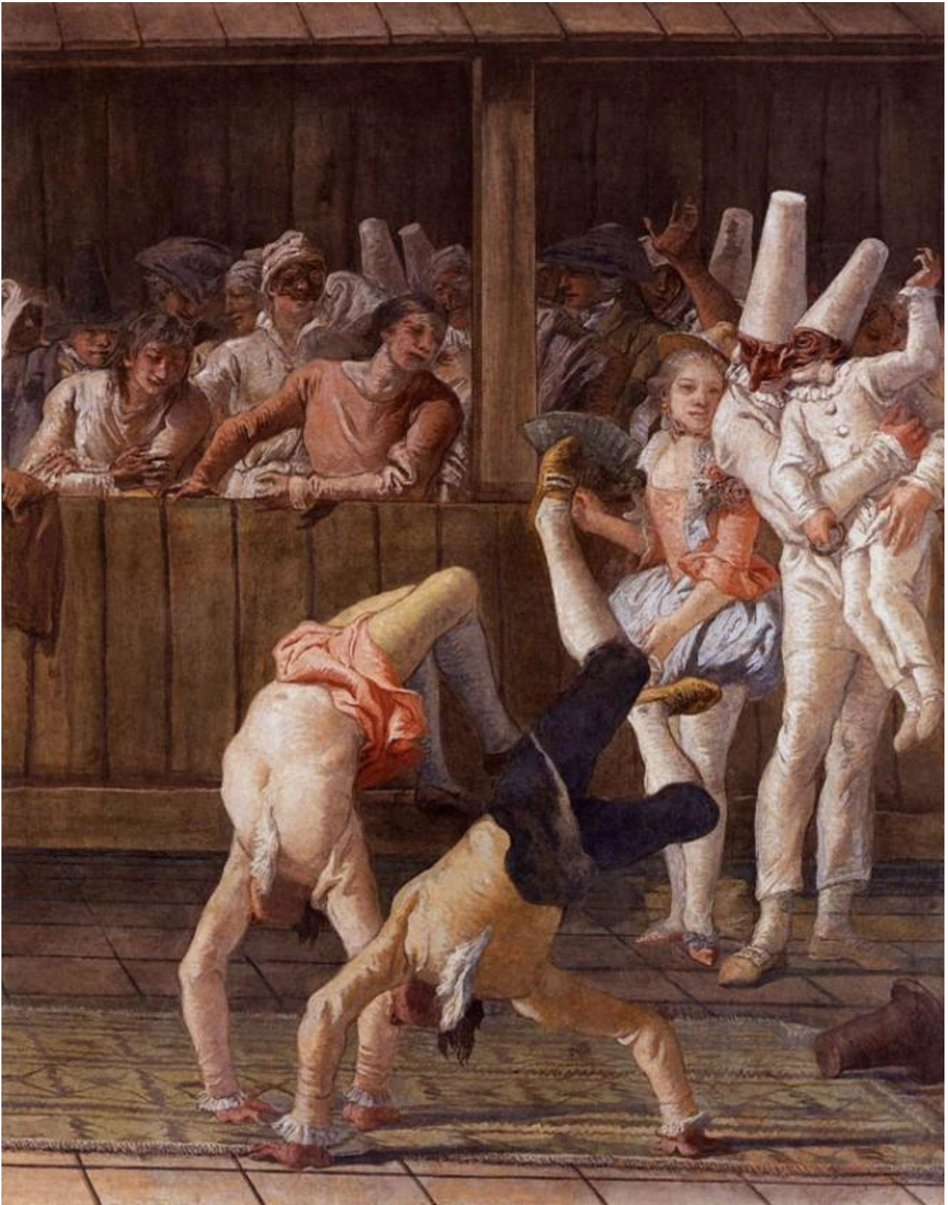
Giandomenico Tiepolo, Pulcinella e i saltimbanchi, 1797, affresco. Ca' Rezzonico, Venezia

Negli affreschi della villa di Ziniago, Giandomenico Tiepolo aveva, anni prima, dipinto scene satiresche e vi sono molte corrispondenze di gesti, pose, situazioni fra i dipinti con protagonisti dei satiri e quelli con i pulcinella.