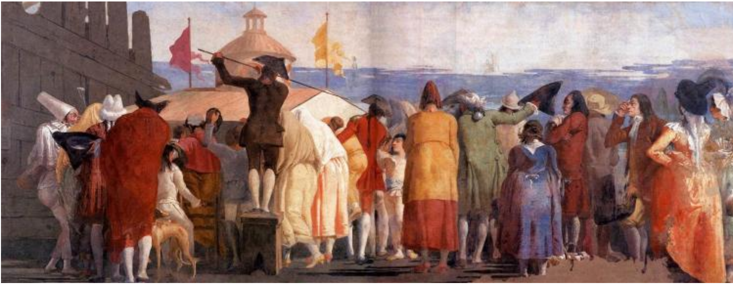
Giandomenico Tiepolo, Il Mondo novo , 1791, affresco. Ca' Rezzonico, Venezia

Una folla di spalle osserva curiosa dentro una finestrella di un casotto dove si mostrano le attrazioni che verranno, i nuovi spettacoli tecnologici della modernità; tutti attendono di guardare dentro un cosmorama, uno dei dispositivi ottici pre-cinema, che permetteva di vedere con grande realismo panorami di luoghi lontani. In un lato ci sono due persone di profilo, il pittore e suo padre Giambattista, al centro, unico che guarda verso l'osservatore, un bambino (il protagonista del mondo che viene), al lato opposto vediamo invece un Pulcinella con il cappello a tubo, un personaggio che “annuncia il regno – o il sogno – intemporale che coincide con la fine di quello storico”. Agamben non si sofferma però su un particolare significativo: è questa l'unica immagine in cui Pulcinella appare senza maschera, ma con il solo volto grifagno, in cui sorriso e pianto sembrano coincidere; nei disegni e negli affreschi successivi di questo infinito divertimento avrà sempre invece la sua classica maschera nera, senza poterla più togliere. Ma nello straordinario gioco di sguardi dell'affresco, vediamo il suo volto così uguale alla maschera, il suo sguardo da un altro mondo che attraversa con disincanto gli sguardi negati della folla di spalle, gli sguardi seri, attenti, curiosi della donna di profilo che chiude il gruppo e dei due pittori che osservano con distacco lo spettacolo.