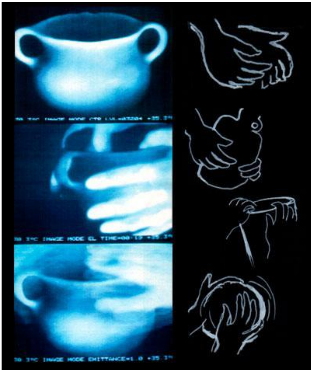
Giardino delle cose.

Entriamo forse così nel regno delle immagini engagées che stanno all'origine dell'attività che immagina il mondo: un potere immaginativo che si risveglia grazie all'interazione di quella mano col mondo delle cose, nella relazione della persona col mondo. Rintracciamo qui il pensiero di Bachelard per il quale, manipolando la materia, trasformeremmo anche noi stessi. E Novalis farebbe eco, ricordando il potere poetico dell'uomo: il contatto sprigiona sostanza .