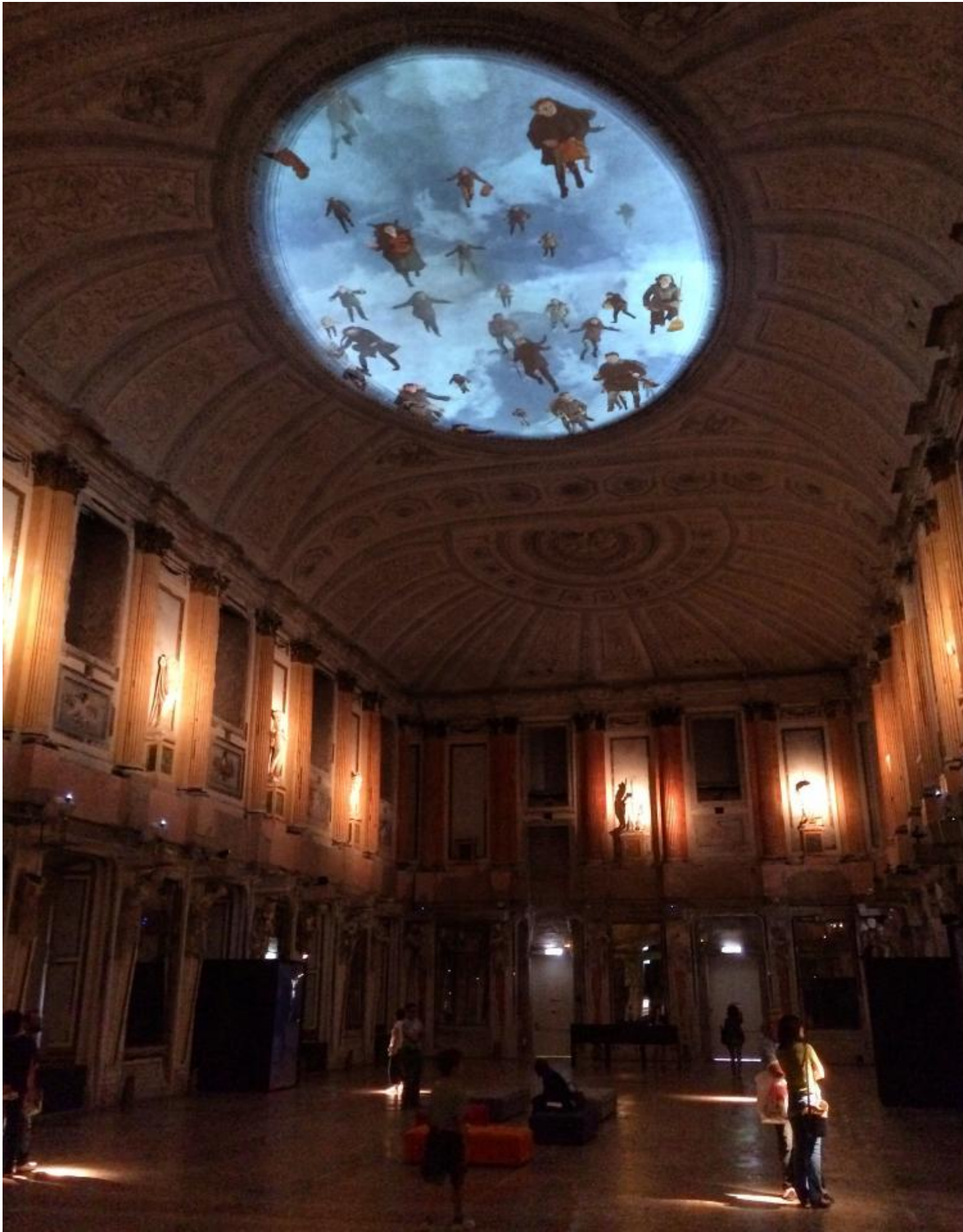
Miracolo a Milano.