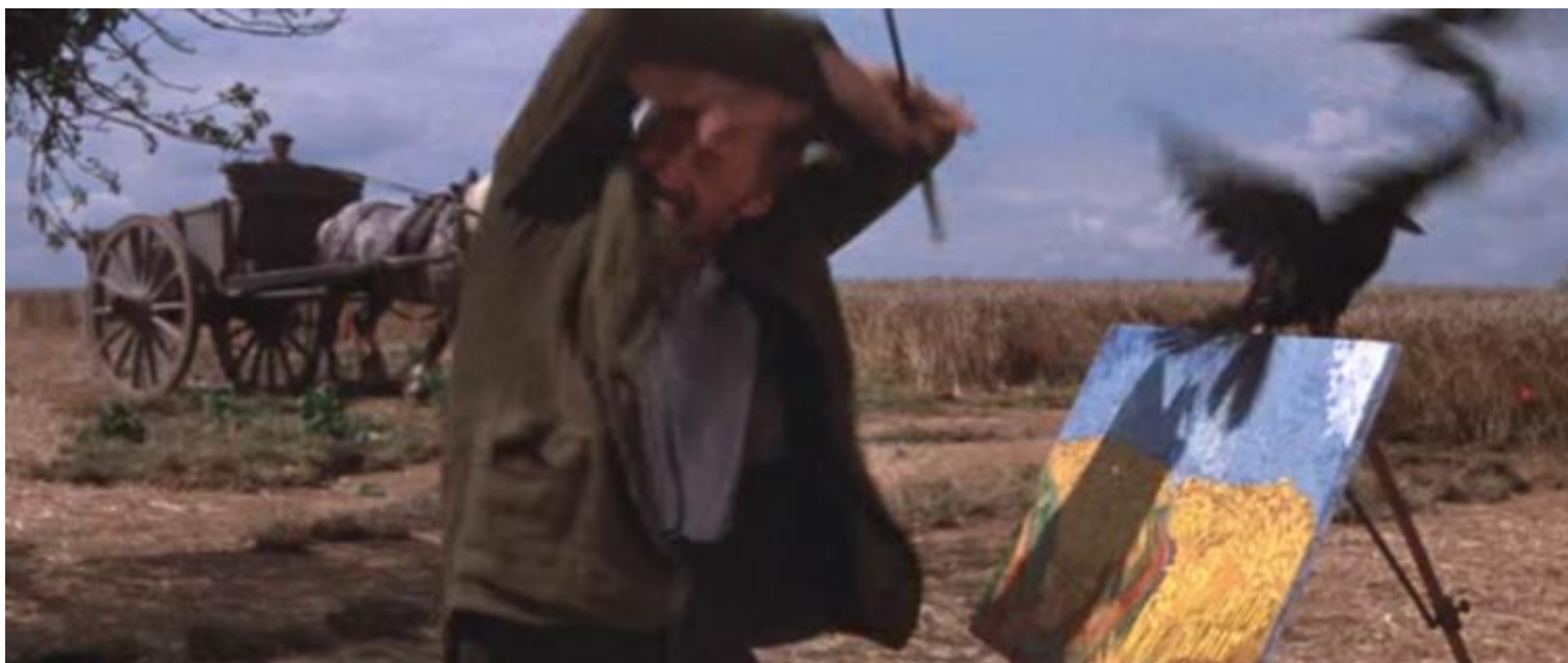
Still da Lust for life, Vincente Minelli, 1956, scena nel campo di grano con i corvi

Non per niente il labirinto è stato il grande omaggio a Van Gogh dello scorso settembre, in occasione del 125° dalla morte dell'artista e del nuovo ingresso del museo. Ben 125.000 girasoli altissimi, disposti in forma di labirinto-giardino, occuparono per quattro giorni parte del Museumplein, per essere donati ai passanti alla fine dell'evento. Girasoli per tutta la città, portati in bicicletta, in tram o a piedi, un'idea geniale per smontare tutto e disperdere festosamente il fiore preferito di Vincent che fu anche compagno del suo ultimo viaggio. Dalla locanda Ravoux di Auvers-sur-Oise al cimitero, sulla sua bara che non aveva potuto entrare in chiesa perché il prete si era opposto, c'era un mazzo di girasoli, Tournesols . Era il 30 luglio 1890, si era sparato una pallottola in petto tre giorni prima, la domenica 27, rimanendo in agonia per quasi due giorni.