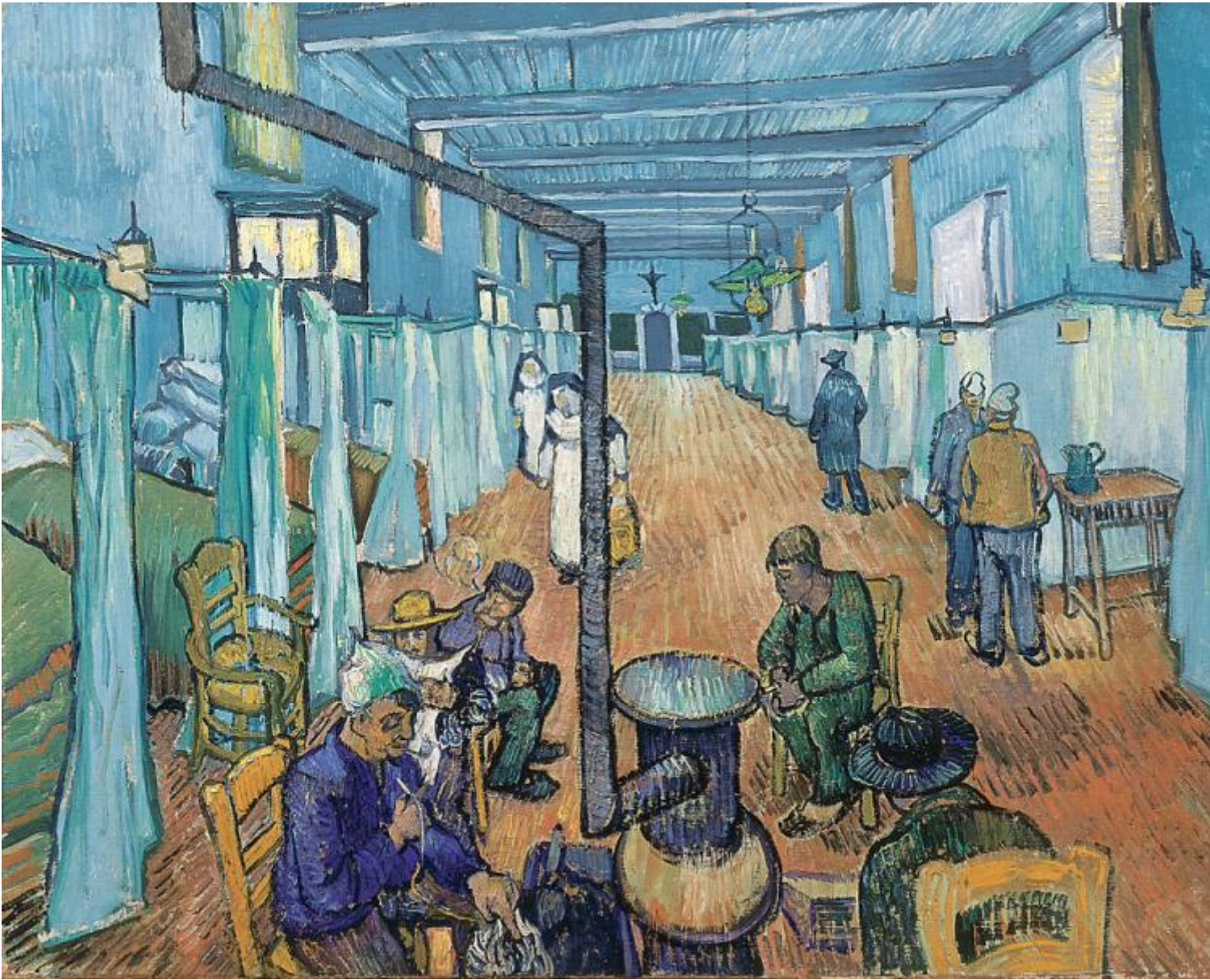
Vincent van Gogh, La corsia dell'ospedale , 1889, Oskar Reinhart Collection 'Am Römerholz', Wintertur

“Quanto a me, andrò a stare 3 mesi in una clinica a St-Rémy, non lontano da qui. In totale ho avuto quattro grandi crisi durante le quali non sapevo minimamente cosa dicevo, volevo, facevo. Senza contare che, prima ancora, sono svenuto 3 volte senza un motivo plausibile e senza serbare il minimo ricordo di ciò che provavo in quel momento.” Queste le parole alla sorella Willemien, a fine aprile 1889.