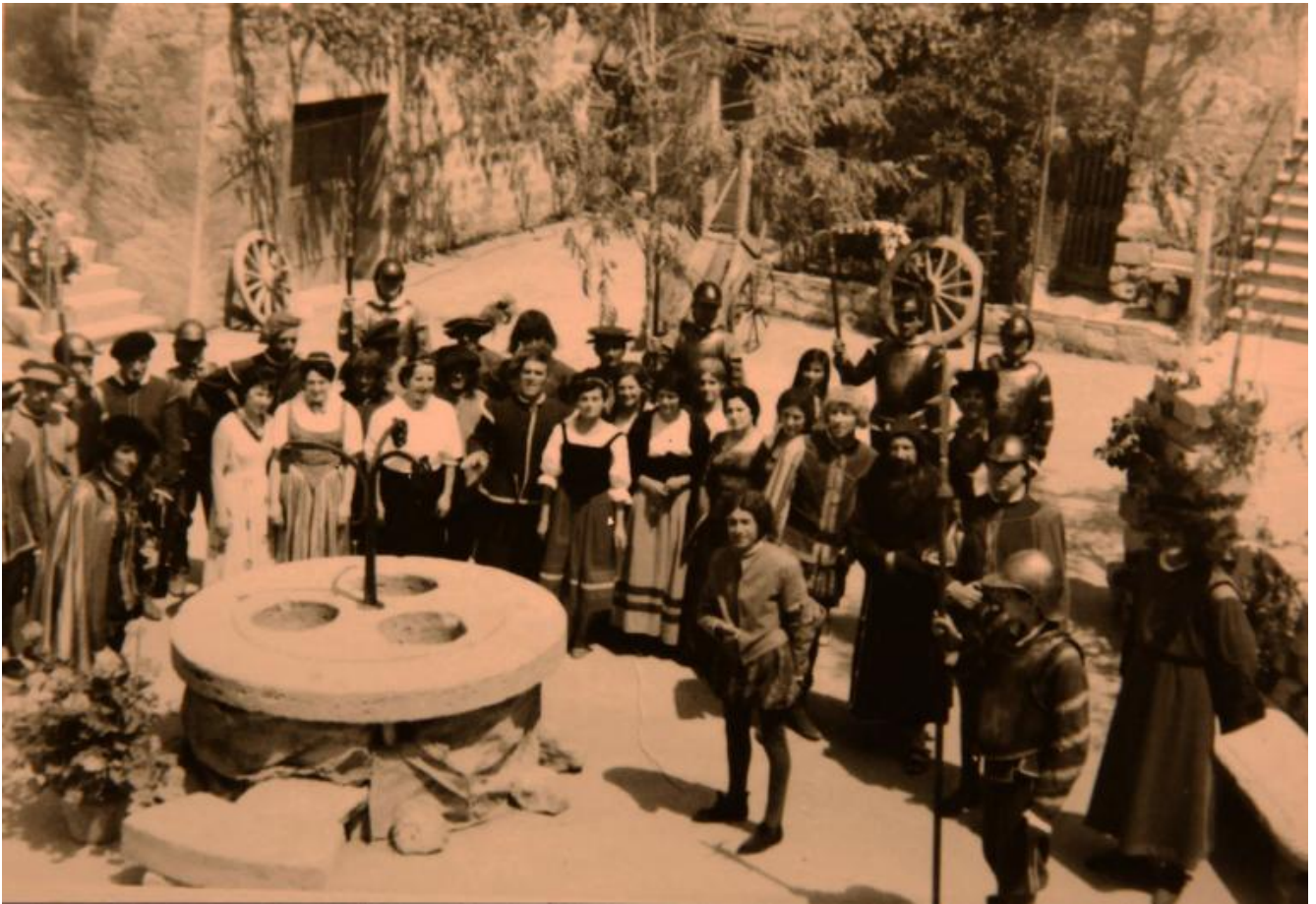
Il primo spettacolo, L'eroina di Monticchiello (1967)

Iniziarono a allestire spettacoli nel 1967, parlando di terra, di lotte dei mezzadri contro i padroni, ricordando la Resistenza e altri episodi di opposizione. Già dai primi anni il Teatro Povero di Monticchiello consolidò un metodo di lavoro originale, con spettacoli condivisi che affrontavano, secondo metodologie del teatro politico e brechtiano allora in voga, nodi della vita del paese: il rapporto tra passato e presente, tra società contadina e modernità, tra campagna e emigrazione. Aggiornandosi con gli anni, via via che il borgo diventava un luogo turistico.