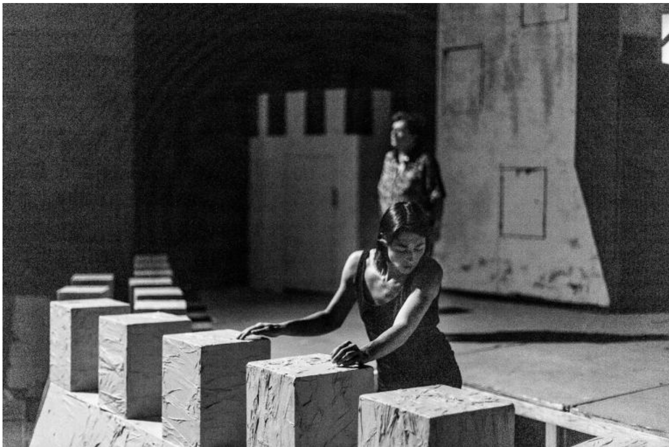
Notte di attesa

Qui, quando le luci si accenderanno, appariranno prima l'ombra di quell'albero secco e di quell'antico paiolo, poi fantasmi umani che inizieranno a costruire effimere mura di cartone. Parleranno molto, disseminando solo dubbi, ipotesi, domande senza risposta, fino a estremi aggrovigliati, fino a cerebralismi da far invidia a Pirandello.