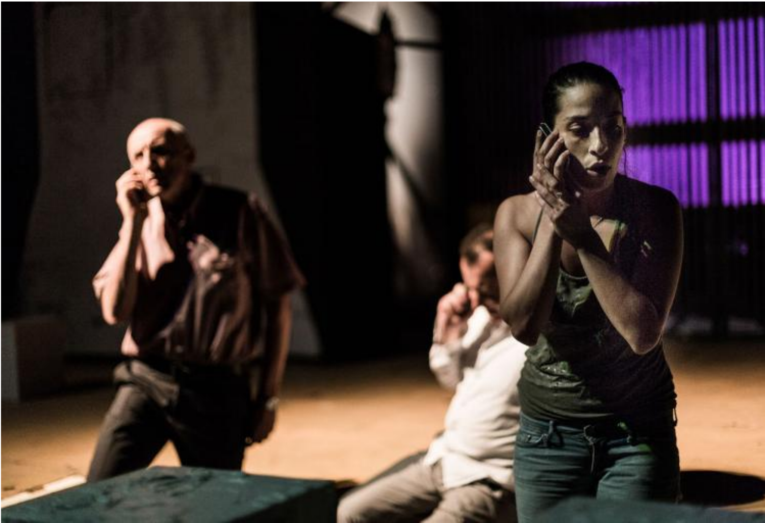
Notte di attesa

La paura è il soggetto di questa notte di veglia. Il timore di ciò che aggredisce un piccolo mondo dall'esterno, ma anche dall'interno, con il rimpianto degli atti sbagliati, delle occasioni perdute. Ritorna la nostalgia per un mondo agricolo più volte, negli anni passati, disegnato come una patria ideale, pur con tutte le sue ingiustizie, i suoi stenti e dolori, e la coscienza di attraversare una contemporaneità difficile.