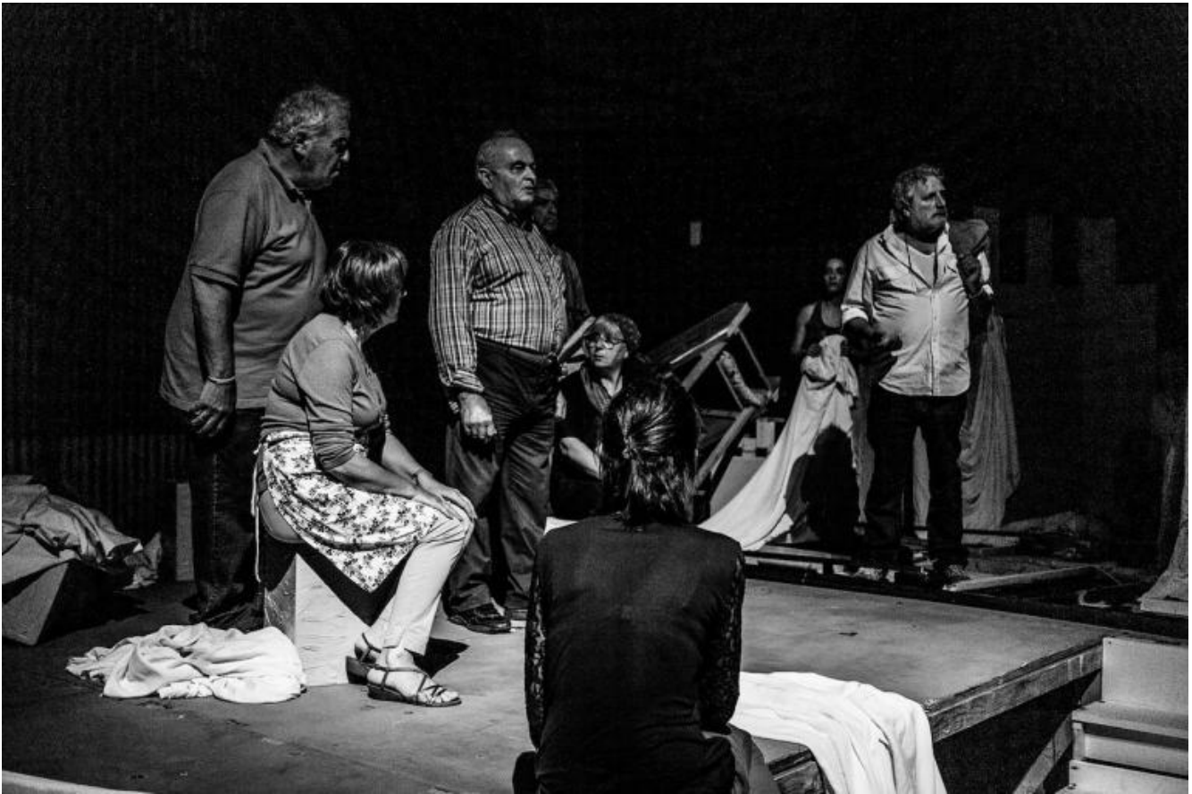
Notte di attesa

Notte di attesa si intitola lo spettacolo di quest'anno. Giorgio Strehler definì queste creazioni collettive "autodrammi", giocando sulla parola psicodramma. Qui non si giocano ruoli per meglio capire la propria posizione psicologica, come appunto nello psicodramma: è un paese che mette in scena se stesso, con mezzi austeri ma suggestivi e efficaci, principalmente per analizzarsi e comprendersi, e si mostra a un pubblico ormai folto, giunto dai dintorni e non solo, per una quindicina di giorni, fino alle soglie di ferragosto.