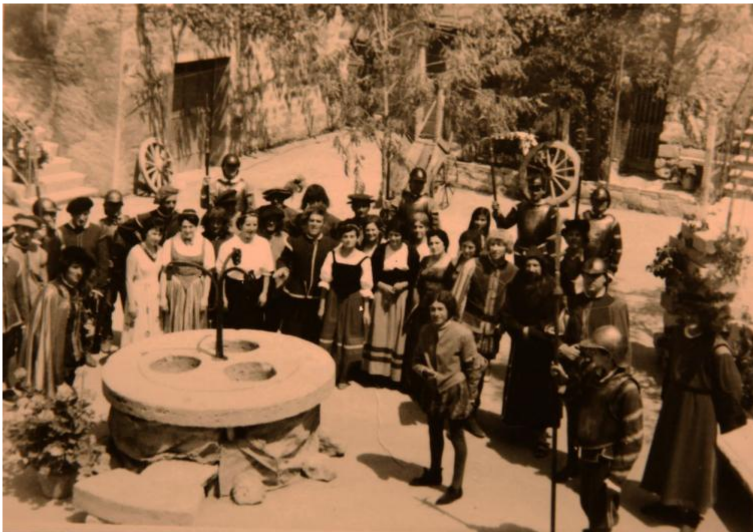
Il primo spettacolo, L'eroina di Monticchiello (1967)

Monticchiello si trova tra i campi bruciati e dorati della senese Val d'Orcia, poco dopo la rinascimentale Pienza, la città ideale di Pio II Piccolomini, oggi odorosa soprattutto di pecorino e di stanze in affitto. In questo piccolo borgo di origine medievale, da cinquant'anni un paese intero fa teatro. Un paese fatto di un centinaio di anime, che in estate o durante le feste si triplicano grazie a tutti quelli che tornano dalle città e agli altri che hanno eletto questo luogo a loro buon ritiro.