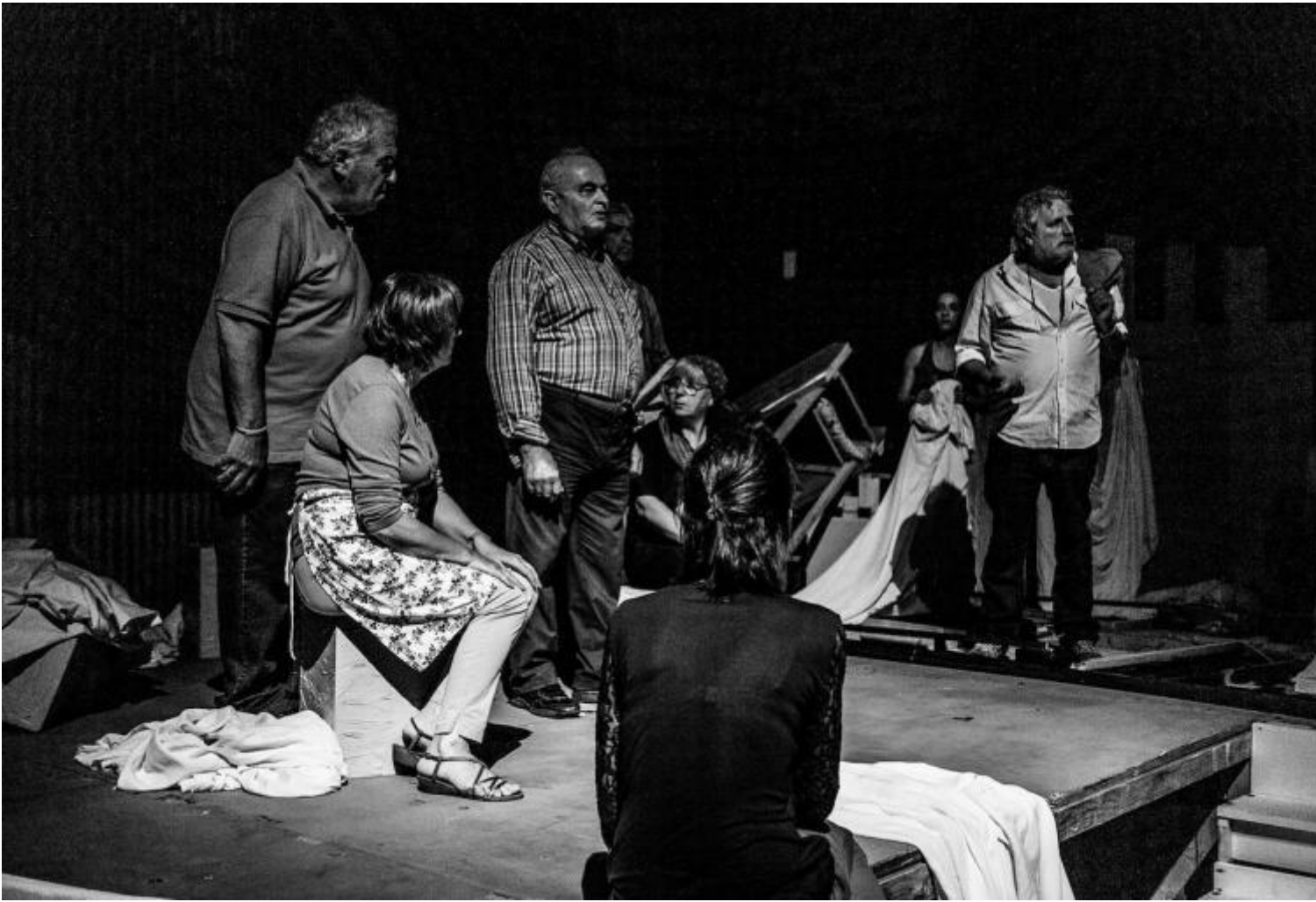
Notte di attesa

Notte di attesa si intitola lo spettacolo di quest'anno. Giorgio Strehler definì queste creazioni collettive "autodrammi", giocando sulla parola psicodramma. Qui non si giocano ruoli per meglio capire la propria posizione psicologica, come appunto nello psicodramma: è un paese che mette in scena se stesso, con mezzi austeri ma suggestivi e efficaci, principalmente per analizzarsi e comprendersi, e si mostra a un pubblico ormai folto, giunto dai dintorni e non solo, per una quindicina di giorni, fino alle soglie di ferragosto.