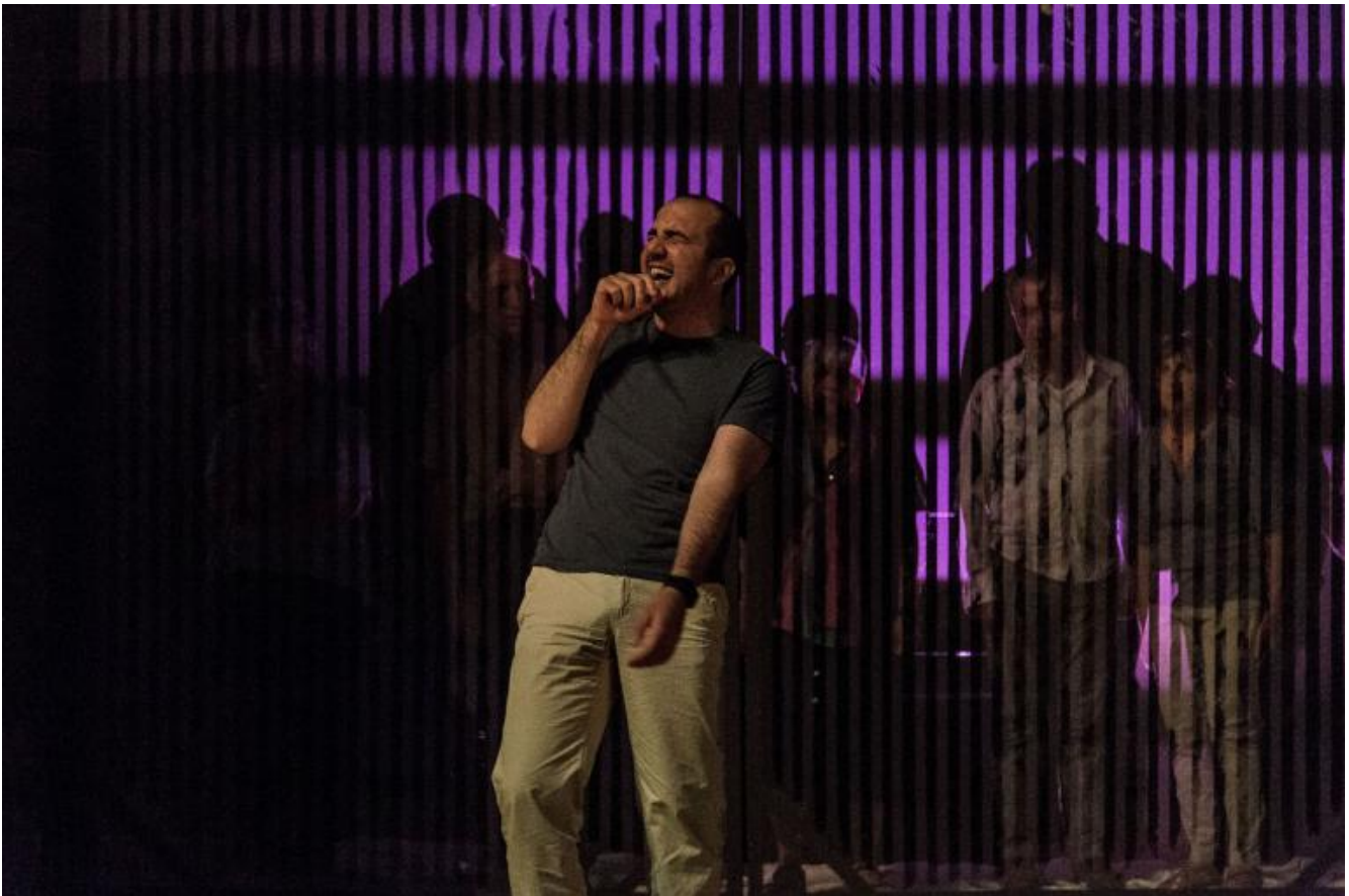
Notte di attesa