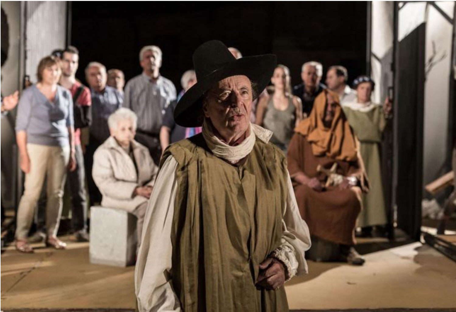
Notte di attesa

Suona una banda. Cadono i teli dei lavori in corso. Si sgretolano i fragili muri. Appaiono tre magici condottieri antichi, teatrali, che porteranno il popolo all'aperto, nelle nuove battaglie contro gli imperiali di oggi. Recitano con voci impostate, d'altri tempi, dense, in quel campo di battaglia sotto le stelle che ha unito tanta gente, per tanti mesi, per tanti anni. Il teatro, questo luogo di interrogazione e volo della fantasia, labirinto del sacrificio e danza di liberazione, bosco sacro dove dai la caccia e sei cacciato, caverna delle apparizioni che entrano dentro di te, profonde, il teatro, rappresentato per cinquant'anni in questa stralunata prospettiva antica di piazza medievale, è la battaglia collettiva contro i mostri della paura. Dalle finestre di un palazzo di cartone b.ambini con le facce serie, dolcemente sognanti, intenti stanno a guardare giorni che possono solo immaginare. Applausi.