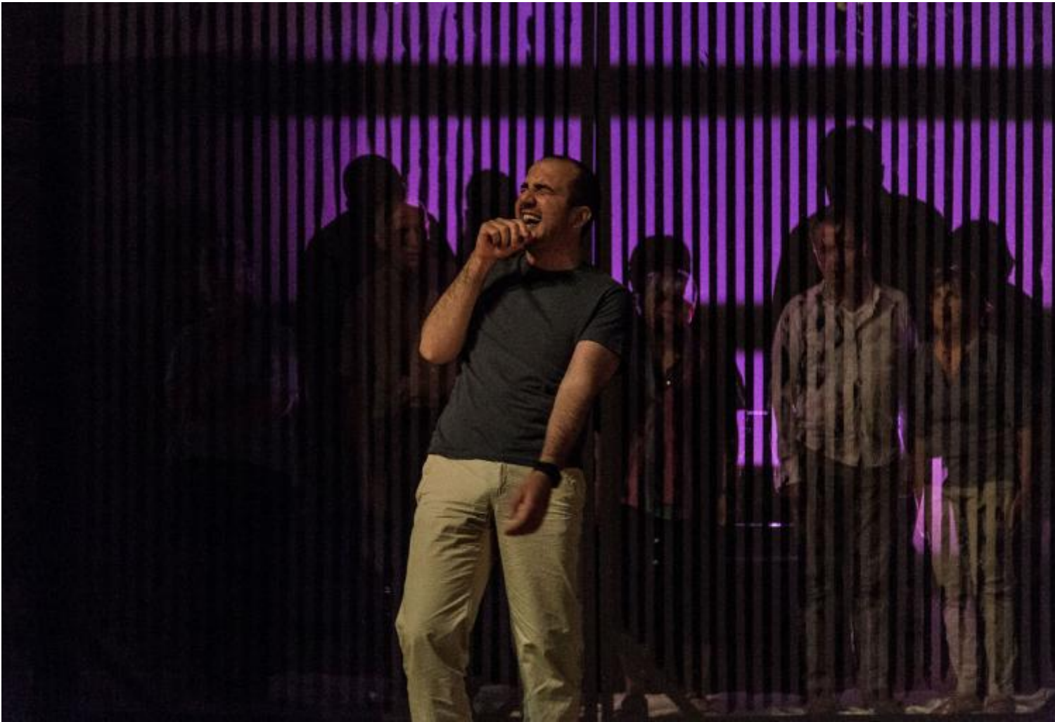
Notte di attesa

E via con le dialettiche, che tagliano il capello in quattro, che tirano in ballo molti argomenti, aprono troppi fili, in un procedimento che ritorna sempre agli stessi punti dopo diversioni, dilazioni, in uno spettacolo forse sovrabbondante, ma alla fine ossessivamente centrato.