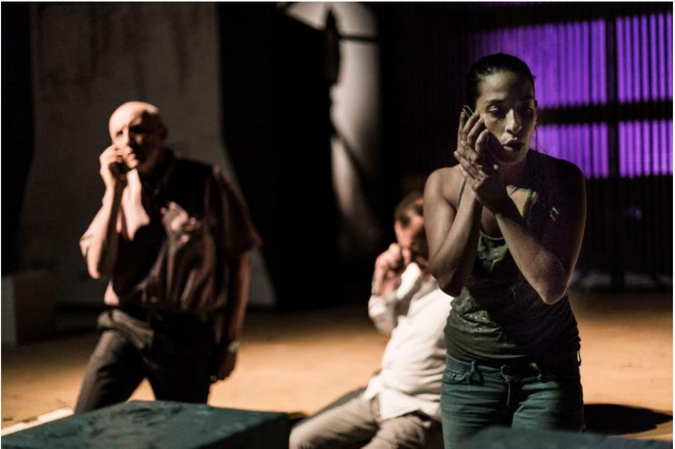
Notte di attesa

La paura è il soggetto di questa notte di veglia. Il timore di ciò che aggredisce un piccolo mondo dall'esterno, ma anche dall'interno, con il rimpianto degli atti sbagliati, delle occasioni perdute. Ritorna la nostalgia per un mondo agricolo più volte, negli anni passati, disegnato come una patria ideale, pur con tutte le sue ingiustizie, i suoi stenti e dolori, e la coscienza di attraversare una contemporaneità difficile.