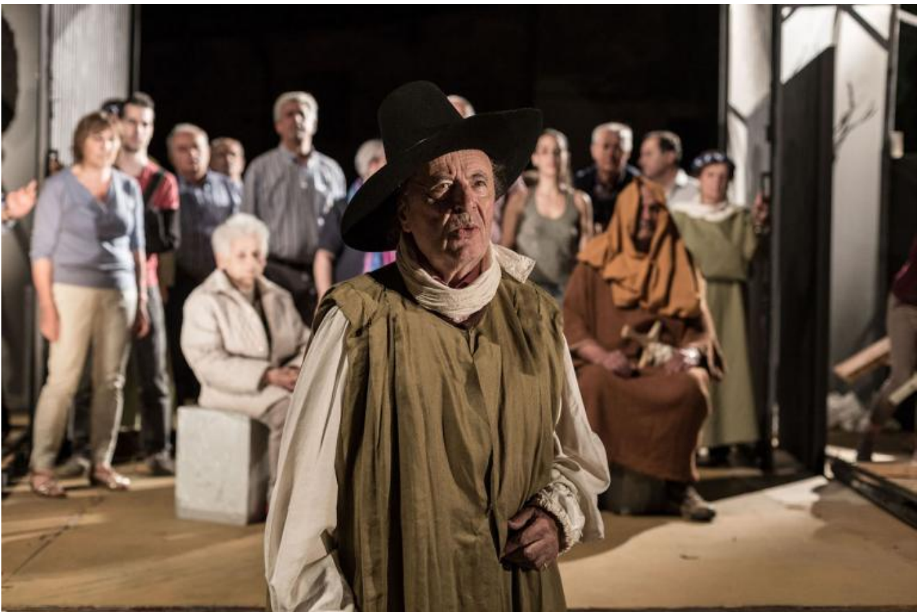
Notte di attesa

Siamo in un vicolo cieco. Sembra non se ne debba uscire. Sarà solo il teatro a suggerire la soluzione. Questo Teatro Povero ricrea, inventa forti legami sociali, in un viaggio durato mezzo secolo ricordato quest'anno con una mostra di materiali storici e con un convegno multidisciplinare che si terrà in ottobre.