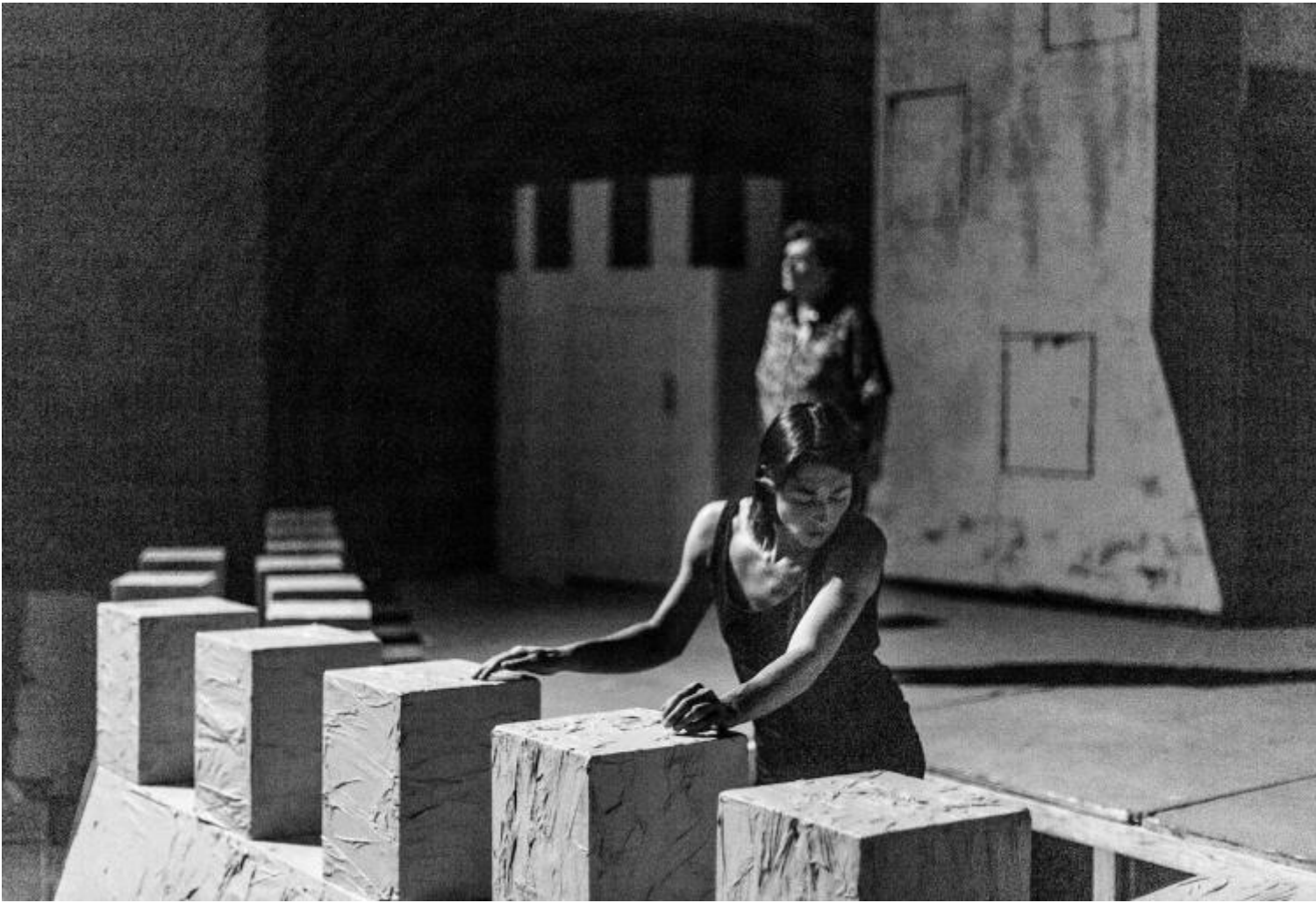
Notte di attesa

Qui, quando le luci si accenderanno, appariranno prima l'ombra di quell'albero secco e di quell'antico paiolo, poi fantasmi umani che inizieranno a costruire effimere mura di cartone. Parleranno molto, disseminando solo dubbi, ipotesi, domande senza risposta, fino a estremi aggrovigliati, fino a cerebralismi da far invidia a Pirandello.