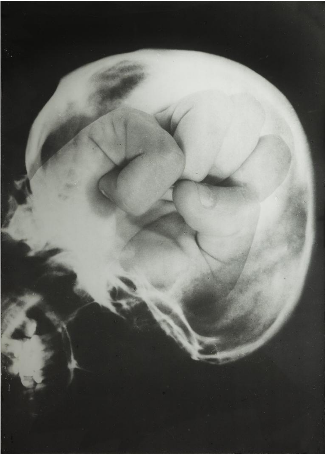
Ketty La Rocca, craniologia, 1973.