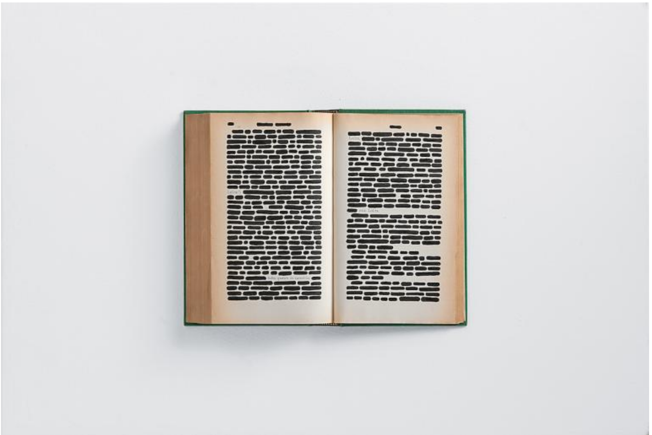
Lolita, 1964 40x60 cm, china su libro tipografico in box di legno e plexiglass, Collezione privata.

In polemica, se così si può dire, con alcuni amici poeti, per Isgrò la parola stanca giunge a una impasse , ma può, quando non tace, tornare a dire qualcosa proprio nella sua relazione con l'immagine, spesso cancellata a sua volta: in questo caso il testo si fa portatore dell'immagine alla mente di chi guarda. Wolkswagen o Jaqueline sono racconti visivi di una sola parola, immediatamente evocativi di eventi entrati nella storia e in una 'nuova, moderna mitologia'. Sono composizioni a tutti gli effetti, come le Storie Gialle e quelle Rosse degli anni'70, in cui quel rosso che in un primo tempo rimanda a Malevič, è in realtà una fotografia cancellata.