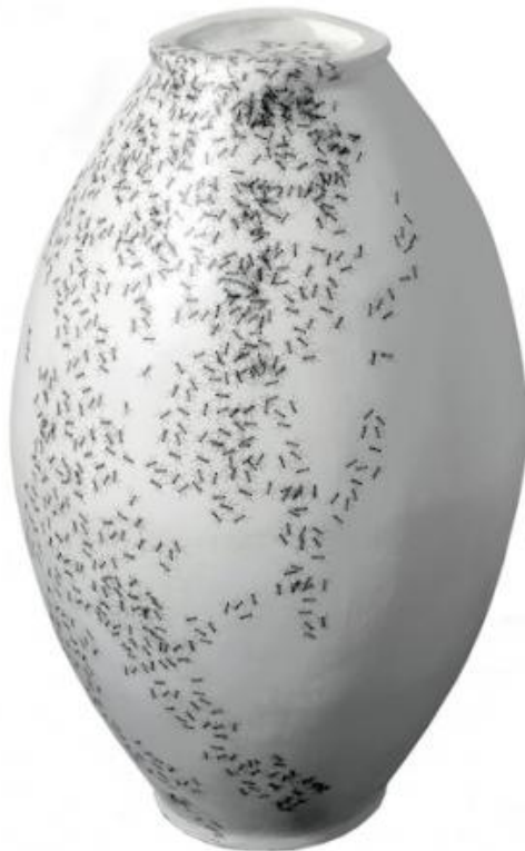
La giara di Gorgia, 2015, installazione per due elementi in dimensione ambientale tecnica mista.