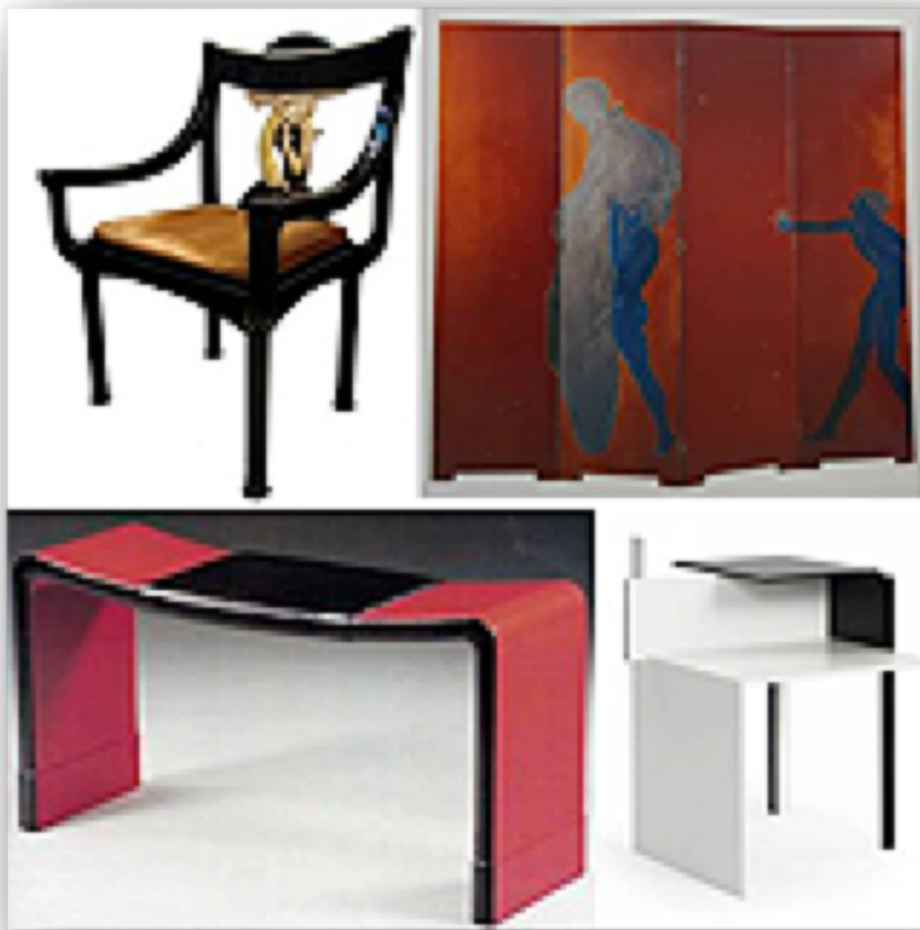
In alto: sedia Sirena in legno laccato, 1912 circa; Le Destin, paravento in lacca, 1914. In basso: panca in legno laccato, 1920 circa; tavolino De Stijl in legno laccato, 1924.

Nel 1922 a Parigi, con l'aiuto di Badovici, con cui aveva stretto un legame professionale già dall'anno precedente, la Gray aprirà la Galleria "Jean Désert", al numero 217 di rue du Faubourg-Saint Honoré, stabilendo un duraturo rapporto di collaborazione anche con il maestro Seizo Sugawara, esperto in lavori in lacca che proveniva dal villaggio di Jahoji, in una zona del Giappone famosa per questo tipo di artigianato. La galleria resterà aperta solo fino al 1930, quando sarà costretta a