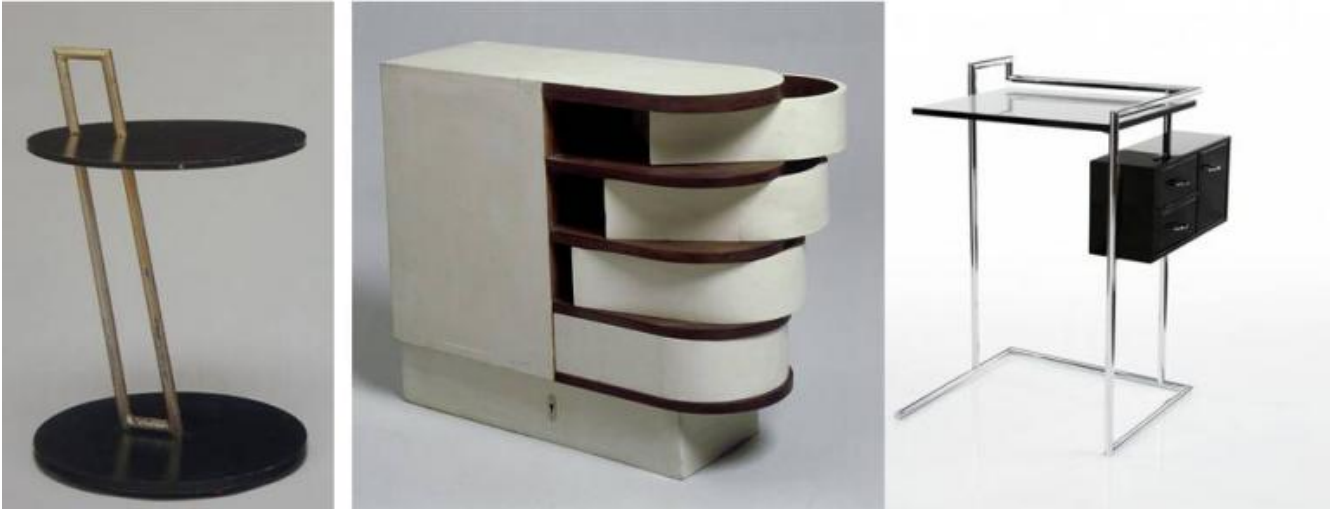
Alcuni arredi della E-1027: Table portable in legno laccato e tubolare d'acciaio, 1925-30; Cap-Martin E-1027 mobile in legno laccato con cassetti basculanti, 1925-26; Petite coiffeuse mobile in legno laccato e tubolare d'acciaio, 1925-26.

Museum of Ireland acquisisce il suo intero archivio e allestisce un'esposizione permanente delle sue opere a Dublino .