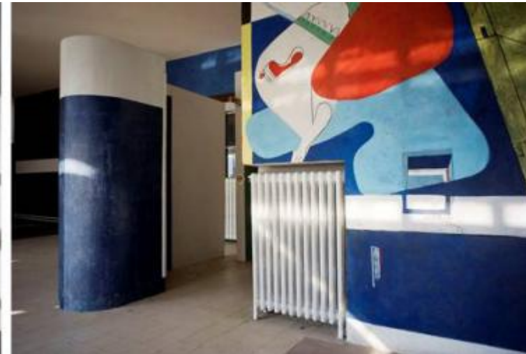
Sopra: vedute degli interni della E-1027 dopo i restauri: un angolo con la Petite coiffeuse; il cielo di una delle scale a chiocciola; Le Corbusier, pittura murale nella zona bar e il paravento-quinta in muratura dell'ingresso (in parte ricostruito). Sotto: vedute del salone con la grande vetrata aperta sul mare, nella prima foto sedia Transat, nella seconda poltrona Bibendum.

Purtroppo non ho conosciuto personalmente Eileen Gray ma il mio incontro con i suoi progetti di arredo è avvenuto poco dopo che questi erano diventati famosi, quattro anni prima della morte dell'artista, che aveva già più di novant'anni. E ciò è accaduto in seguito all'asta della Collezione Doucet, uno dei più grandi stilisti parigini di inizio Novecento, amatore d'arte, tra i primi a collezionare i mobili dell'artista irlandese (insieme ad altri capolavori, quale, ad esempio, "Les Demoiselles d'Avignon" di Pablo Picasso). All'asta Doucet, tenutasi a Parigi all'Hotel Drouot (8 Novembre 1972), un americano acquista il paravento Le Destin per trentaseimila dollari e Yves Saint Laurent si aggiudica la sedia Dragon (si tratta degli unici due pezzi firmati dalla Gray, dietro esplicito invito dello stesso Doucet). La notizia fa subito scalpore e rimbalza sui principali quotidiani, da Le Figaro a Le Monde, dal Times all'Herald Tribune e il nome della Gray riemerge dall'ombra