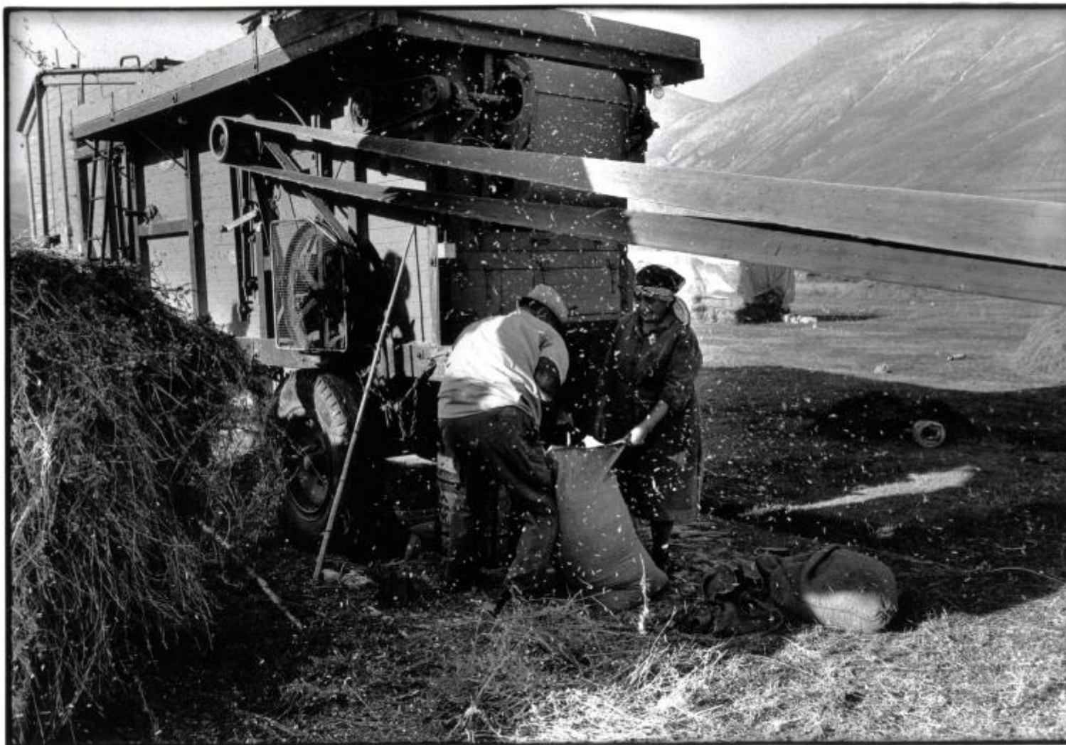
Raccolta delle lenticchie di Castelluccio 1988.