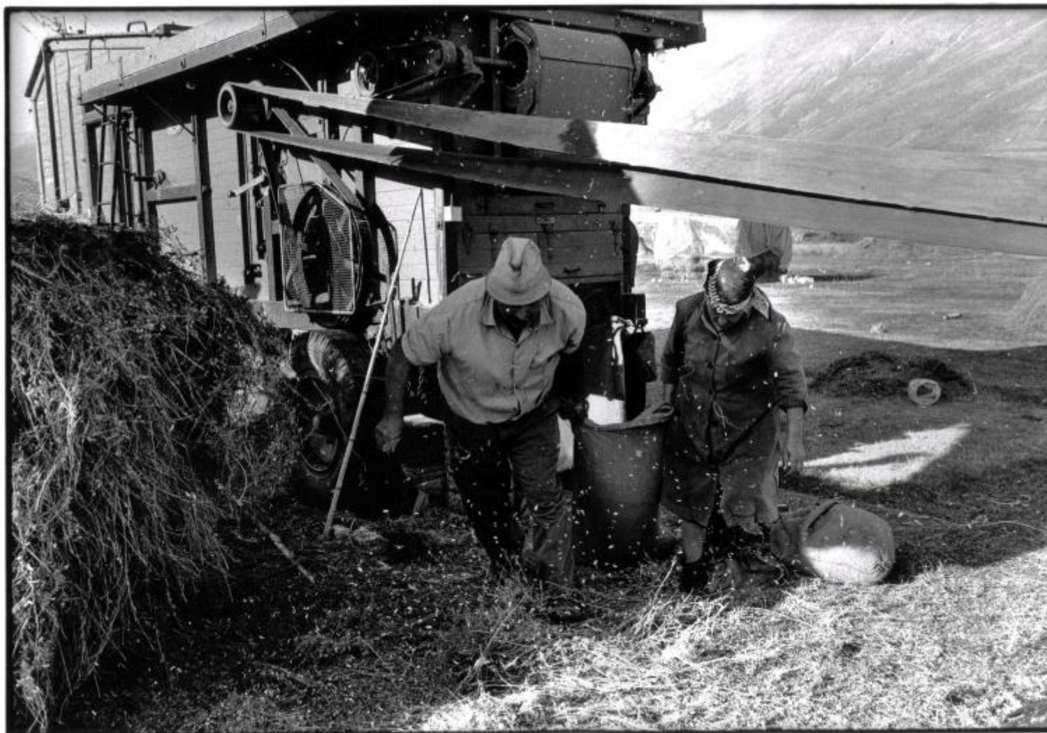
Raccolta delle lenticchie 1988, ph Salvatore Piermarini.

Partivamo di notte per evitare il caldo del sole e, alle prime luci dell'alba, dopo aver superato pietraie e vasti prati inclinati e scomodi, ci fermavamo alla Fontana delle Ciaule – un tipo di cornacchia molto rumorosa e ciarlina – dove consumavamo la nostra prima colazione: fette di pane con frittata bagnate dall'acqua fresca che sgorgava nelle trocche, le vasche predisposte per pecore e pastori. Poi, zigzagando in salita per un pendio molto ripido e abitato da nidi di vipere che ci obbligavano a muovere i bastoni davanti ai piedi, raggiungevamo costeggiandolo il rifugio Zilioli, adagiato sulla cresta sinuosa della Sella. Da lì ci aspettava l'ultimo tratto di roccia e pietre per la cima del Vettore. Il ritorno era in discesa, ma non meno faticoso della salita.