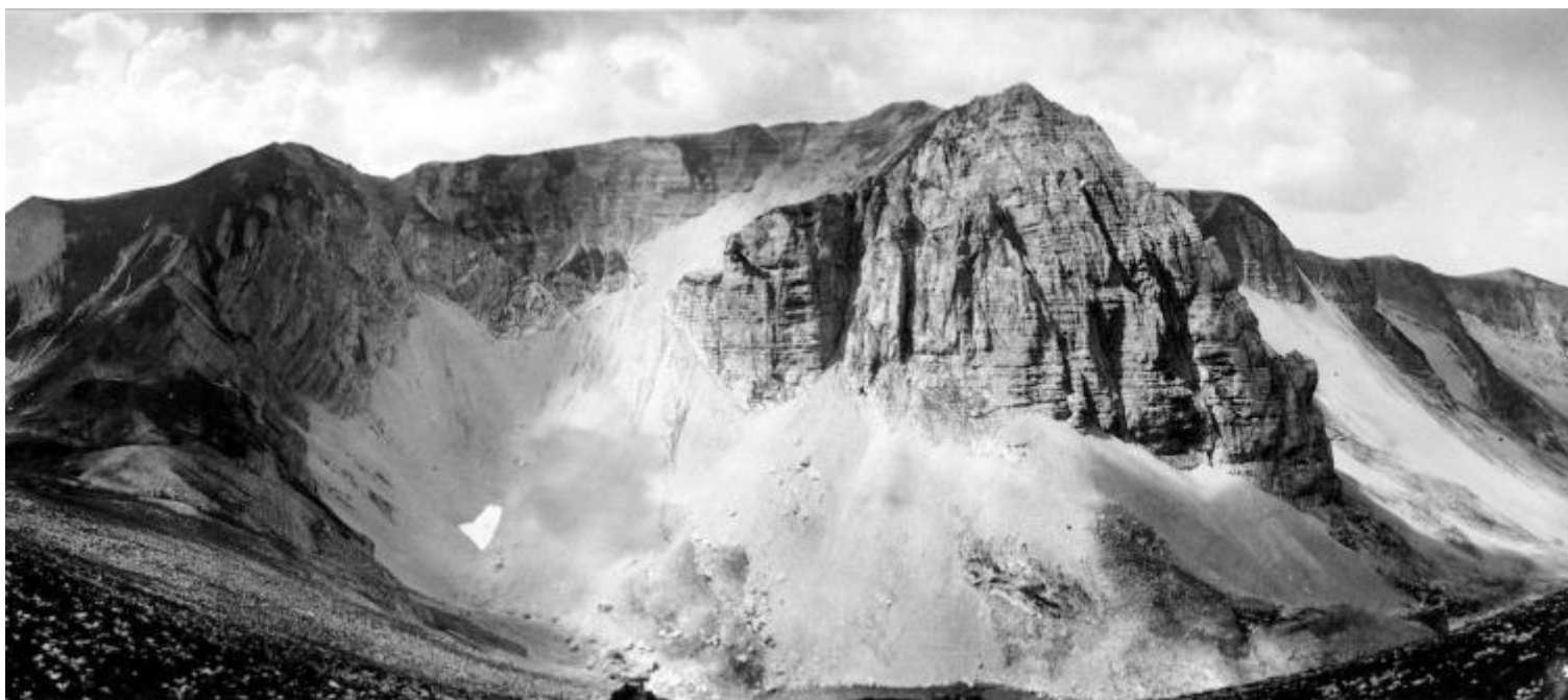
Cima del redentore, Pizzo del diavolo, lago di Pilato dalla vetta del Monte Vettore, ph Salvatore Piermarini.

Come leggere questi luoghi di montagna – a loro modo unici, magici e incantevoli – responsabili dell'ultimo terremoto che ha colpito Arquata, Amatrice e le decine e decine di borghi di un confine geografico ristretto che raccoglie, in pochi chilometri in linea d'aria, ben quattro regioni del centro Italia (Marche, Umbria, Lazio e Abruzzo)?