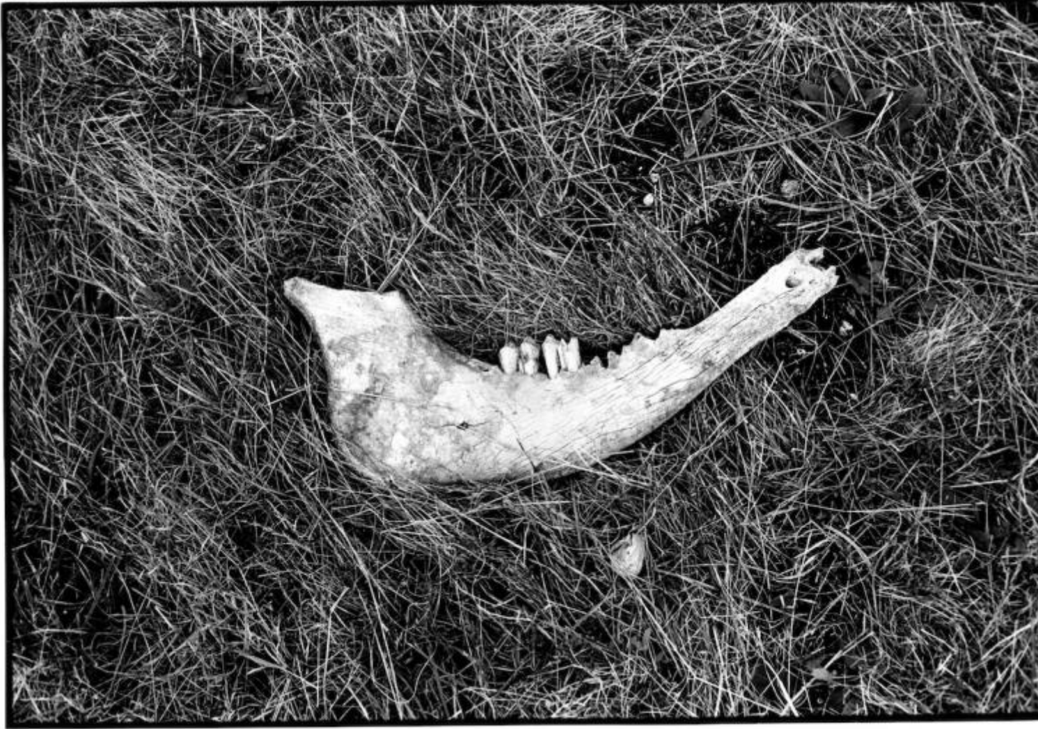
Monte Vettore 1988, ph Salvatore Piermarini..