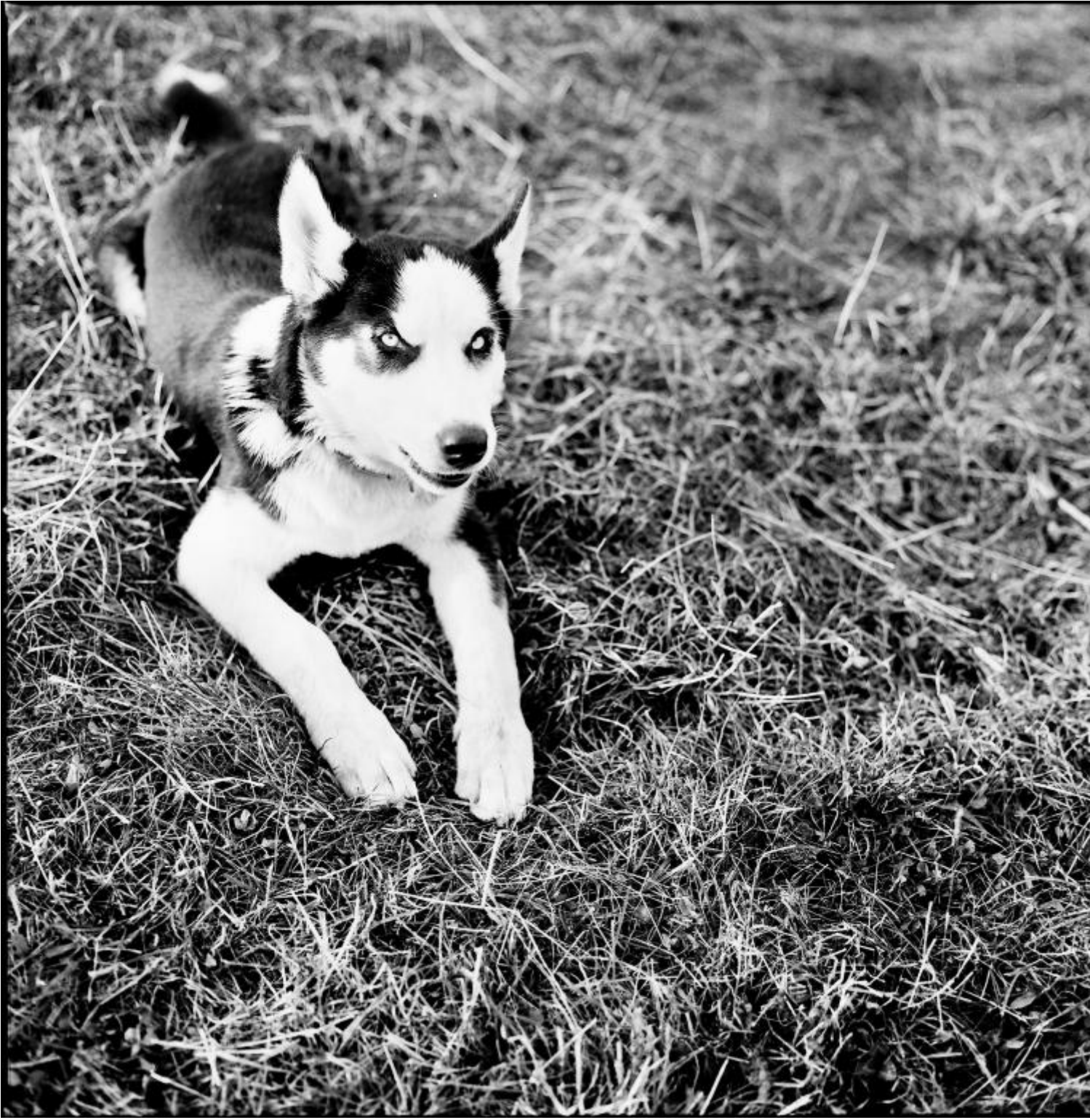
Forca di presta 1993, ph Salvatore Piermarini.