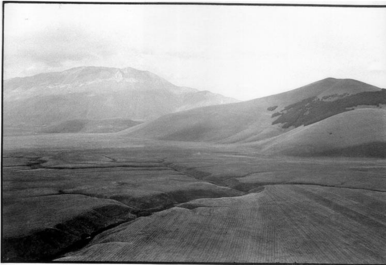
Inghittitoio, fosso del Mergani, Monte Vettore 1988, ph Salvatore Piermarini.

La faglia sismica è partita da qui, intercettata e scovata dai geologi dell'INGV che, a poche ore dalle scosse devastanti del 24 Agosto 2016, si sono incamminati e arrampicati e sono andati a cercarla proprio nel Parco Nazionale dei Monti Sibillini, luogo di natura incontaminata ma di millenaria instabilità.