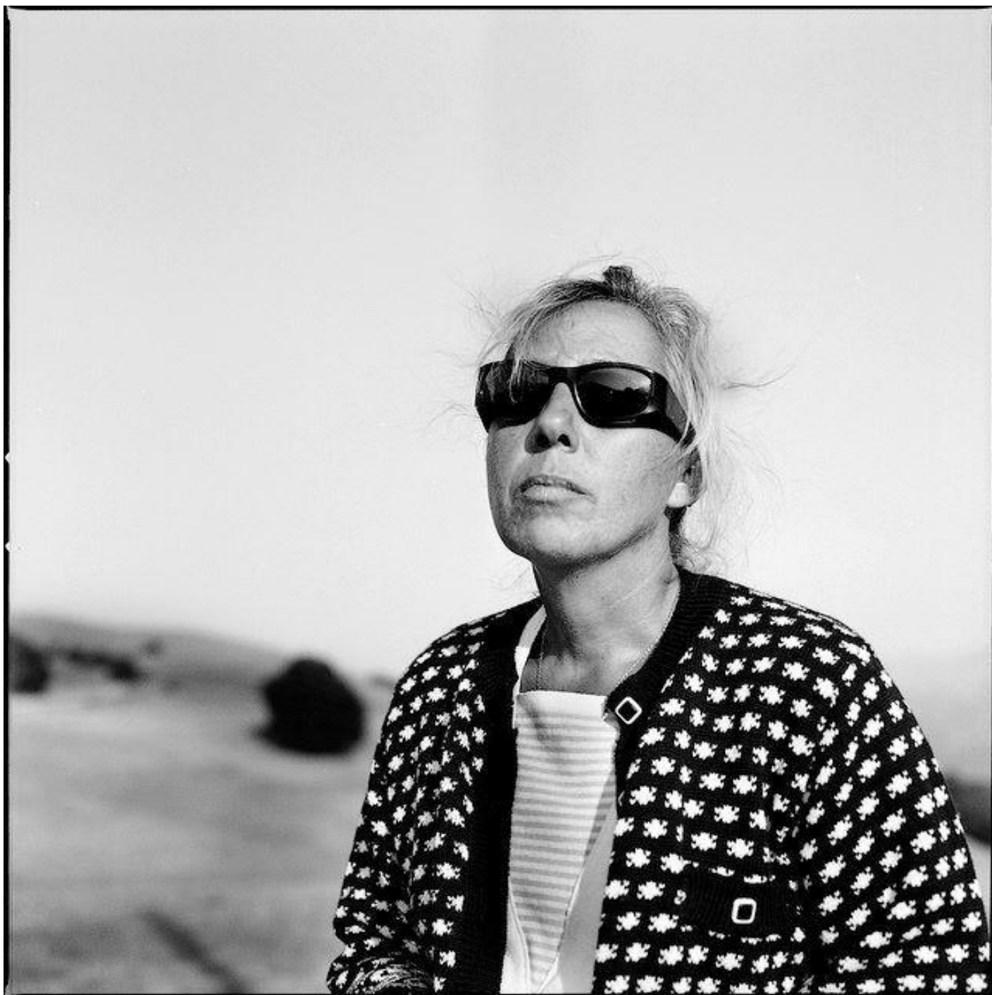
Macchia del cavaliere 1993, ph Salvatore Piermarini.

Il risultato geologico di questo terremoto, documentato e misurato dall'INGV, è che il Monte Vettore è sprofondato di 10 centimetri e che la parete Est del Corno Piccolo del Gran Sasso d'Italia è crollata in un sol colpo.