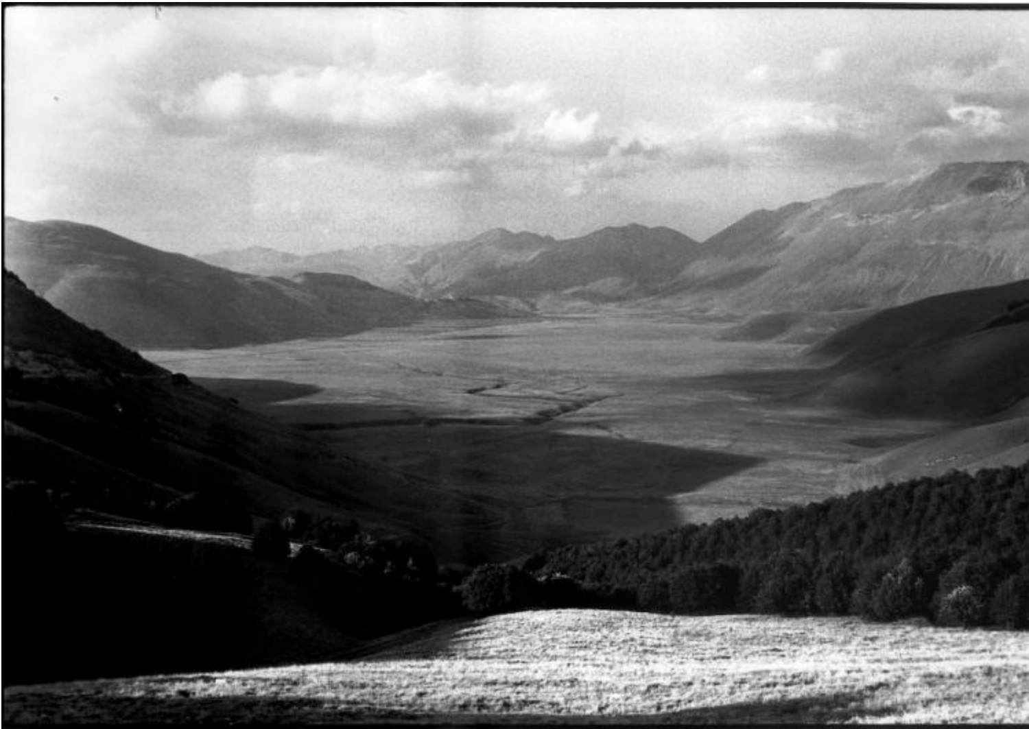
Pian piccolo, Pian grande, Castelluccio di Norcia, Monte Vettore 1988.