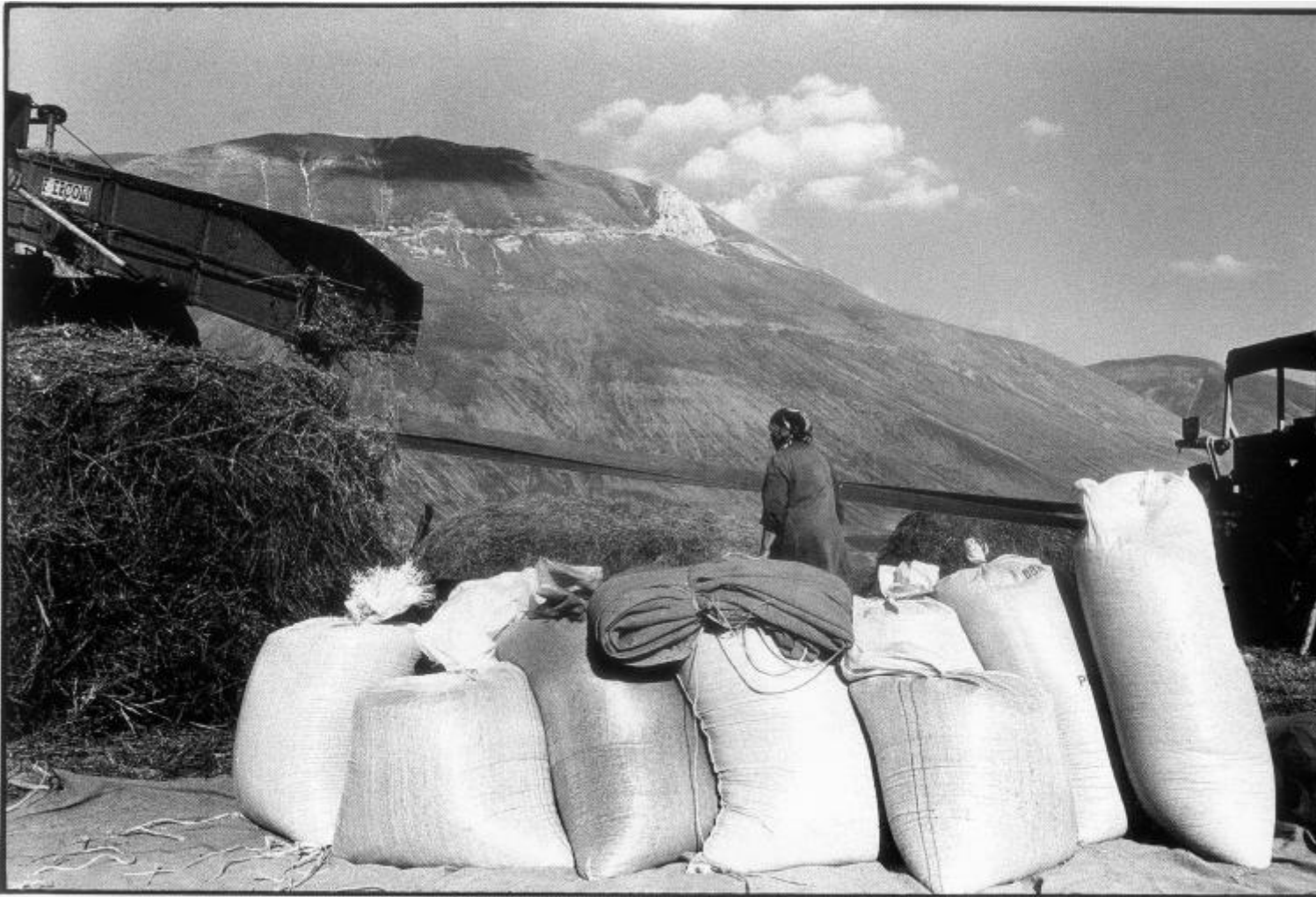
Raccolta delle lenticchie 1988, ph Salvatore Piermarini.