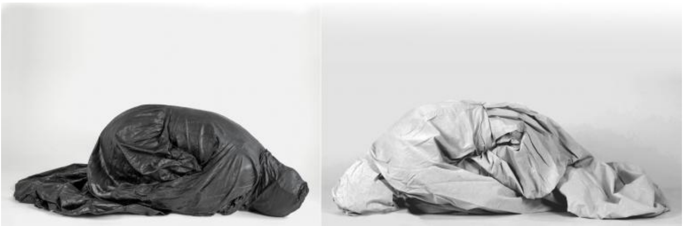
Mwangi Hutter , dark ease ease 2016, courtesy of the artists.

Nel periodo post-storico non ci saranno né arte né filosofia, solo la cura perpetua del museo della storia umana”.