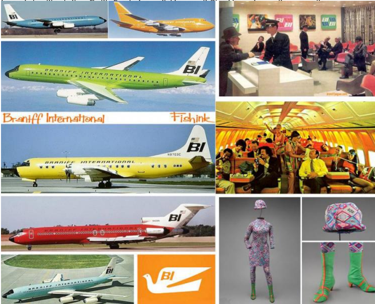
A sinistra: la flotta coloratissima della Braniff International Airways; il famoso logo della colomba; a destra, partendo dall'alto: un check point di terra; la cabina di un aereo; una delle divise delle hostess disegnate da Emilio Pucci.

Il progetto delle uniformi delle hostess, chiamato " The Air-Strip Gemini4 ", fu affidato dalla Jack Tinke al