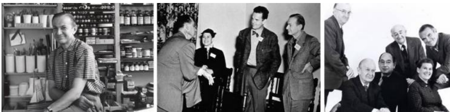
Alexander Girard ritratto nel suo studio agli inizi degli Anni Cinquanta accanto ai suoi barattoli di colore ; George Nelson, Ray e Charles Eams, Alexander Girard; Herman Miller, con Charles e Ray Eames, George Nelson, Alexander Girard e Robert Propst.

Spirito eclettico e poliedrico, anche se poco conosciuto dal grande pubblico, Girard, americano per parte di madre, di padre italo-francese, è stata una delle figure di spicco del design d'oltreoceano del dopoguerra, insieme ai suoi più noti amici e colleghi Charles e Ray Eames, George Nelson ed Eero Saarinen.