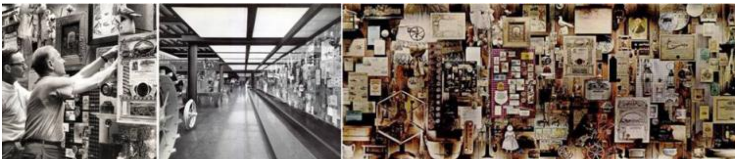
Alexander Girard mentre costruisce il murale tridimensionale alla John Deere a Moline, Illinois, 1964; vista della sala espositiva dei trattori con uno scorcio del murale di Girard; dettaglio del murale.

Guardando il murale tridimensionale che Girard ha eseguito nel 1964 nella sede della John Deere & Co a Moline, in Illinois, come non pensare all'effetto Duchamp sulla cultura artistica americana del dopoguerra e al conseguente Nouveau Réalisme di Robert Rauschenberg?