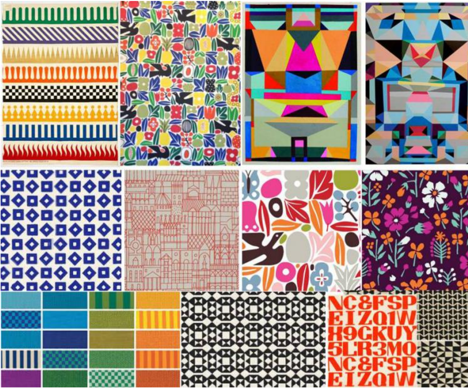
Alcuni degli oltre 300 tessuti in una moltitudine di varianti cromatiche disegnati da Girard per Herman Miller e prodotti da Maharam

Per ottenere i suoi famosi tessuti a mano in 100% cotone, detti "mexidot" e "mexicotton", veri must della Herman Miller, che neppure Maharam riusciva ad ottenere, a un certo punto 'Sandro' arriverà addirittura a rimettere in funzione una filanda del XIX secolo scoperta nel Messico centrale, tanto 'filologico' era il suo rispetto per la tradizione.