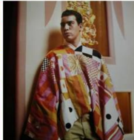
La Fonda del Sol. Le 80 variazioni del logo con il tema del sole; corredi da tavolo geometrizzanti; un posacenere; il menu; la divisa dei camerieri.

Per la progettazione dei mobili de La Fonda del Sol si era avvalso della collaborazione dei suoi amici 'storici', Charles e Ray Eames, già autori di pezzi di design di grande successo, cui aveva chiesto di creare una sedia con uno schienale più basso del tavolo in modo da consentire una visuale ininterrotta dell'insieme del locale da qualunque punto lo si osservasse. È così che è nata la famosa sedia che porta lo stesso nome del ristorante. A stampo in vetroresina, con la seduta imbottita, rivestita poi dal Girard con i tessuti su suo disegno, dai colori sgargianti e dai motivi più inconsueti, è stata prodotta dal colosso americano Herman Miller e ha avuto un tale successo da diventare un'icona del design, largamente imitata, di cui sono stati venduti centinaia di migliaia di esemplari.