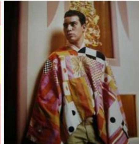
La Fonda del Sol. Le 80 variazioni del logo con il tema del sole; corredi da tavolo geometrizzanti; un posacenere; il menu; la divisa dei camerieri.

Per la progettazione dei mobili de La Fonda del Sol si era avvalso della collaborazione dei suoi amici 'storici', Charles e Ray Eames, già autori di pezzi di design di grande successo, cui aveva chiesto di creare una sedia con uno schienale più basso del tavolo in modo da consentire una visuale ininterrotta dell'insieme del locale da qualunque punto lo si osservasse. È così che è nata la famosa sedia che porta lo stesso nome del ristorante. A stampo in vetroresina, con la seduta imbottita, rivestita poi dal Girard con i tessuti su suo disegno, dai colori sgargianti e dai motivi più inconsueti, è stata prodotta dal colosso americano Herman Miller e ha avuto un tale successo da diventare un'icona del design, largamente imitata, di cui sono stati venduti centinaia di migliaia di esemplari.