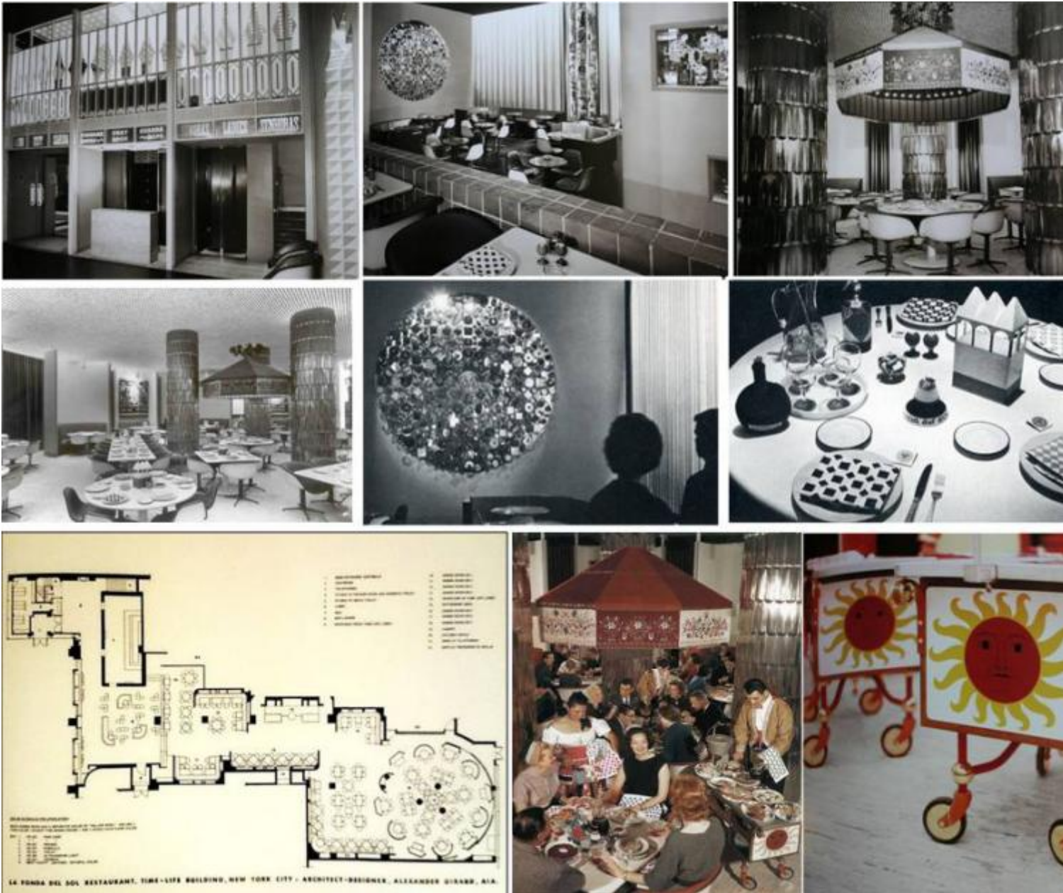
La Fonda del Sol. Nelle foto in bianco e nero: alcune vedute degli interni del ristorante newyorkese progettato da Alexander Girard nel 1960 nella hall del Time & Life Building, con mobili di Charles e Ray Eames. In basso: planimetria; veduta dell'interno e dettaglio dei carrelli portavivande.

caldi, il Girard lo ha coniugato spesso a motivi geometrici stile Optical Art, senza rinunciare a un linearismo fumettistico molto prossimo a quello della Pop Art, mostrando di padroneggiare appieno i codici delle tendenze artistiche in auge nell'America del suo tempo ma anche di anticipare il linguaggio postmoderno in quel mix di purismo e di decorativismo che, uniti a un'esuberante tavolozza cromatica, gli erano propri.