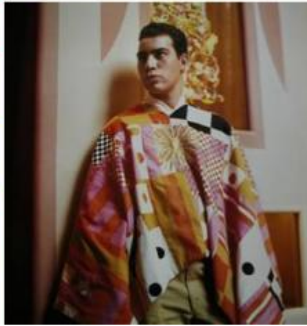
La Fonda del Sol. Le 80 variazioni del logo con il tema del sole; corredi da tavolo geometrizzanti; un posacenere; il menu; la divisa dei camerieri.

Per la progettazione dei mobili de La Fonda del Sol si era avvalso della collaborazione dei suoi amici 'storici', Charles e Ray Eames, già autori di pezzi di design di grande successo, cui aveva chiesto di creare una sedia con uno schienale più basso del tavolo in modo da consentire una visuale ininterrotta dell'insieme del locale da qualunque punto lo si osservasse. È così che è nata la famosa sedia che porta lo stesso nome del ristorante. A stampo in vetroresina, con la seduta imbottita, rivestita poi dal Girard con i tessuti su suo disegno, dai colori sgargianti e dai motivi più inconsueti, è stata prodotta dal colosso americano Herman Miller e ha avuto un tale successo da diventare un'icona del design, largamente imitata, di cui sono stati venduti centinaia di migliaia di esemplari.