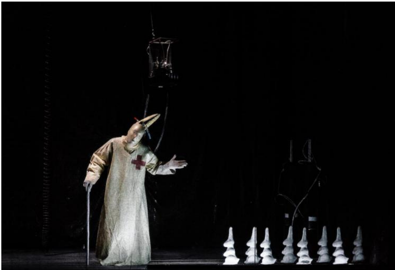
Corifeo e coro, ph Guido Mencari, Parigi, 2015.