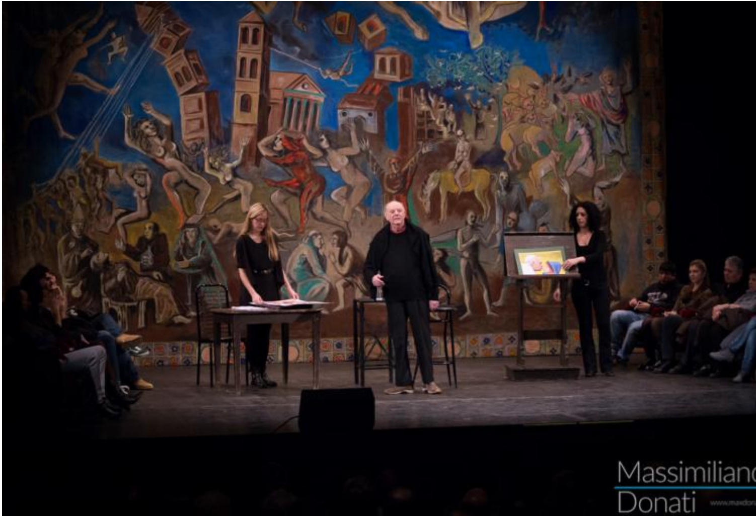
Santo Jullare (Teatro Duse)

Se n’è andato lottando, lavorando fino all’ultimo minuto, guardando, dai suoi 90 anni, avanti.