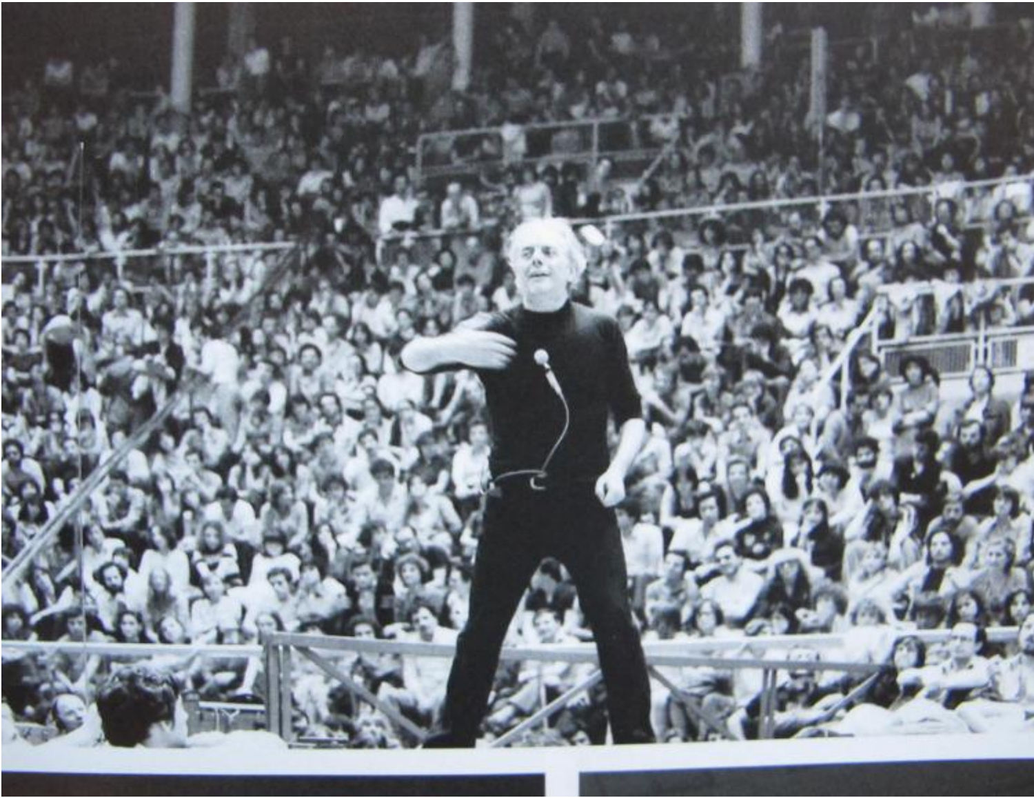
Mistero Buffo (Bologna, 1977)