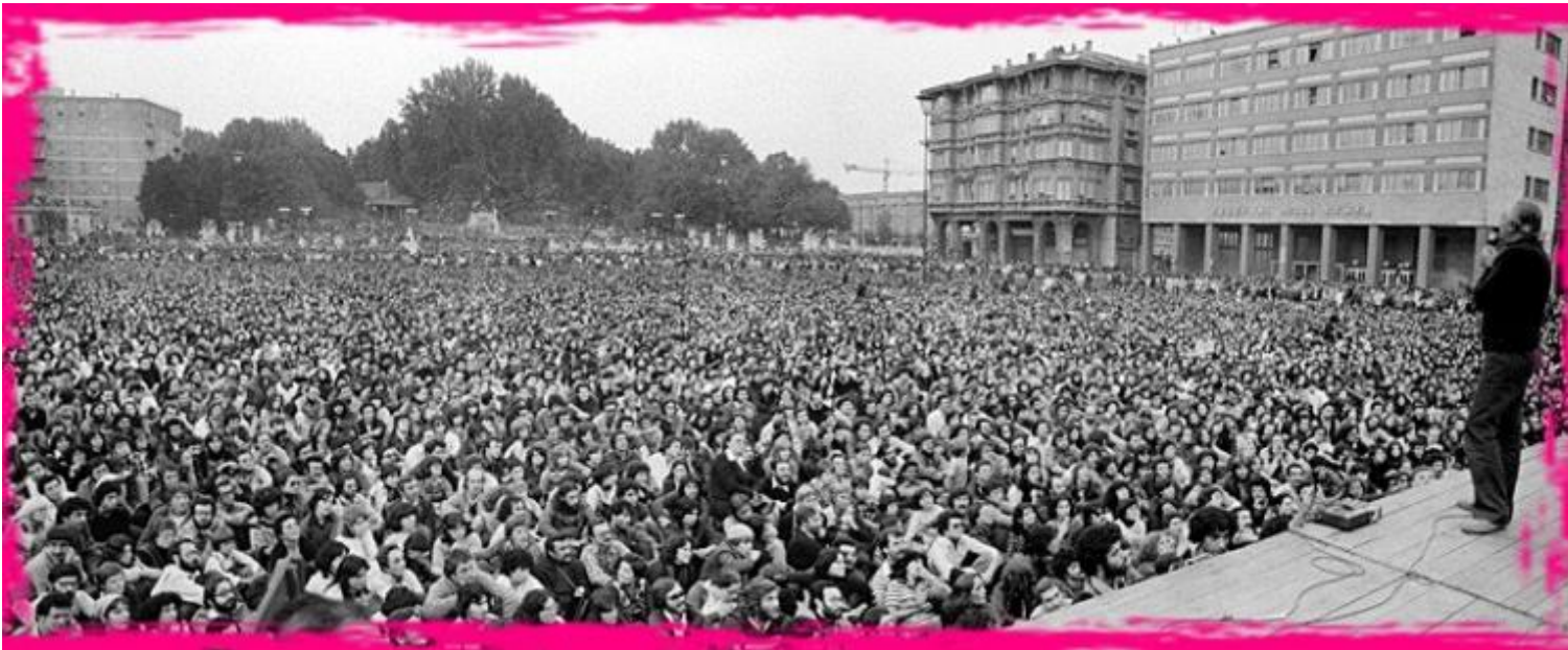
Bologna, settembre 1977

Qualcuno parlava di cerimonie liturgiche, riservate a quelli che già erano convinti e lo vedevano come officiante di un rito politico. Ma poi Dario Fo, dopo l'interdetto seguito a una famosa Canzonissima dei primi anni '60 in cui aveva osato parlare di morti sul lavoro (era una trasmissione d'intrattenimento del sabato sera nell'Italia democristiana!), nel 1977 era tornato in televisione, con i suoi testi, e in tanti lo avevano seguito, non solo della sua parte politica. E si era avvicinato per uno spettacolo a un altro attore di razza come Albertazzi, dal punto di vista ideologico su altri fronti, uniti dall'arte della recitazione, del trasformare la realtà in un concentrato di due ore in cui si va più dentro o più oltre le apparenze.