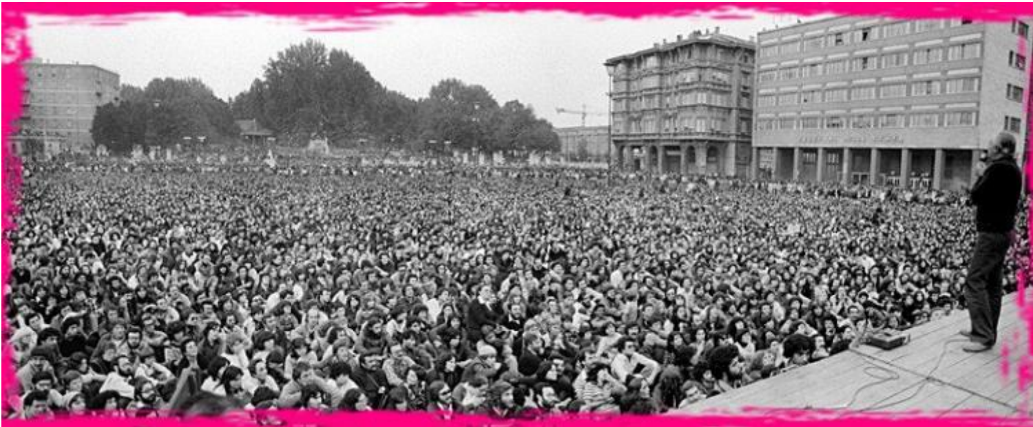
Bologna, settembre 1977

Qualcuno parlava di cerimonie liturgiche, riservate a quelli che già erano convinti e lo vedevano come officiante di un rito politico. Ma poi Dario Fo, dopo l'interdetto seguito a una famosa Canzonissima dei primi anni '60 in cui aveva osato parlare di morti sul lavoro (era una trasmissione d'intrattenimento del sabato sera nell'Italia democristiana!), nel 1977 era tornato in televisione, con i suoi testi, e in tanti lo avevano seguito, non solo della sua parte politica. E si era avvicinato per uno spettacolo a un altro attore di razza come Albertazzi, dal punto di vista ideologico su altri fronti, uniti dall'arte della recitazione, del trasformare la realtà in un concentrato di due ore in cui si va più dentro o più oltre le apparenze.