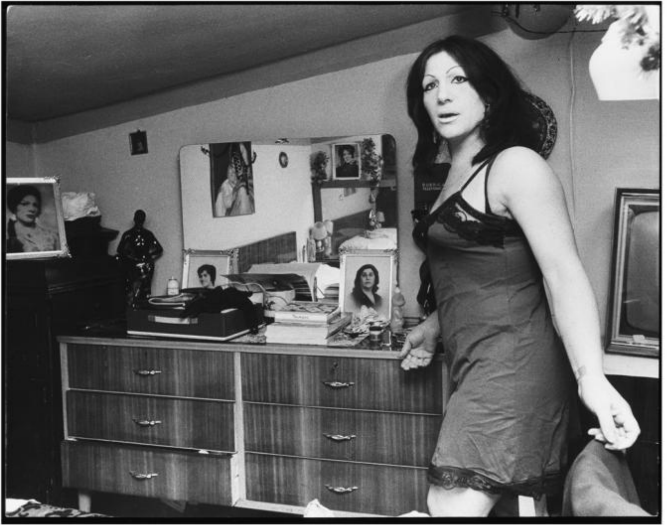
Dalla serie I Travestiti, La Morena, 1965 Stampa vintage fotografica in bianco e nero, 23 x 29 cm