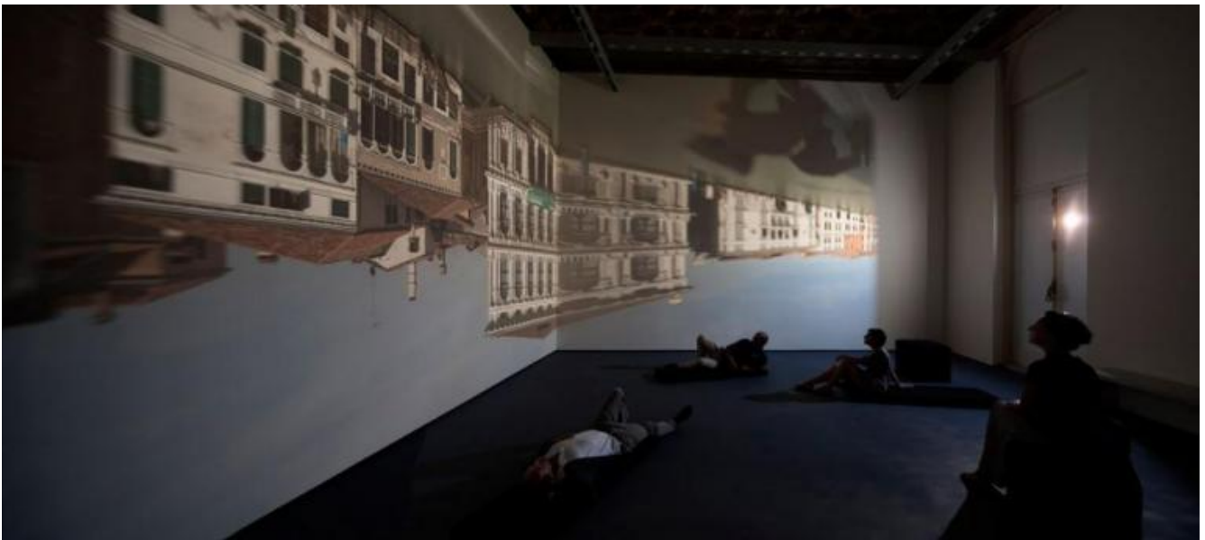
Zoe Leonard, Campo San Samuele.

identica ma con un capovolgimento. Molte volte c'è bisogno di un altro spazio e di un'altra dimensione per vedere ulteriormente o per guardare con più attenzione ciò che scorre davanti agli occhi normalmente ogni giorno. Camera oscura come luogo per far convergere meglio l'attenzione sui dettagli del mondo, quindi. Ogni fruitore sta dentro lo spazio scuro per cogliere con più nitidezza ciò che gli sta attorno. In questa sostanza allegorica il fruitore percepisce di essere una sorta di presente continuo nel tempo. Inoltre questa camera oscura materializza una considerazione su cosa significhi riprodurre immagini. Esempio è l'esperienza Campo San Samuele 3231 , realizzata da Zoe Leonard nel 2012 a Venezia, nel Palazzo Grassi.