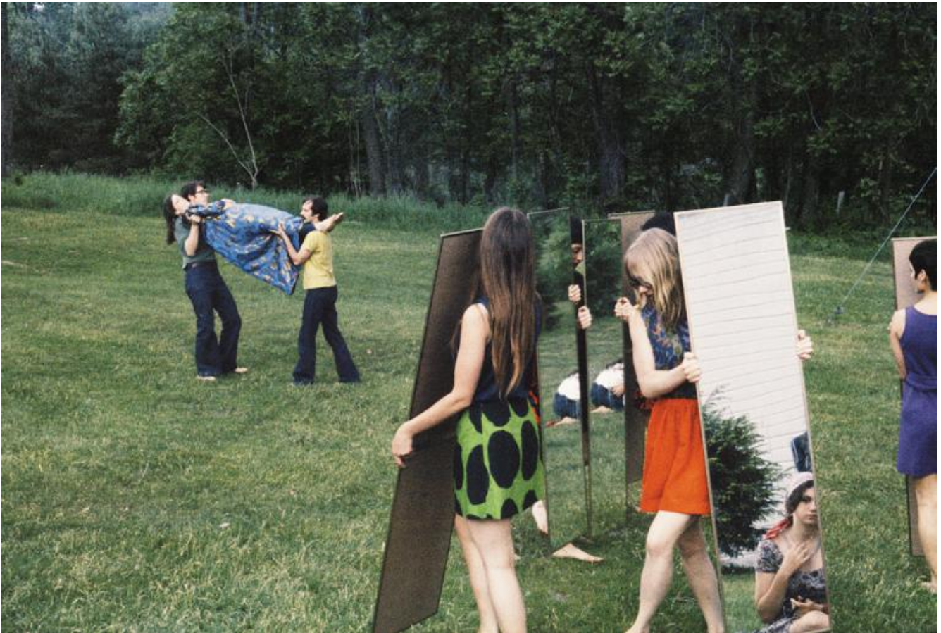
Joan Jonas, performance, 1969.

Fontanellato, costruita per l'osservazione agevolata del paesaggio esterno assoluto. Il principio è identico a quello delle macchine fotografiche reflex, che hanno un sistema in grado di proiettare l'immagine dall'obiettivo verso un vetro interno. Già un semplice specchio concavo, comunque, può proiettare un'immagine su una superficie piana.