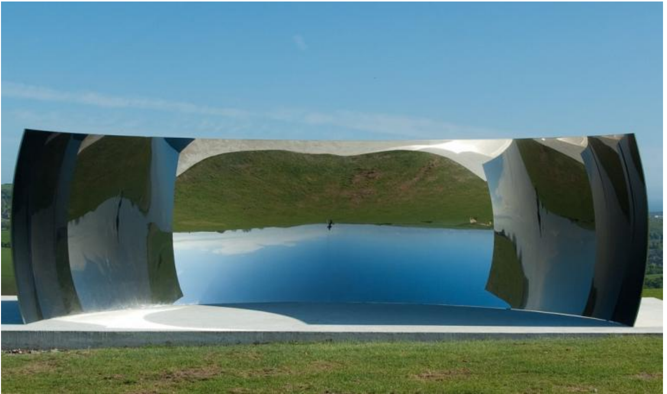
Anish Kapoor, C-curve, 2007, courtesy of the artist and lisson gallery London.

Per non essere impietrito da Medusa, Perseo guarda e si muove con l'ausilio di uno specchio magico, ricevuto in dono da Pallade Athena, la dea greca della sapienza. Proviamo a procedere con una speculazione simile a quella raccontata dal mito, ma concava.