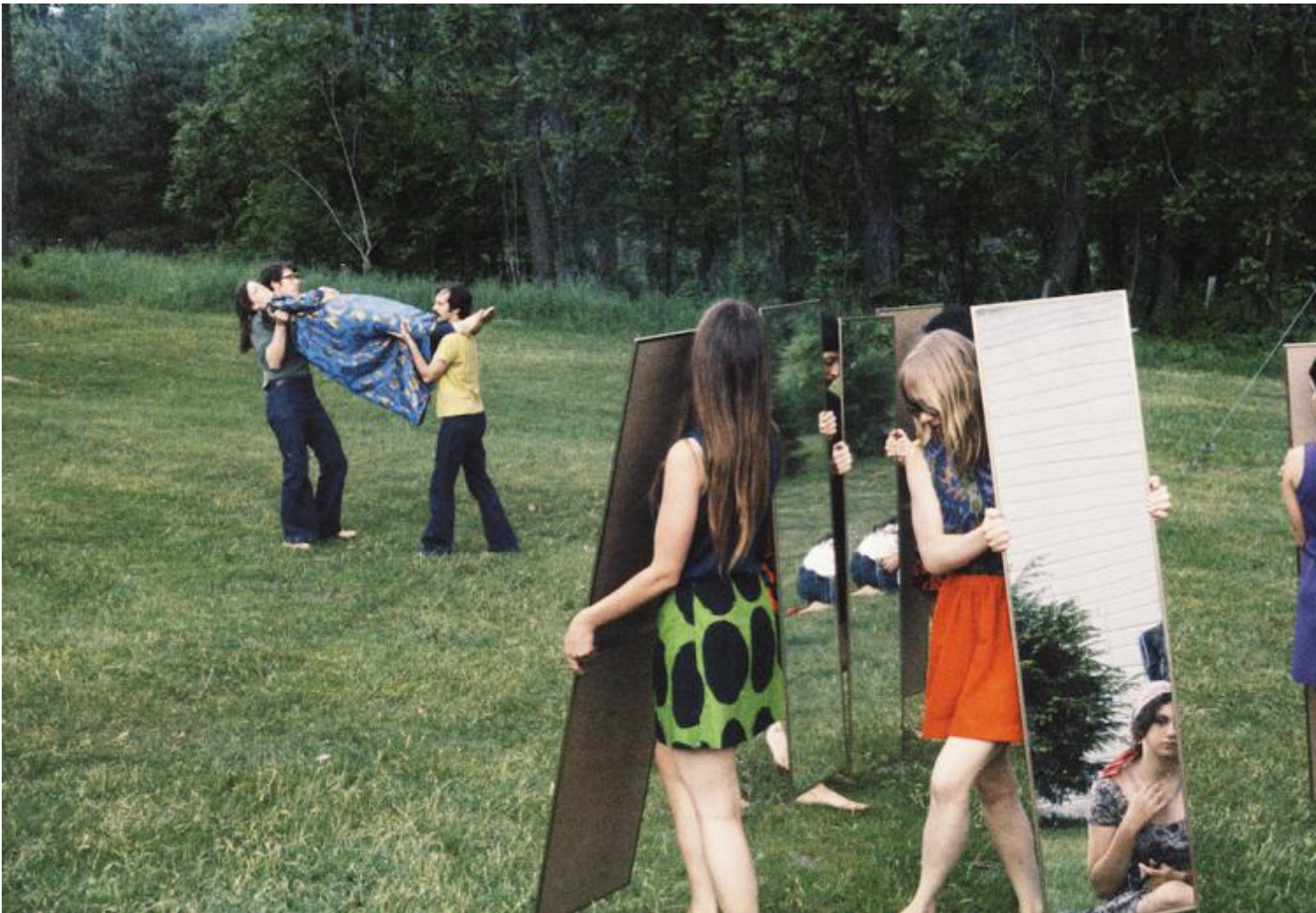
Joan Jonas, performance, 1969.

fotografiche reflex, che hanno un sistema in grado di proiettare l'immagine dall'obiettivo verso un vetro interno. Già un semplice specchio concavo, comunque, può proiettare un'immagine su una superficie piana.