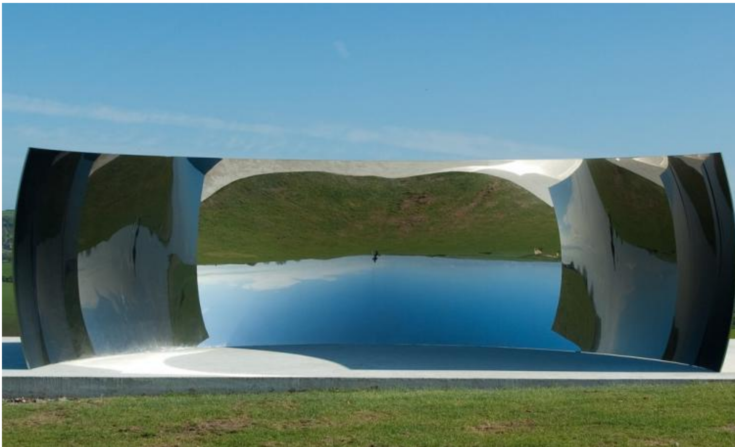
Anish Kapoor, C-curve, 2007, courtesy of the artist and lisson gallery London.

Nella tradizione iconologica lo specchio è inteso come un'immagine ambivalente, che, a seconda del contesto in cui è inserita, rimanda a molteplici significati, anche opposti fra loro. Come simbolo positivo allude alla conoscenza interiore, riflessiva, iniziatica, e se impugnato dalla Prudenza è inteso come strumento necessario per vedere cosa accade alle spalle. Con accezioni negative è invece associato a Narciso, a chi si rimira compiaciuto di se stesso, all'idea della vanità, ai peccati di lussuria e superbia, e alla bellezza, con rimandi all'approssimarsi dell'invecchiamento e alla morte. Ma ne' Lo specchio concavo interessa indagare la portata evocativa di un altro specchio, quello che ribalta la figura di chi cerca una speculazione nella superficie riflettente, nella concavità che mostra l'immagine capovolta della realtà, dove sia l'io interiore nascosto sia le immagini del mondo entrano capovolte nella retina dello sguardo, e qui subiscono un'elaborazione, una transmutatio o un'assimilazione.