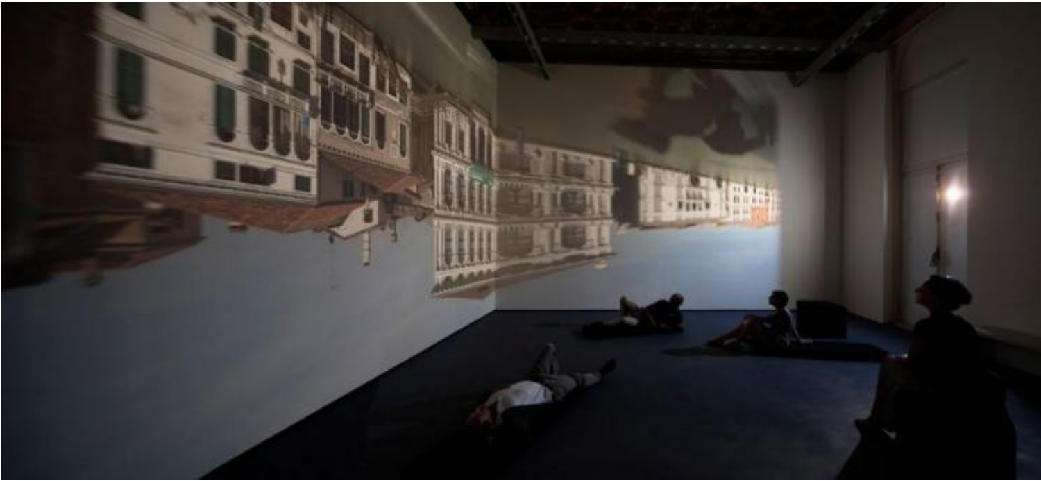
Zoe Leonard, Campo San Samuele.

Dopo un lavoro trentennale con il medium della fotografia, l'artista americana ha messo in scena, nella sua opera-camera oscura, immagini non registrate, non analogiche né digitali, ma semplicemente solo luce che penetra attraverso un buco nella finestra e respira e vive (capovolta) su una superficie piana. In questo passo indietro rispetto ai mezzi della fotografia e dei video, e in questo arretrare rispetto a tutte le sofisticate e artefatte riflessioni dell'arte contemporanea, Zoe Leonard ottiene il modo più diretto e semplice per contemplare ciò che si vede, osservando come agiscono il nostro cervello e il nostro sguardo. In questo arretramento verso le origini si innesca un ulteriore tentativo di capire come la persona pensa alla sua vita quotidiana quando si trova in uno spazio del presente.