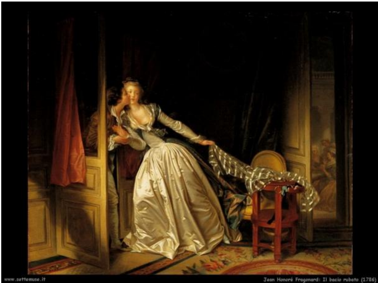
Figure spettrali? Basta un attimo per dileguarle. Specie di cose che, giusto per pochi secondi, perturbano la vita di chi le osserva. La ragazza de L'altalena (Fragonard) che oscilla come un metronomo, o una figura femminile incrociata magari sotto un portico, giusto il tempo necessario per ammirare il suo sorriso. Gli si potrebbe indirizzare una lettera, mentre Olympia di Manet, nel suo biancore, osserva incuriosita. Le immagini sono mobili, a volte dialogano con chi scrive: si prendono una vacanza dalla loro fissità, mosse dalla scrittura.

E quelle figure, i pittori che le hanno dipinte, posso dirvi qualcosa della nostra vita. Watteau e Fragonard avranno vissuto in mansarde, come Walser? E La radura di Virgile-Narcyse Díaz de la Peña? Per Walser è una "foresta". "La madre era andata via. Il bambino era lì da solo. Davanti gli stava il compito di trovare la strada nel mondo, che è anch'esso una foresta, d'imparare ad avere di sé scarsa opinione e bandire, al fine di piacere, il compiacimento di se stesso" (p. 61). Questa pagina è un autoritratto.