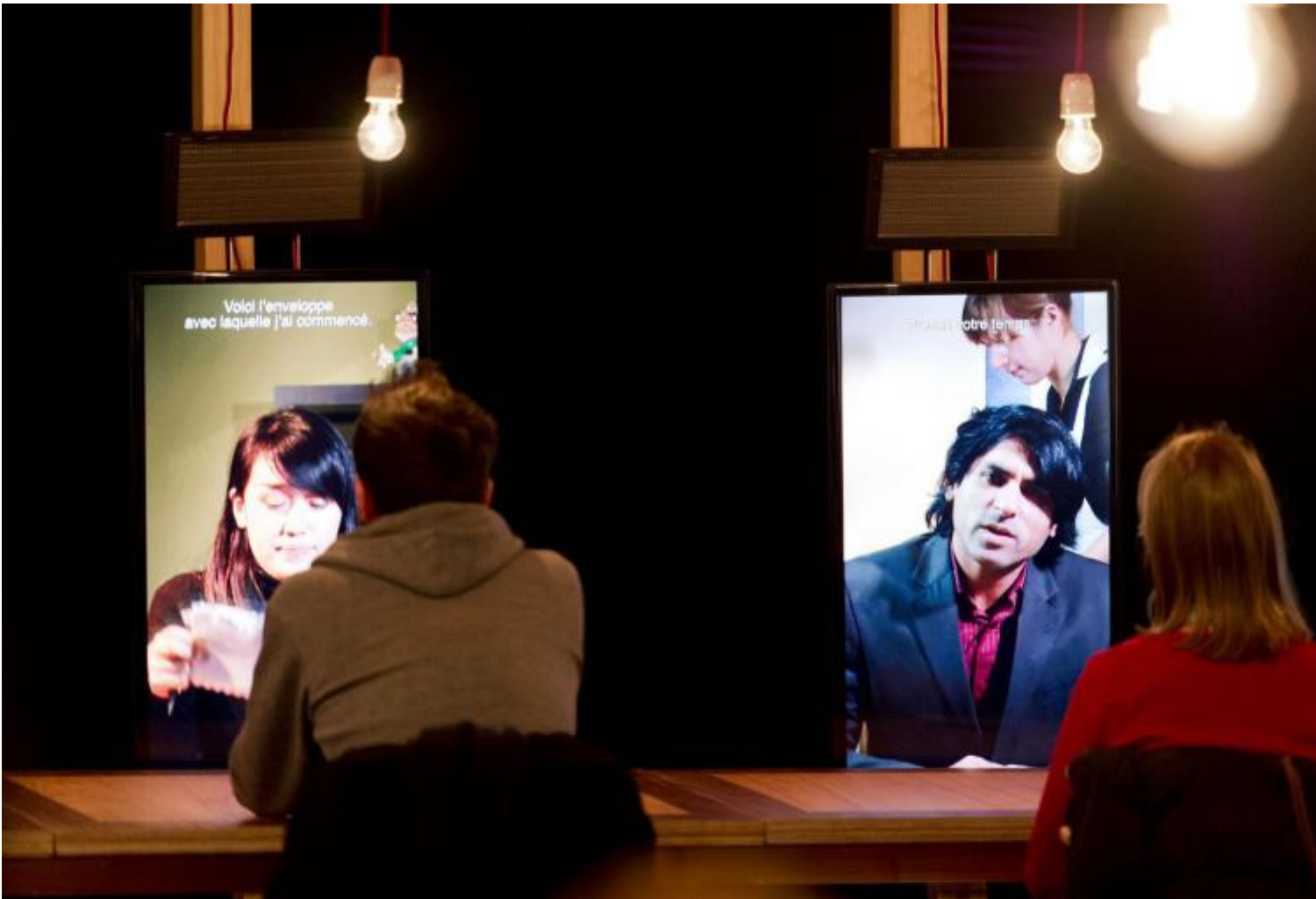
Perhaps all the dragons.

testi e situazioni sceniche, affrontati senza reverenze. È una strada con un bel respiro progettuale, in un momento in cui molti teatri si sono affrettati a creare, per rispondere ai requisiti della nuova legge, scuole con poca anima, che duplicano di fatto istituti già esistenti, in un settore in cui la disoccupazione, la sottoccupazione, la mancanza di orizzonti è la regola.