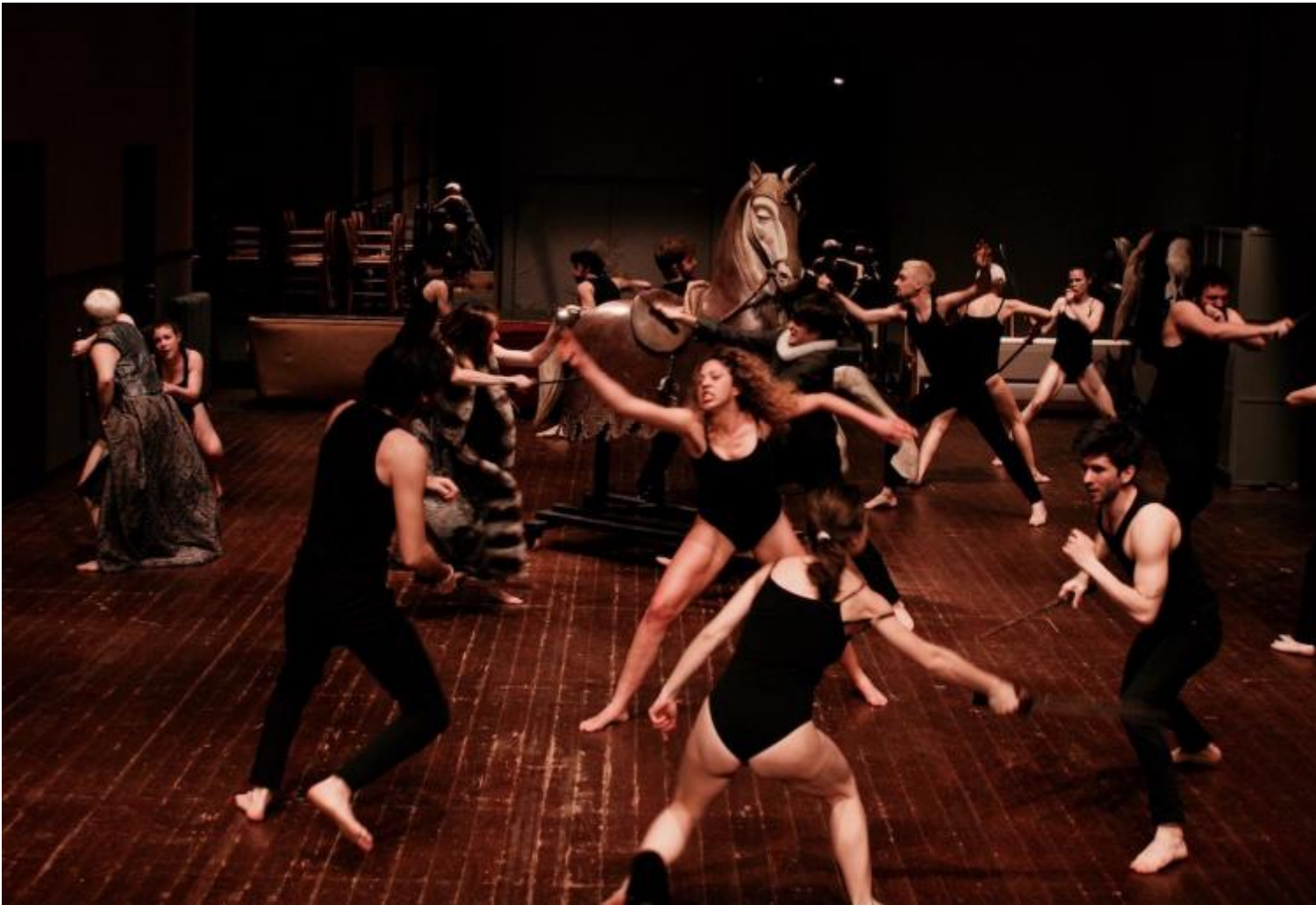
Santa estasi elena