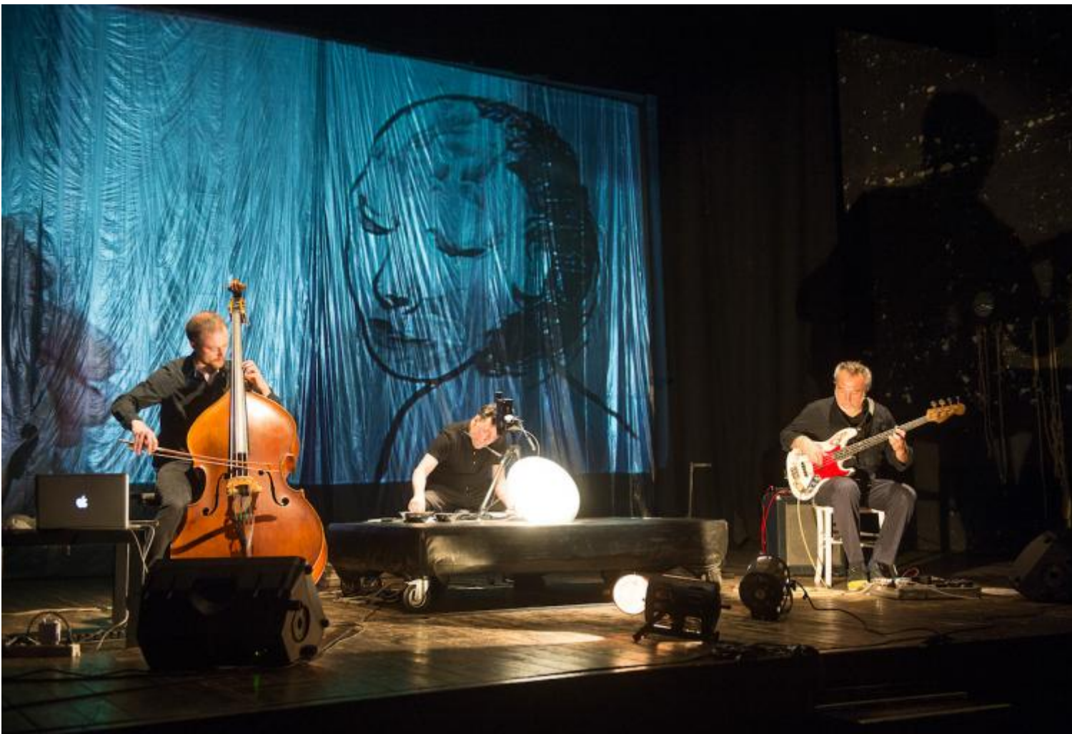
Piugiu, Stefano Ricci prove, ph Acrolando Paolo Guerzoni.

Così come finiva molto nel didattico con la ricostruzione di vari anni di lavoro con i ragazzi disadattati, prima figli di operai e altri emarginati delle periferie, poi migranti, The Misfits del Backa Theatre di Göteborg (Svezia). Un lavoro politico vecchio, un brechtismo di maniera, semplicatorio ancora una volta, che immaginiamo abbia un senso nelle situazioni di intervento, ma che a noi risulta solo, in modo esasperante, testimoniare la buona volontà di impegno sociale di chi lo svolge, con mezzi più agitatori e alleviatori di cattive coscienze che efficaci.