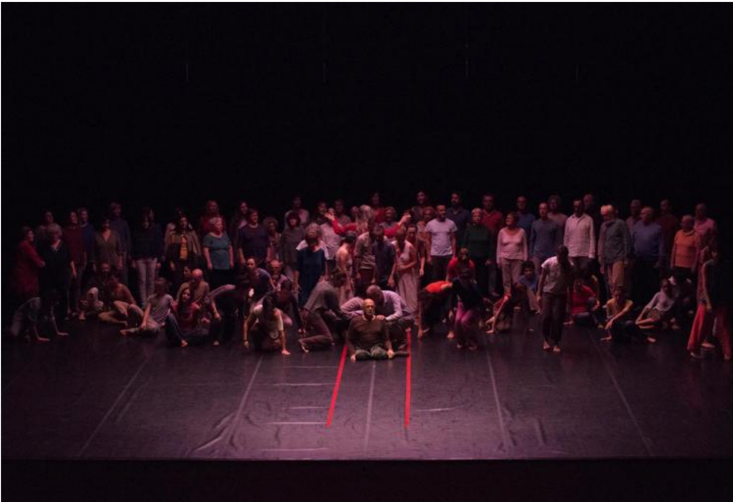
Ballo 1890 natura morta.

Nello spettacolo siamo davanti a una massa che si muove su uno sfondo di suoni pulviscolari, con il muro compatto della Corale, ogni tanto riassorbito dai danzatori o pronto a incorporarli in sé. Una figura si trascina su gambe inerti, un'altra di una ragazza sottile e malferma rimane isolata, il gruppo rientra, riprende, incamera, svela un dondolare di due linee di danzatori seduti al centro che si tengono in reciproco equilibrio per le braccia, mentre la massa si chiude su di loro, poi si riapre, mette in evidenza un'anziana signora come dispersa, poi ancora l'uomo dalle gambe inerti, crea un gruppo a destra, a sinistra, poi assorbe la Corale, poi la Corale si sposta a destra, a sinistra, riemerge dalla massa, lasciando un gruppo di figure a terra che si distendono, e si rialzano, e tornano mucchio, in movimenti che si ripetono e riempiono lo spazio come il pulviscolo della luce che avvolge le opere di Morandi, i suoi oggetti, e che li staglia su quegli sfondi inerti.