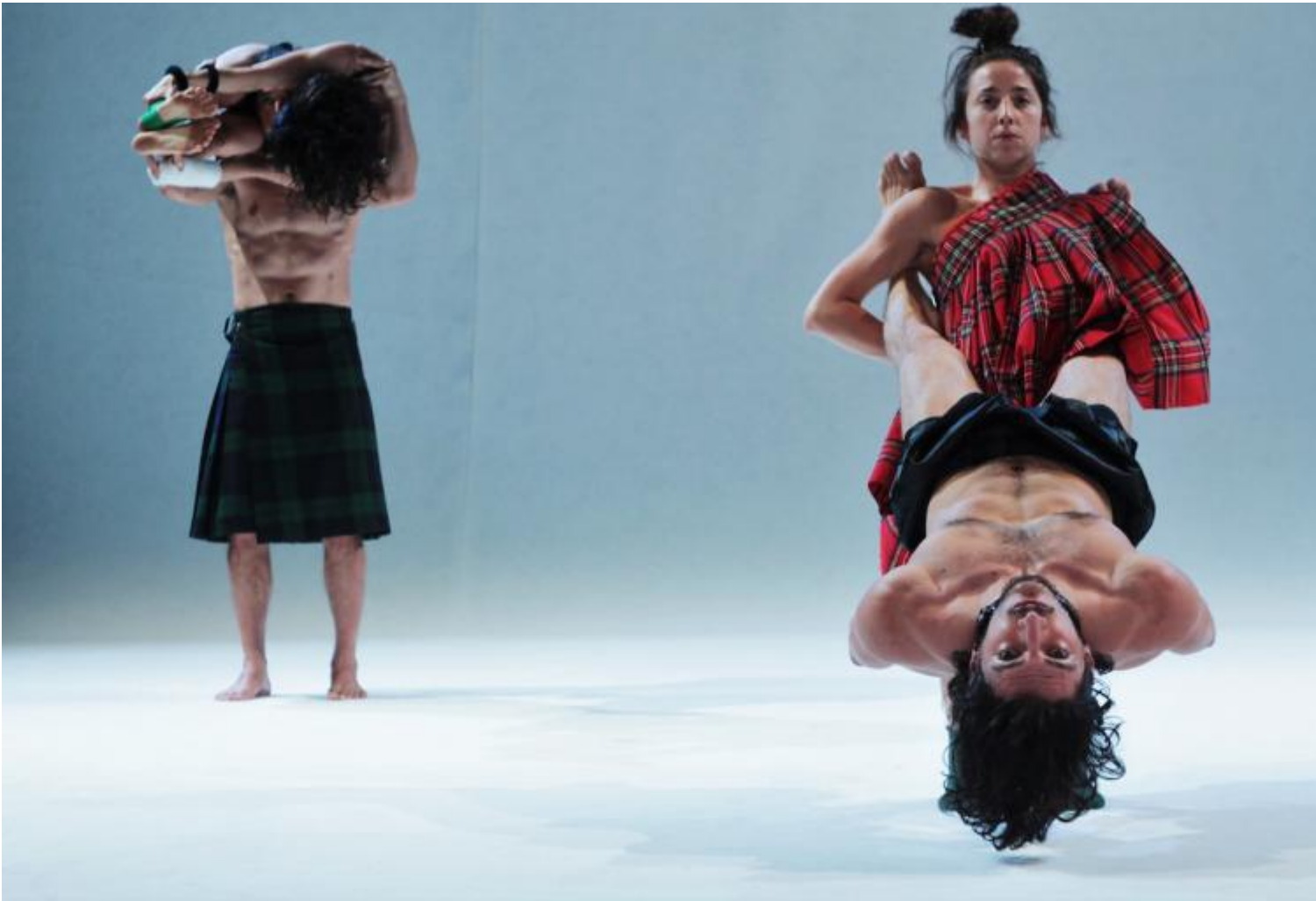
Sylphidarium, ph Camilla Caselli.

Un altro remake (autoremake, in questo caso) è quello di Splendid's di Motus, poiché la compagnia ritorna al testo di Genet quattordici anni dopo la prima versione. Come in quella, con l'attuale Raffiche .