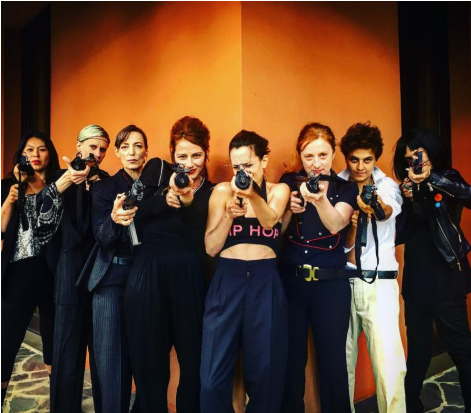
Raffiche motus, ph Endna.

moda, individuando, per ogni stagione, un tema da declinare in forme e formati glamour, intercettando un qualche “spirito dei tempi” in una bidimensionalità priva di profondità che corre omologa alla società dell’assenza, della trasparenza, del vuoto, dell’estraneità ( Hello Stranger ).