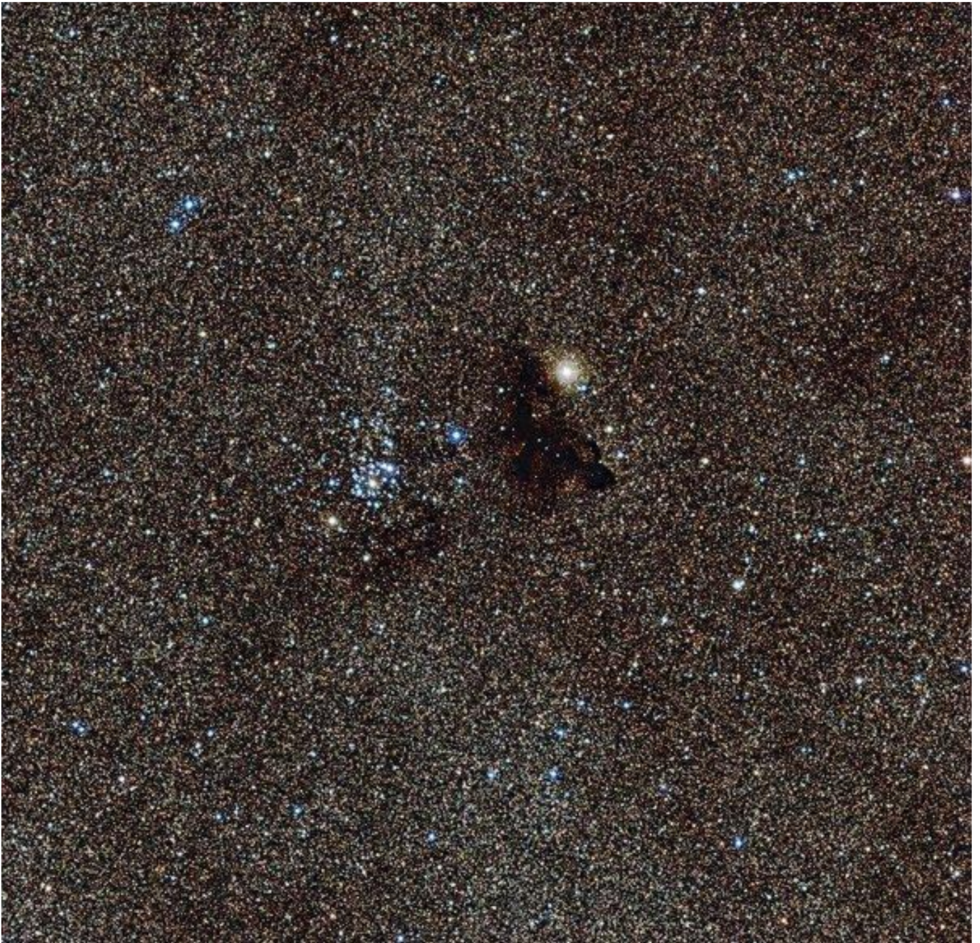
Starry night chile.

Lo stesso Darwin era consapevole che le difficoltà di far comprendere le sue scoperte, in contrasto con il senso comune e controintuitive, fossero legate soprattutto al fatto che le teorie creazioniste, così come i miti , sono più semplici, appaganti e in definitiva facili da credere. In questo senso la teoria darwiniana della selezione naturale, compie uno scatto rispetto all'alternativa secca tra il caso e l'intelligenza: con la sua intrinseca legalità, essa rende superflua l'idea di una intelligenza progettuale preposta al perseguimento degli scopi negli organismi. Tale idea non è più necessaria per lo svolgimento di una funzione, che può venire così in modo autonomo e autofondante.