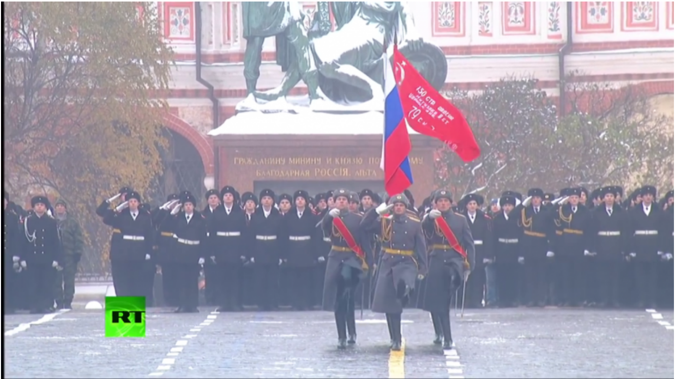
Bandiera russa e vessillo della vittoria.

L'accento della manifestazione si focalizza subito, grazie ai commenti dei due speaker, sul concetto chiave: "l'intero paese guarda a Mosca e difende Mosca. I veterani, che avevano preso parte alla "leggendaria parata del 1941", devono sapere che il Paese non dimentica il loro eroismo e continua ad andarne fiero.