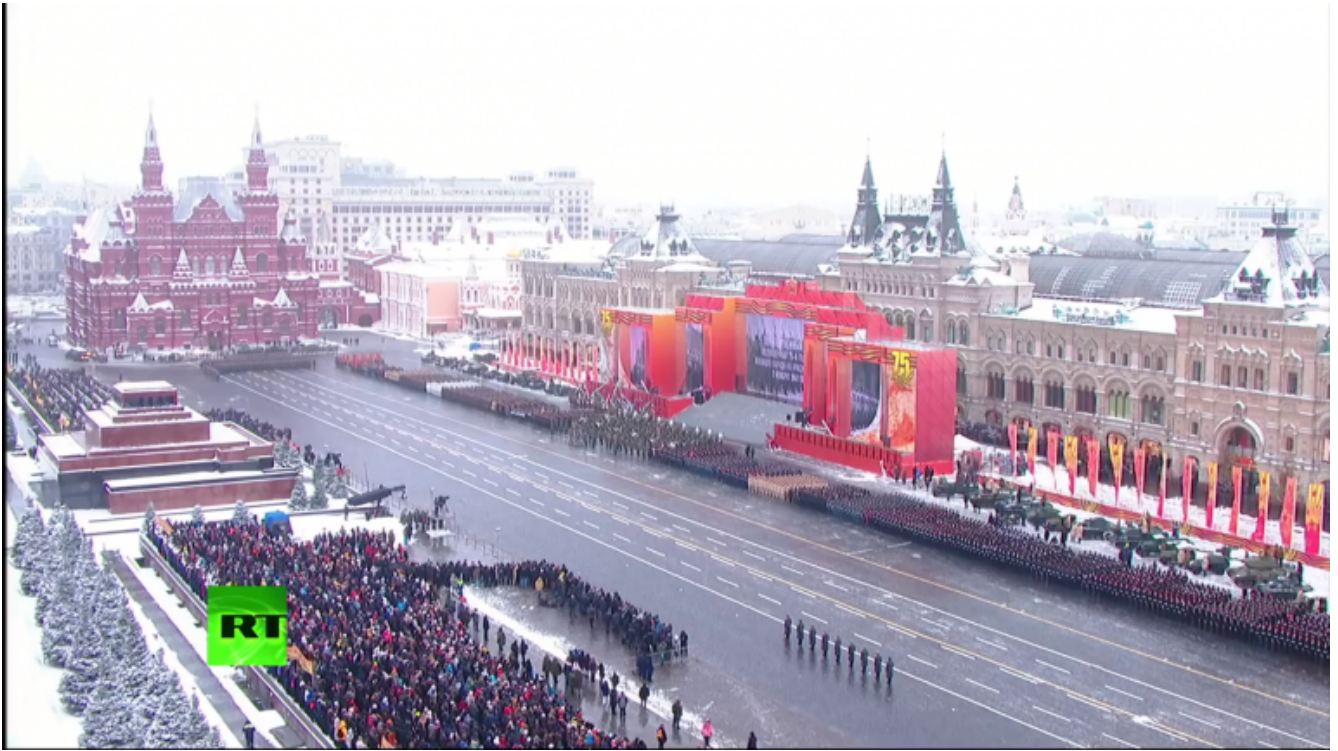
Scenografia della manifestazione.

L'intervento militare simulato evoca la difesa di Mosca e si sviluppa con roboante retorica e non senza un'ingenuità che non può non ricordare certo cinema real-socialista.