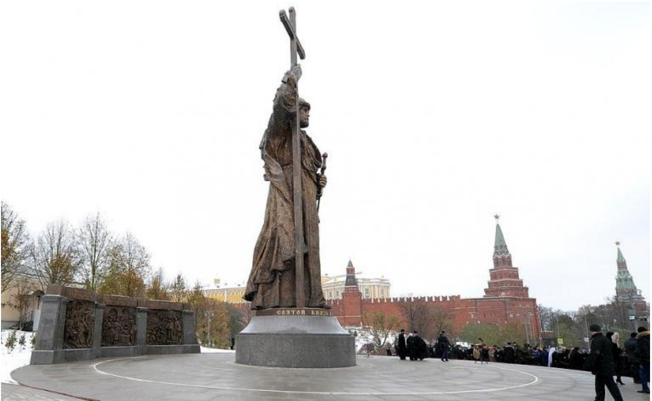
Monumento a san Vladimir, Mosca.

Il principe moscovita Ivan IV si era autoproclamato zar di tutta la Russia, unificando sotto la propria egida i vari principati e contrastando il potere feudale dei boiari, venendo riconosciuto nel 1561 dal patriarca di Costantinopoli e facendo nascere il mito di Mosca terza Roma. Per sostenere le riforme e contrastare gli oppositori aveva costituito una guardia speciale, crudele e violenta, gli opričniki . Il film di Sergej Ejzenštejn Ivan il terribile (parte I e II) costituisce un'interessante lettura di questa storia, realizzata negli anni della Seconda Guerra Mondiale "per Stalin" che amava identificarsi con il suo illustre predecessore, e che mette in scena aspetti diversi del carattere del sovrano. Dalla volontà di unificare il Paese e gestirlo con mano forte e severa (dettagli che avrebbero fatto meritare al regista il premio Stalin per la prima puntata del film), ai dubbi sempre crescenti e alla solitudine quasi disperata che lo opprimeva e deprimeva nella seconda parte (che avrebbe, per queste ragioni, visto la luce soltanto nel 1958, molti anni dopo la morte del regista).