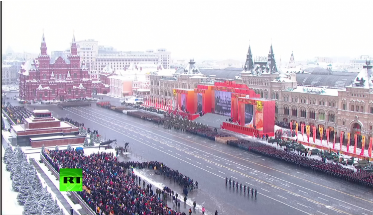
Scenografia della manifestazione.

L'intervento militare simulato evoca la difesa di Mosca e si sviluppa con roboante retorica e non senza un'ingenuità che non può non ricordare certo cinema real-socialista.