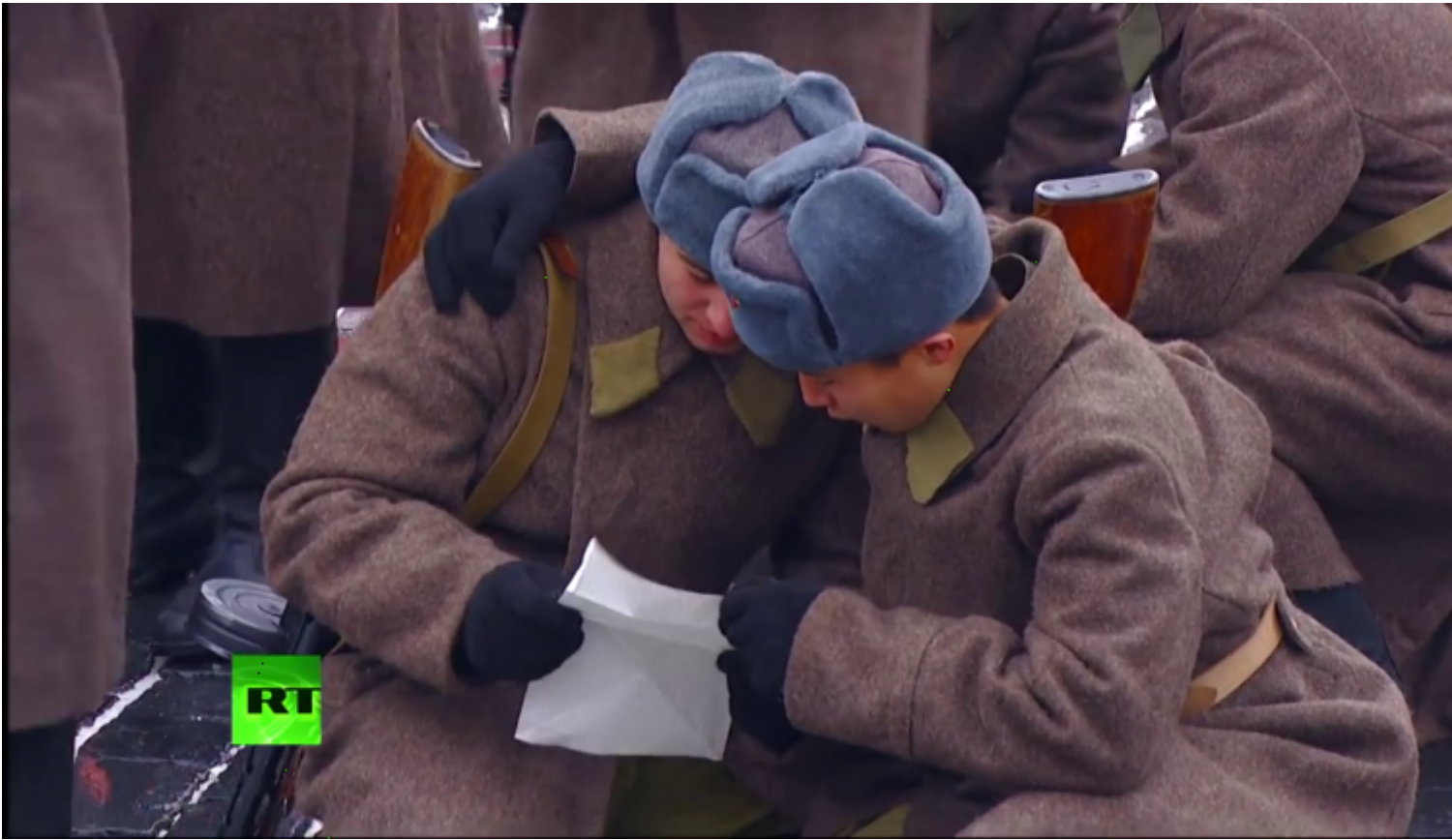
Figuranti che leggono lettere al fronte.

Ai suonatori si aggiunge una prima bionda fanciulla, autentica ruskaja krasavitsa (bellezza russa), drappeggiata in un grande scialle a fiori, altro tocco di stile nazionale, che, sullo sfondo delle immagini di Lidija Ruslanova, grande interprete di canti popolari interpretati anche al fronte per i soldati, ora proiettate sul grande schermo, canta la canzone popolare russa che aveva commosso le trincee e fatto sognare i combattenti: Valenki (stivali di feltro), ennesimo rimando a una ben precisa identità nazionale.