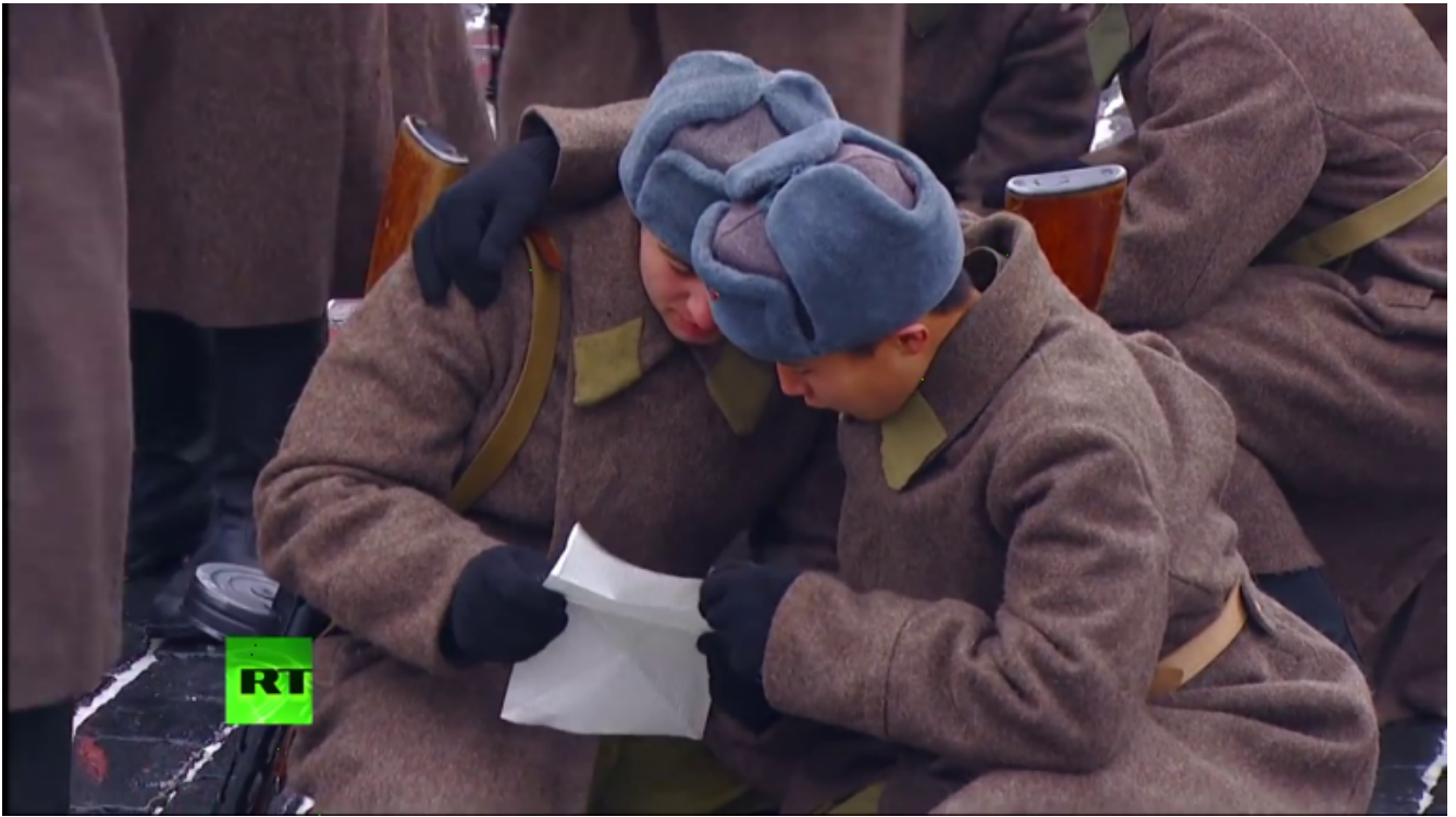
Figuranti che leggono lettere al fronte.

Ai suonatori si aggiunge una prima bionda fanciulla, autentica ruskaja krasavitsa (bellezza russa), drappeggiata in un grande scialle a fiori, altro tocco di stile nazionale, che, sullo sfondo delle immagini di Lidija Ruslanova, grande interprete di canti popolari interpretati anche al fronte per i soldati, ora proiettate sul grande schermo, canta la canzone popolare russa che aveva commosso le trincee e fatto sognare i combattenti: Valenki (stivali di feltro), ennesimo rimando a una ben precisa identità nazionale.