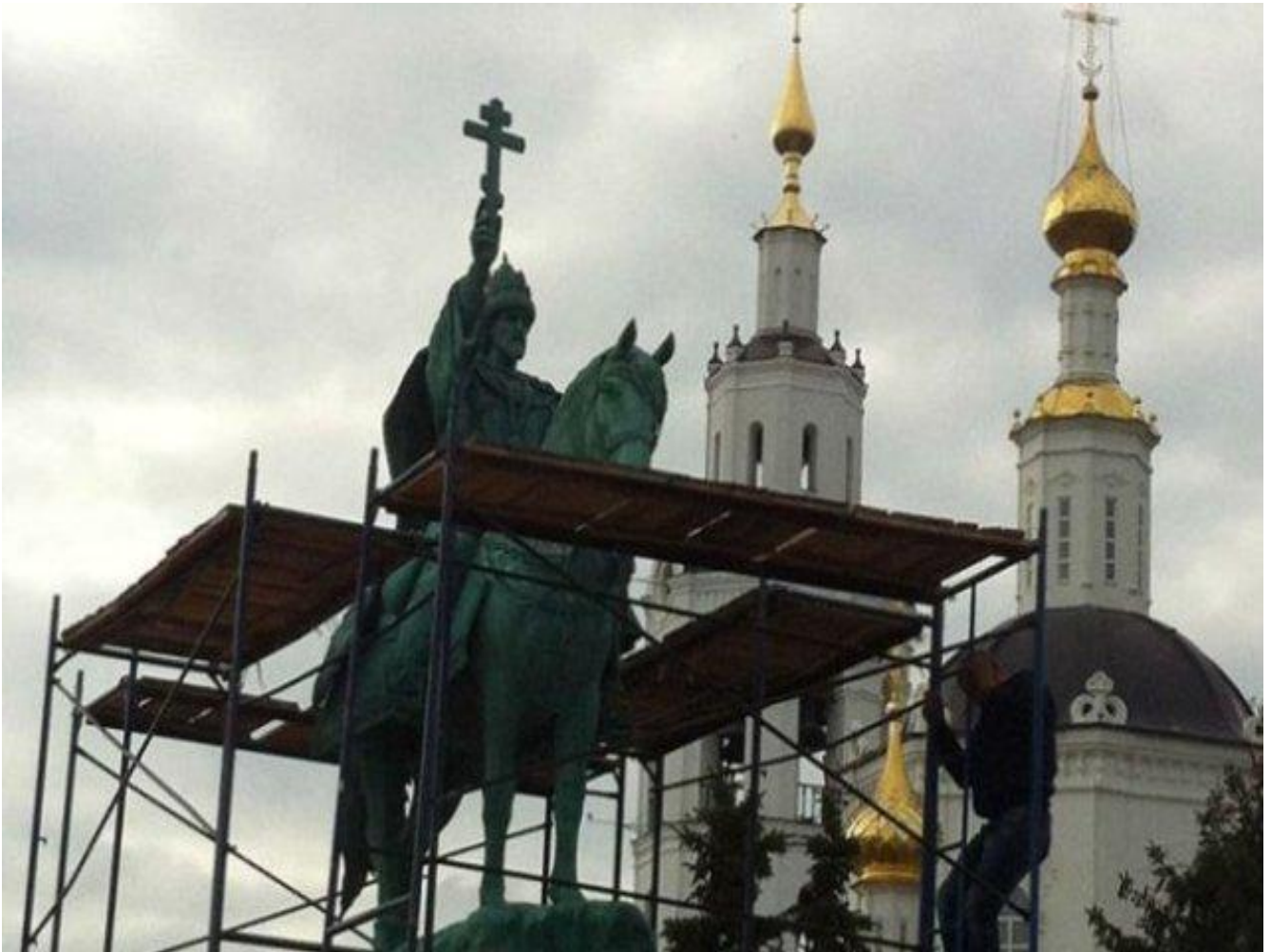
Monumento a Ivan il Terribile, Orël.

Veniamo ora alla manifestazione che si è tenuta sulla piazza Rossa il 7 novembre scorso, 99° anniversario della Grande Rivoluzione Socialista d'Ottobre, per chiamarla con il nome che le è stato proprio nei settant'anni di esperimento sovietico. Ricorrenza delicata e foriera di possibile imbarazzo per l'autorità istituzionale. Come ignorare una data che ha influenzato le sorti del mondo? D'altro canto, come celebrare un evento responsabile di vessazioni e tormenti, da molti sconosciuto, da altri, però, nostalgicamente vagheggiato? Ricorrendo a un escamotage strategicamente geniale che si ripete già da 14 anni. Si è commemorato, con una "marcia solenne" ( toržestvennyj marš ), non una tradizionale parata militare, non già il 7 novembre 1917 ma lo stesso giorno del 1941, quando in una Mosca pressata dall'avanzata nazista la piazza Rossa si era colmata di 28.000 soldati, cavalli e mezzi corazzati per dare all'intero Paese il segnale che la capitale non si arrendeva. Le truppe marciarono dalla piazza Rossa direttamente verso il fronte difensivo che tratteneva a stento l'avanzata tedesca. Evento di altissima portata simbolica che avrebbe fornito energie e sostegno ai