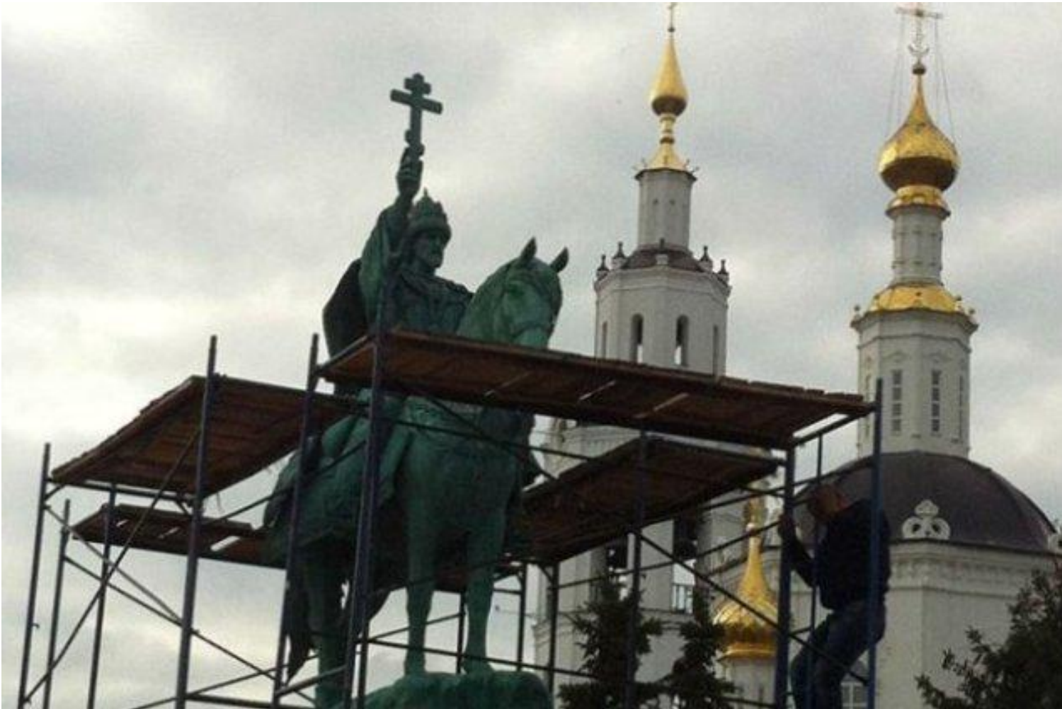
Monumento a Ivan il Terribile, Orël.

Veniamo ora alla manifestazione che si è tenuta sulla piazza Rossa il 7 novembre scorso, 99° anniversario della Grande Rivoluzione Socialista d'Ottobre, per chiamarla con il nome che le è stato proprio nei settant'anni di esperimento sovietico. Ricorrenza delicata e foriera di possibile imbarazzo per l'autorità istituzionale. Come ignorare una data che ha influenzato le sorti del mondo? D'altro canto, come celebrare un evento responsabile di vessazioni e tormenti, da molti sconosciuto, da altri, però, nostalgicamente vagheggiato? Ricorrendo a un escamotage strategicamente geniale che si ripete già da 14 anni. Si è commemorato, con una "marcia solenne" ( toržestvennyj marš ), non una tradizionale parata militare, non già il 7 novembre 1917 ma lo stesso giorno del 1941, quando in una Mosca pressata dall'avanzata nazista la piazza Rossa si era colmata di 28.000 soldati, cavalli e mezzi corazzati per dare all'intero Paese il segnale che la capitale non si arrendeva. Le truppe marciarono dalla piazza Rossa direttamente verso il fronte difensivo che tratteneva a stento l'avanzata tedesca. Evento di altissima portata simbolica che avrebbe fornito energie e sostegno ai combattenti e al popolo delle retrovie.