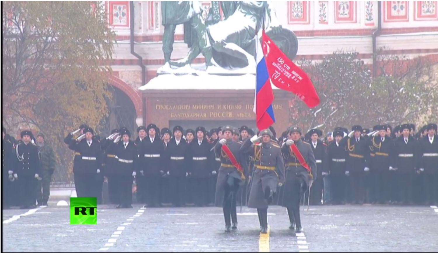
Bandiera russa e vessillo della vittoria.

L'accento della manifestazione si focalizza subito, grazie ai commenti dei due speaker, sul concetto chiave: "l'intero paese guarda a Mosca e difende Mosca. I veterani, che avevano preso parte alla "leggendaria parata del 1941", devono sapere che il Paese non dimentica il loro eroismo e continua ad andarne fiero.