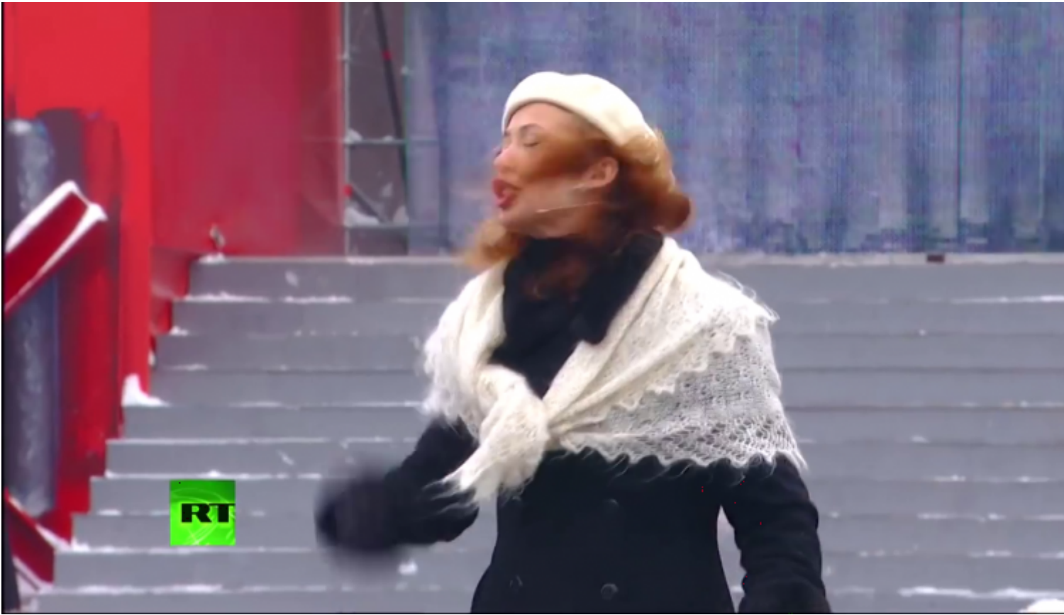
Attrice che legge una poesia.

I finti soldati, che trasportano in tutta la sua estensione orizzontale, una leggendaria bandiera rossa, si lanciano su per la scalinata tra nuvole di fumo e rombo di mitraglie. Chi vuole può leggerci di tutto, dalla presa del palazzo d'inverno a quella del Reichstag berlinese.