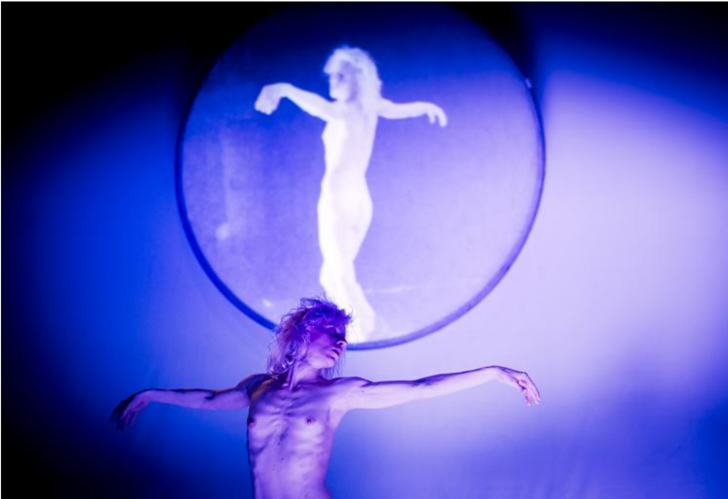
MDLSX