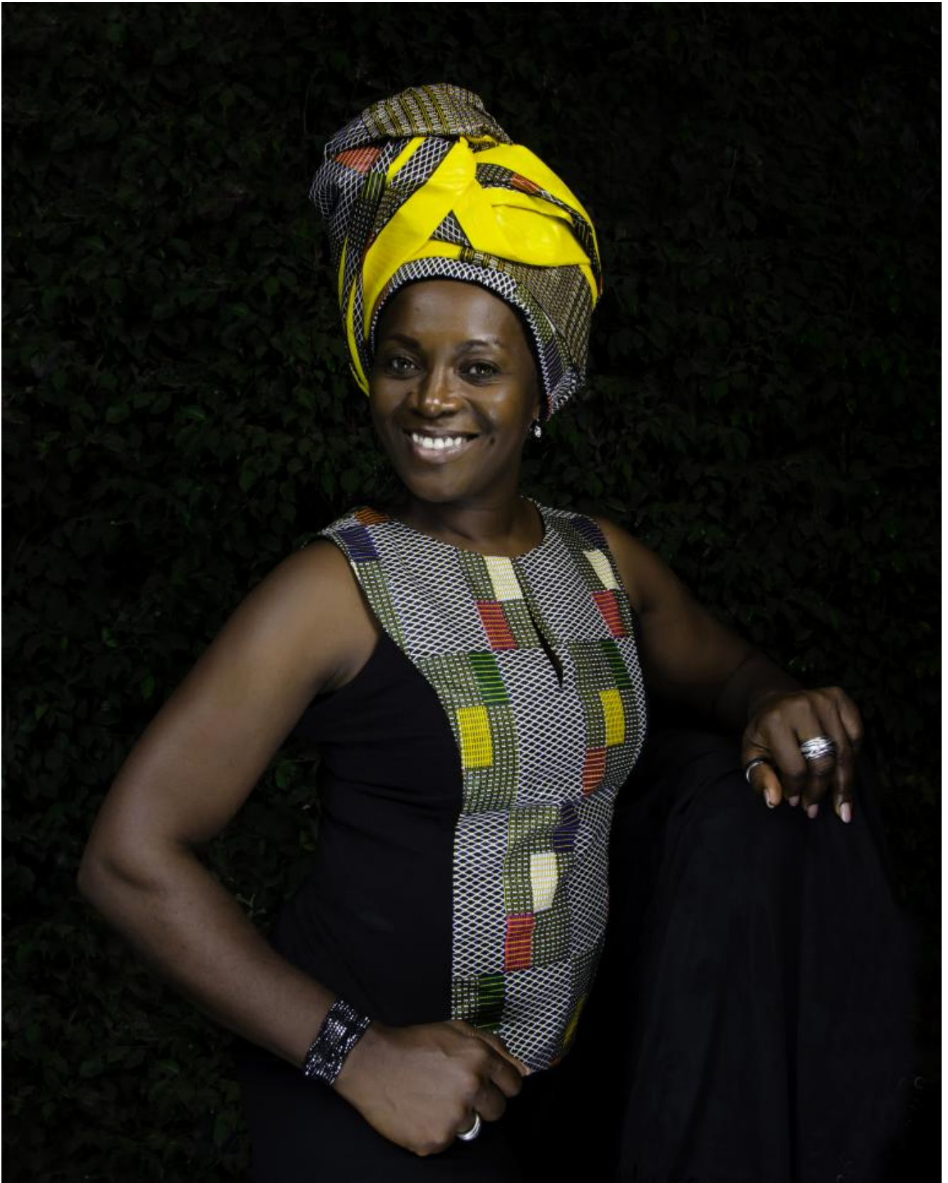
Angèle Etoundi Essamba, ph Daouda Timera.