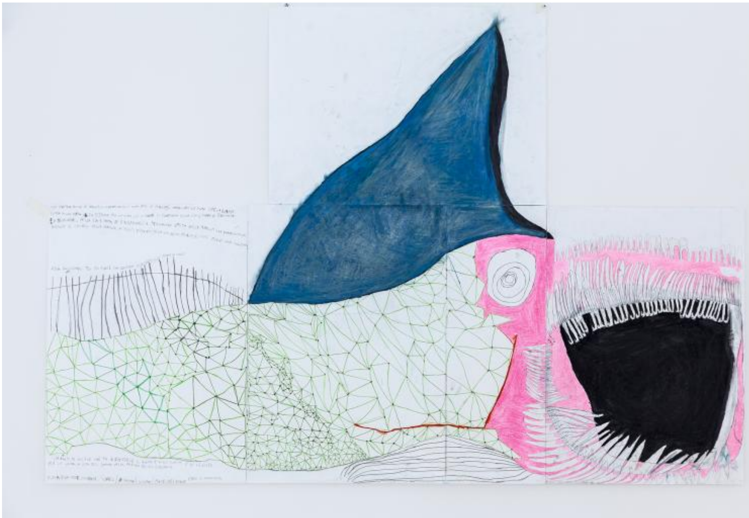
Furia buia morte sussurrante, 120x175, 2015, Wael, Atelier dell'errore.