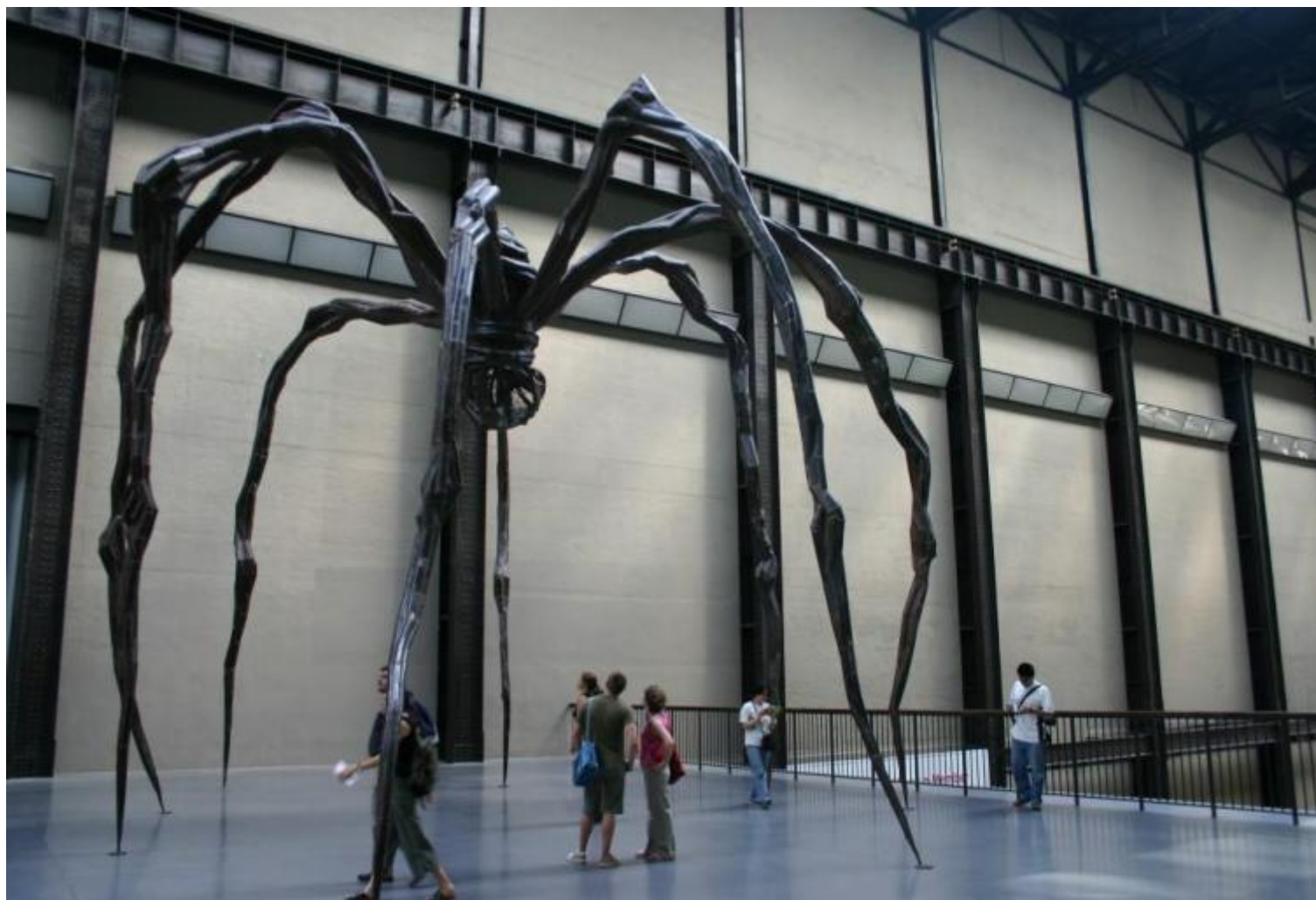
Louise Bourgeois, Maman Turbine Hall.

Calano dall'alto figure imbozzolate, raggomitolate. Spogliate di tutto, se non del loro potere perturbante – esibito in modo diretto, brutale. Non geometricamente, ma psichicamente al centro della grande sala bianca – l'«Artist Room» che presenta parte della collezione permanente del museo, al quarto piano della Tate Modern – il grande ragno metallico nero, i cui lunghi artropodi alieni poggiano sul parquet lucido e liscio (sarà esposto qui sino alla metà dell'anno prossimo). Non è il primo ragno scolpito da Louise Bourgeois, ma in molti sensi è il definitivo. È un lavoro realizzato nel 1999, quando l'artista ha quasi novant'anni, e il suo titolo semplicemente è Maman .