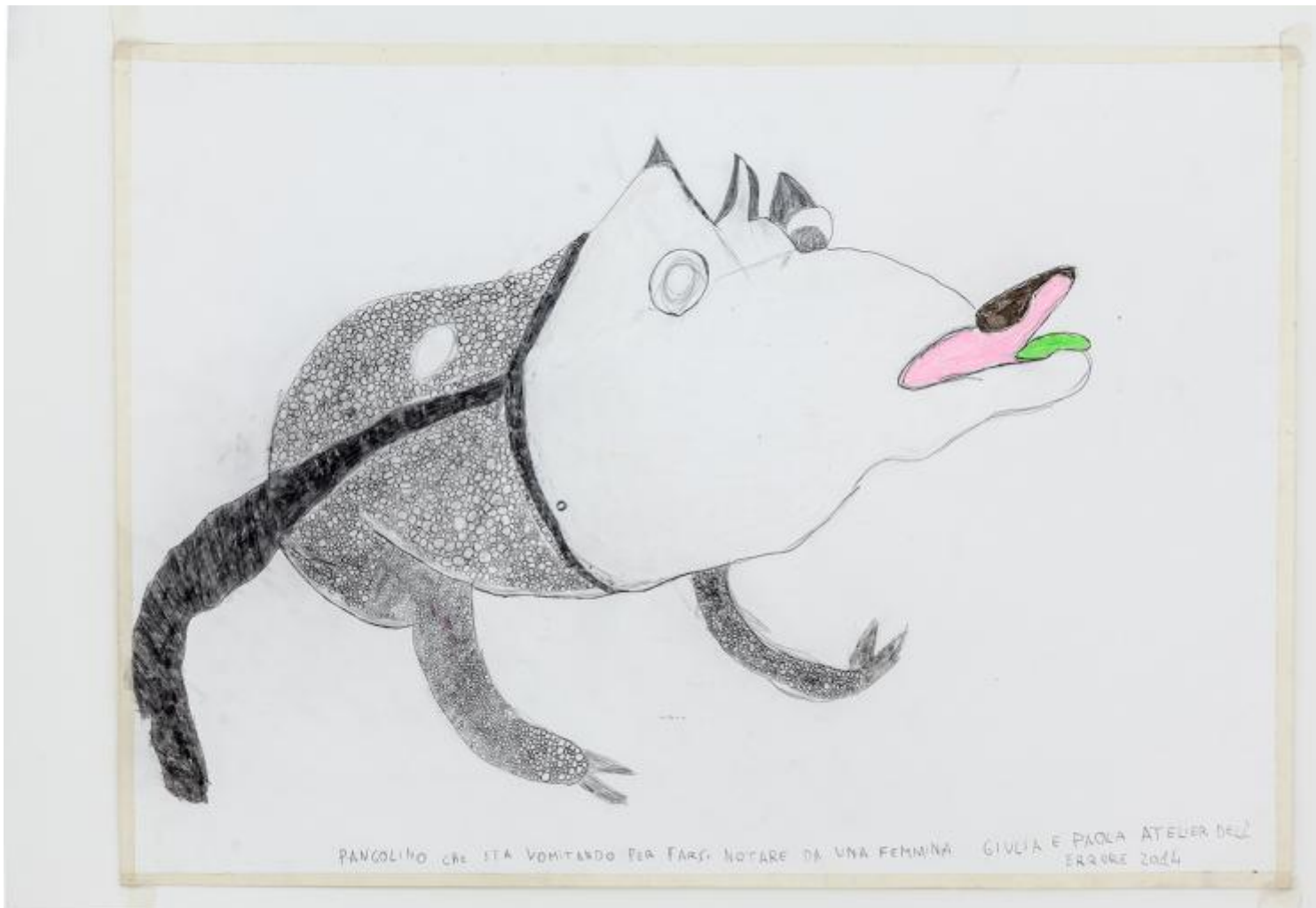
Pangolino che sta vomitando per farsi notare da una femmina, 50x70, 2014, autori vari, Atelier dell'errore.

immagini del libro – di psichiatri e psicoanalisti, scrittori, persino un teologo –, quella di Massimiliano Gioni, che nel Palazzo Enciclopedico all'edizione 2013 della Biennale di Venezia ha esplicitamente raccolto il testimone di Szeemann; e che applica alle immagini il paradigma deleuze-guattariano della sovversione linguistica operata dalla «letteratura minore»).