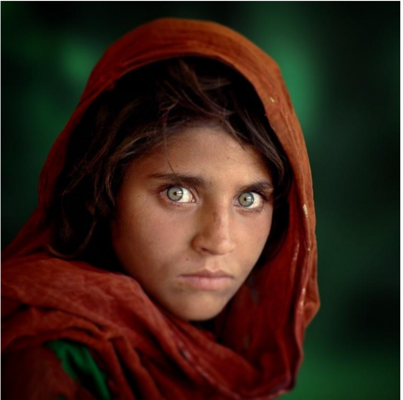
SharbatGula

L'immaginario globale sui pashtun si nutre del discorso coloniale che li ha costruiti come soggetti belli e violenti. I pashtun sono belli, come bella era Sharbat Gula, la bambina resa famosa dagli scatti di Steve McCurry. Come milioni di profughi afgani, Sharbat è stata recentemente ritrovata in un campo rifugiati in Pakistan, repatriata e persino ricevuta dal presidente Ashraf Ghani. Ma i pashtun sono anche una razza marziale secondo le gerarchie razziste (post)coloniali, sono guerrieri, coraggiosi, violenti. Questo ben radicato stereotipo si fonde con la quasi automatica equazione tra un'intera e variegata etnia, divisa in due paesi da confini imposti dagli inglesi, e i talebani. In particolare, la valle di