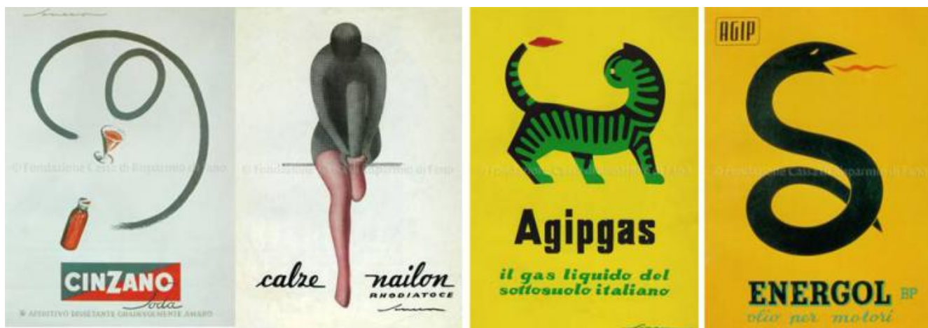
Cinzano Soda, 1951, Raccolta Salce, Treviso; Rhodiatoce Nailon, 1954; AgipGas, 1955; Energol, 1955, Raccolta Salce, Treviso.

Il linguaggio grafico di Federico Seneca, in un primo momento vicino all'elegante raffinatezza di Marcello Dudovich, dopo la breve parentesi futurista, tratterà esiti originalissimi che avranno spesso come protagonisti curiosi animali dalle improbabili forme sinuose e dalle focose attitudini, ideate per stupire il pubblico.