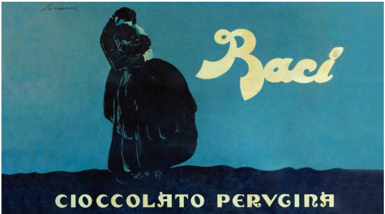
Bozzetto realizzato da Federico Seneca nel 1922 per il lancio dei 'Baci' Perugina.

La sua creazione-icona è senza dubbio la pubblicità del Bacio Perugina raffigurante due amanti abbracciati. Quest'immagine, da lui ottenuta rielaborando in stile affiche il soggetto del famoso quadro di Francesco Hayez, "Il Bacio", è entrata a far parte a buon diritto del nostro immaginario collettivo. Frutto del suo ingegno sono anche il logo, la scatola blu e l'idea dei cartigli-messaggio che avvolgono il mitico cioccolatino, vero e proprio must per molte generazioni di innamorati.