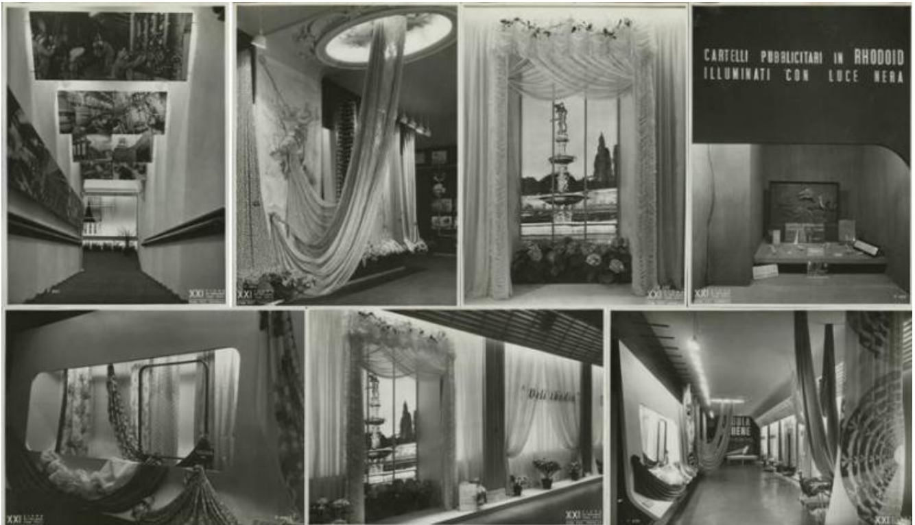
Milano. Fiera campionaria del 1940, Padiglione Montecatini, Sala Rhodia Albene. Allestimento di Federico Seneca.

La mostra di Chiasso, composta da più di 300 reperti, nel febbraio 2017 varcherà le Alpi, con un tour che la porterà dapprima a Perugia, quindi a Fano e infine a Treviso. Ci saranno dunque molte occasioni per andare a conoscere questo singolare e poco noto cartellonista, alcune delle cui opere sono paradossalmente più famose del suo nome.