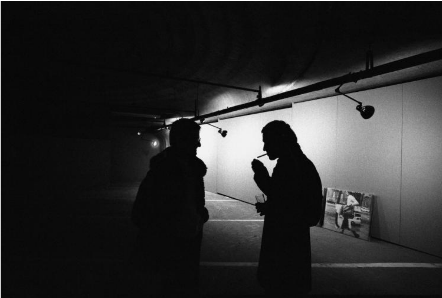
Giulio Paolini e Alighiero Boetti a contemporanea, parcheggio villa borghese, Roma, 1973-1974