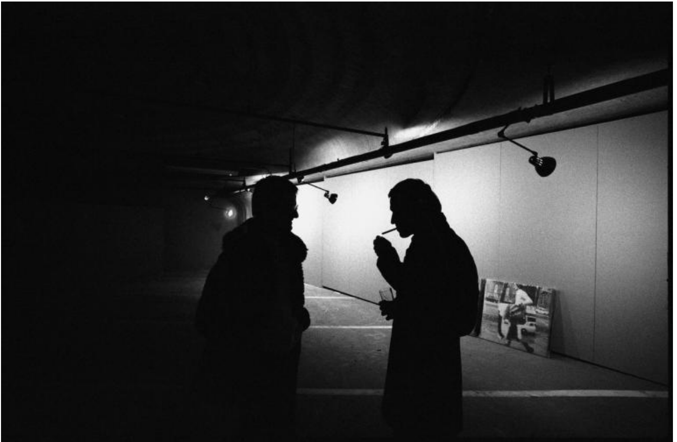
Giulio Paolini e Alighiero Boetti a contemporanea, parcheggio villa borghese, Roma, 1973-1974