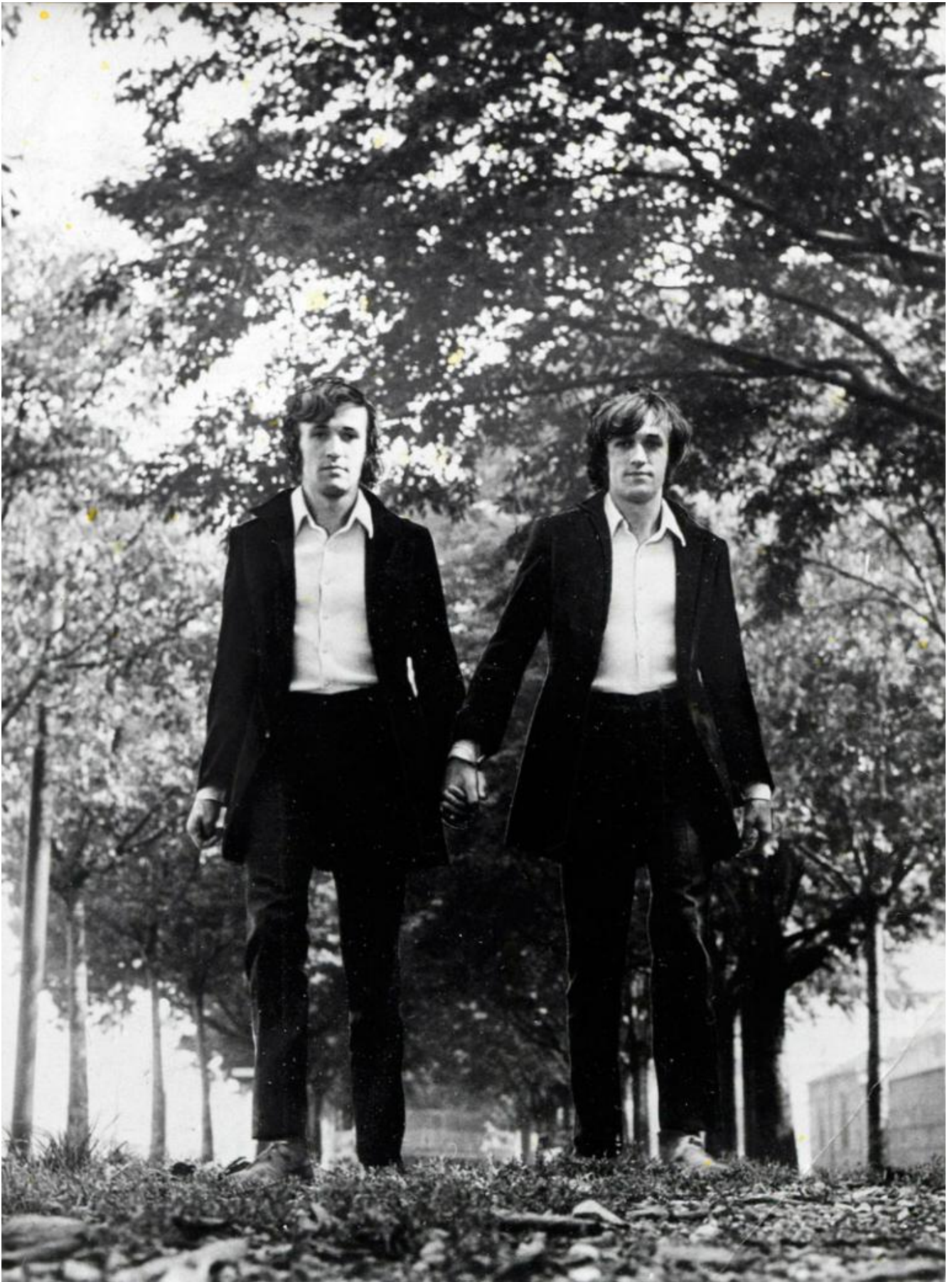
Alighiero Boetti, genelli, 1968.