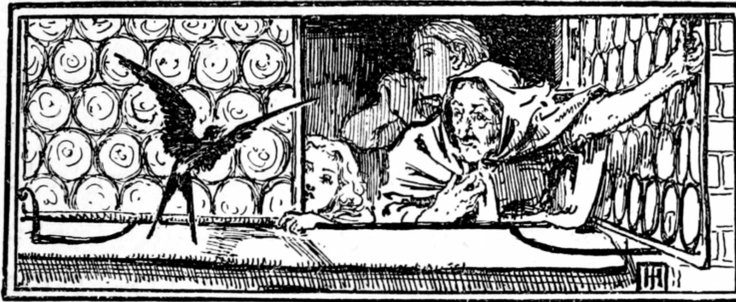
Oscar Wilde, The Happy Prince , illustrazioni di Walter Crane, 1889.

L'arte letteraria di Wilde, tuttavia, dissimula nel passo danzante della fiaba la profondità della visione e delle intuizioni. Ecco, infatti, appena presentato il Principe, entrare in scena la coprotagonista: «Una notte volò sulla città una piccola Rondine. Le sue amiche erano volate in Egitto già da alcune settimane, ma lei era rimasta indietro perché si era innamorata di un bellissimo Giunco.»