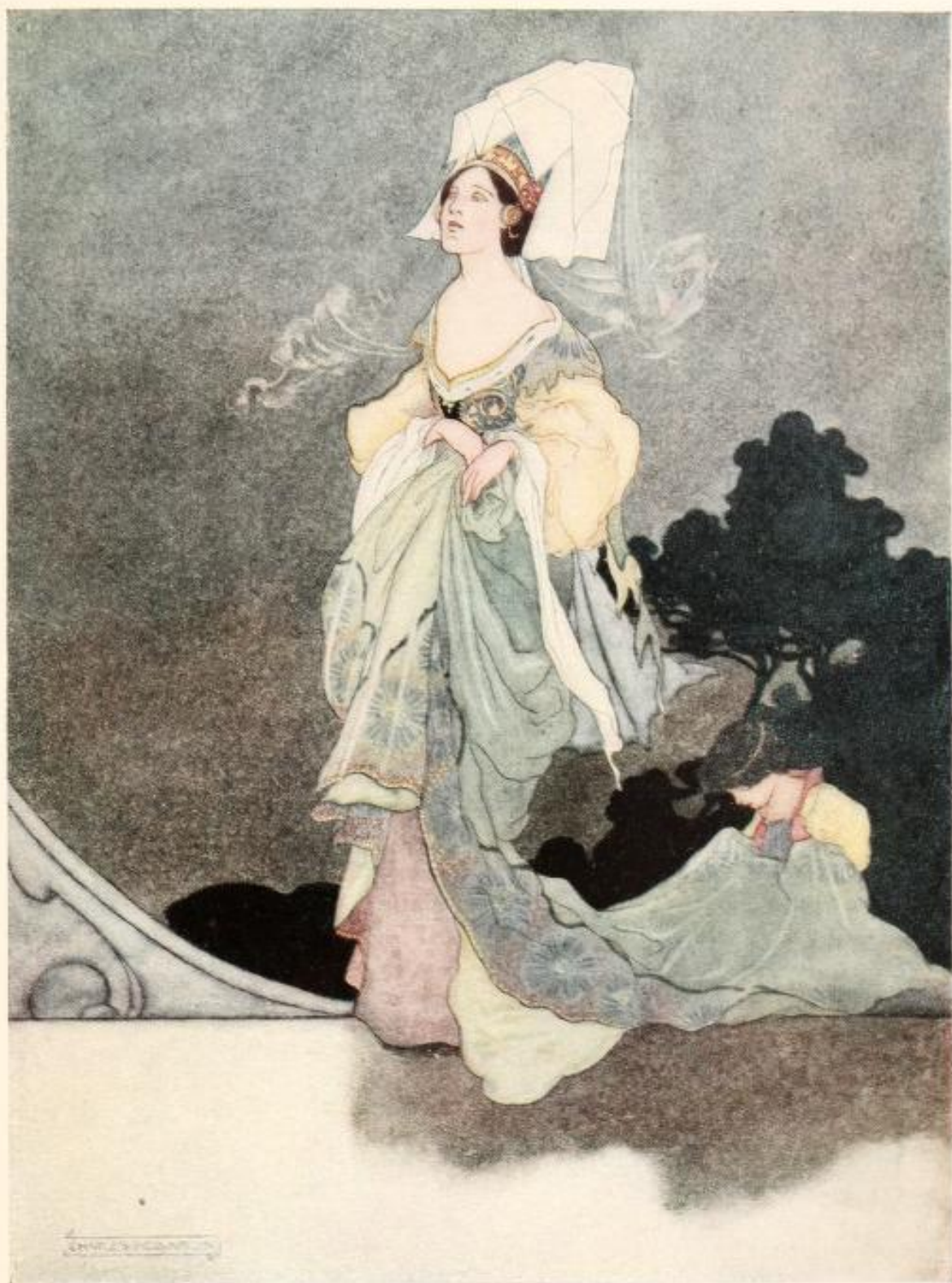
THE LOVELIEST OF THE QUEEN'S MAIDS OF HONOUR.