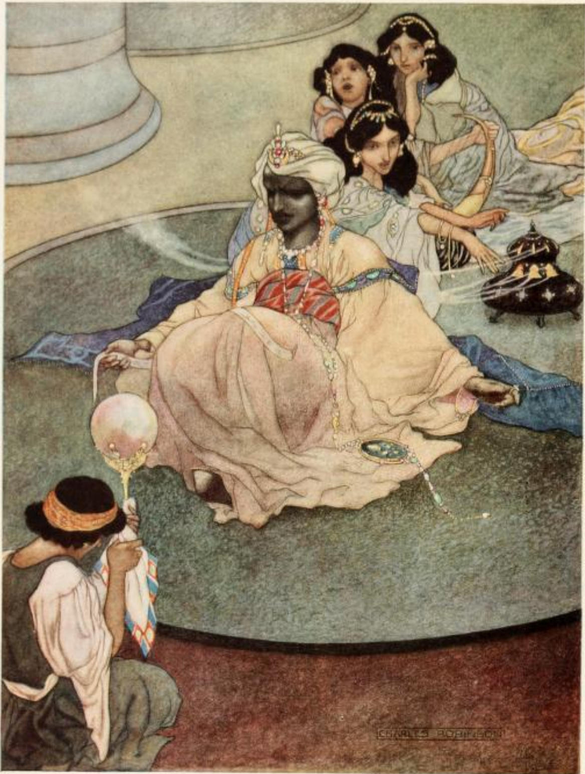
THE KING OF THE MOUNTAINS OF THE MOON