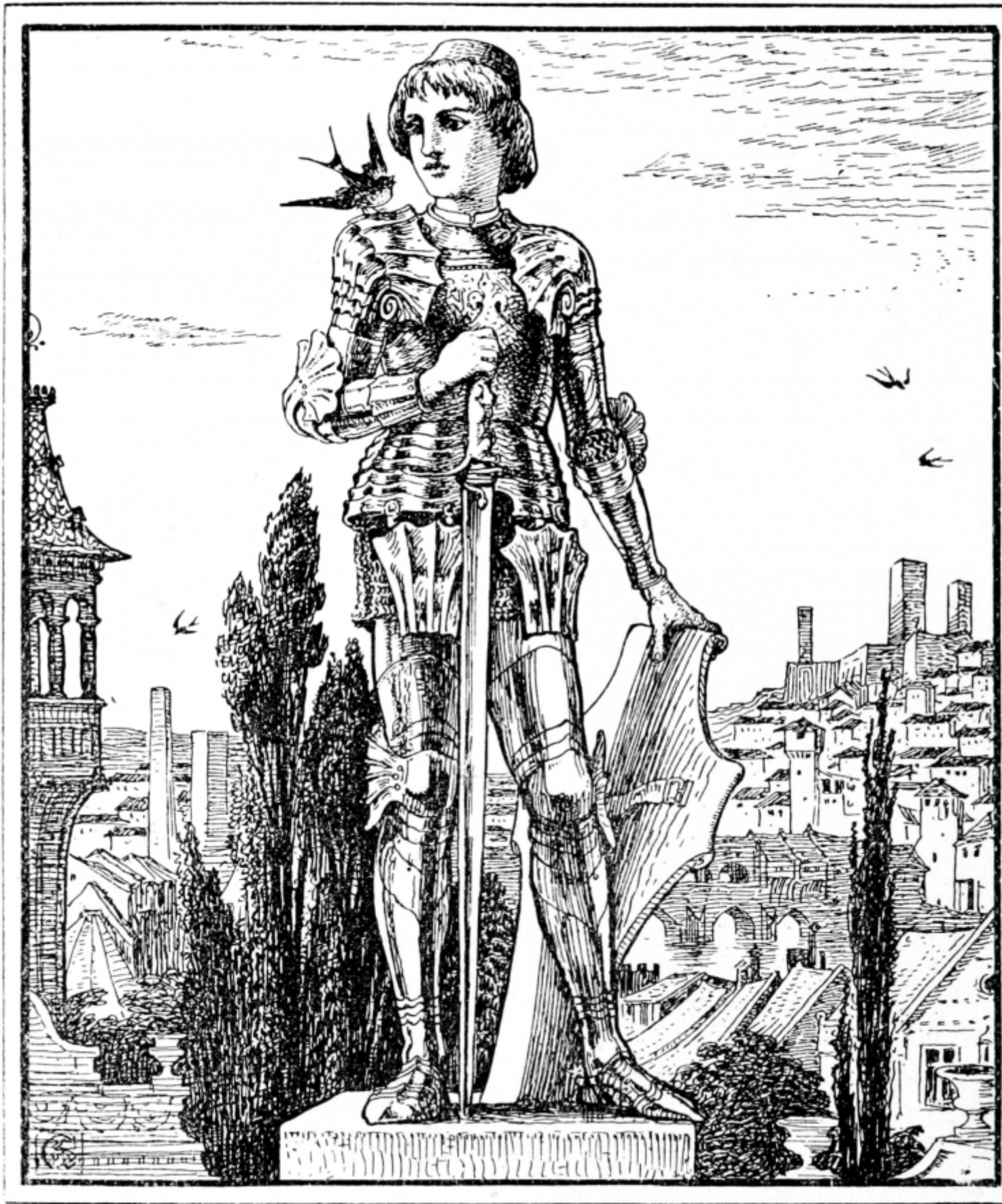
Oscar Wilde, The Happy Prince , illustrazioni di Walter Crane, 1889.