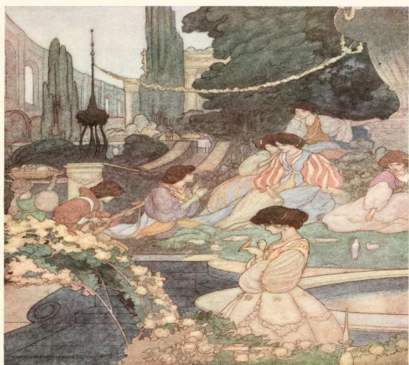
THE PALACE OF SANSSOUCI

Un celebre testo in cui Wilde dà voce alla seduzione che su di lui esercitarono le atmosfere orientali e in particolare l'Egitto, è la poesia The Sphinx dedicata a Marcel Schwob e pubblicata nel 1894 in un'edizione decorata da Charles Ricketts, nei dettagli mitologici e archeologici debitrice alle atmosfere nilotiche di La tentation de saint Antoine di Gustave Flaubert. Così comincia: « In un angolo scuro della mia stanza, da più tempo di quanto mi figuri, una Sfinge bella e silenziosa mi fissa nell'oscurità che cade. Inviolata e immobile non si alza e non si muove, poiché le lune d'argento sono niente per lei, e niente il ruotare dei soli. [...] Le albe si susseguono e le notti invecchiano, e frattanto questo curioso gatto se ne sta sempre accucciato sulla stuoia cinese con occhi di raso bordati d'oro. [...] Avvicinati, o squisito grottesco, mezzo donna e mezzo animale! Avvicinati, mia bella e languida Sfinge! E posami il capo sul ginocchio! [...] Mille stanchi secoli sono tuoi, mentre io non ho visto che una ventina di estati spogliarsi del verde per le vistose livree dell'autunno. Ma tu sai leggere i geroglifici sui grandi obelischi di arenaria, e hai discorso con i Basilischi, e hai contemplato gli Ippogrifi. [...] Alza quei grandi occhi di raso nero, che sono come cuscini in cui si ntami tutti i tuoi ricordi! »