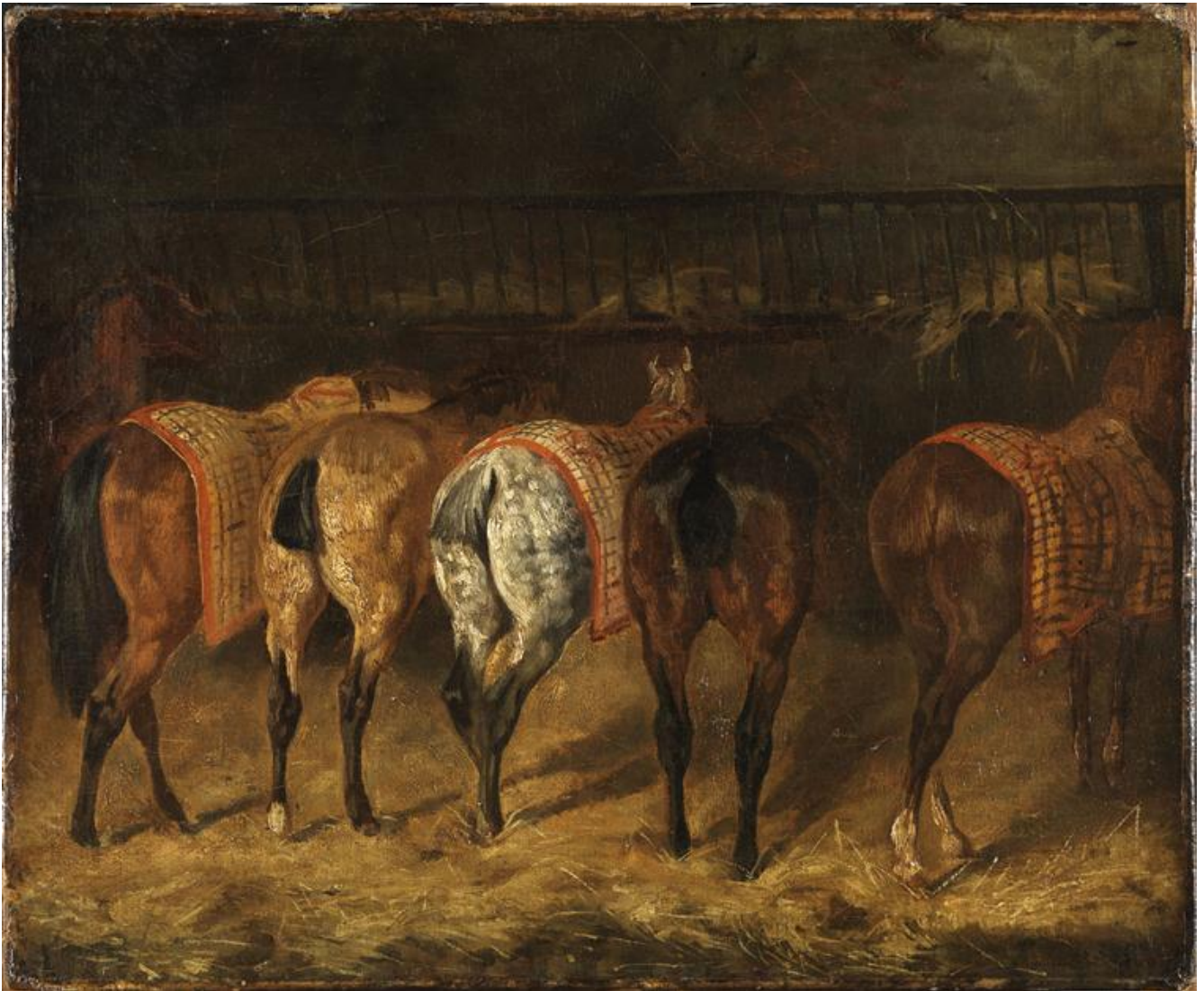
Gericault, cinq chevaux.