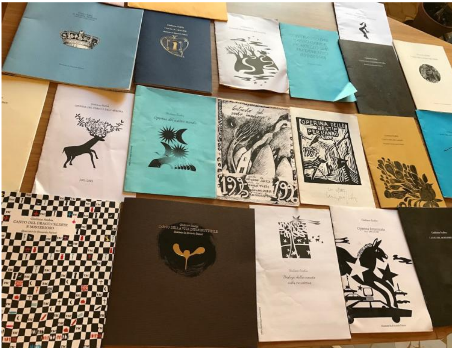
Le operine di auguri; ph. Castorp

Teatro di poesia, teatro che cerca di guardare oltre ciò che appare, oltre lo spettacolo, la vita come sembra essere, di lato, dentro, a fondo, sopra... Poesia che nella voce, nel ritmo del passo nel mondo, nell'apparizione davanti a altri si realizza. Pietra di Bismantova, stelle, comete, microbi, vita nell'epoca postindustriale e postmateriale e favole in testi che hanno bisogno della voce e del suo trasduttore, il corpo. Che necessitano degli sguardi per realizzarsi.