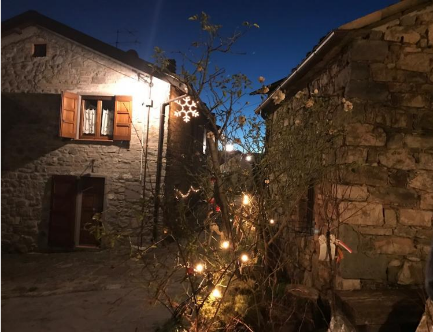
La casa della sera

Teatro segreto, teatro del dono: quello in cui si esce semplicemente da se stessi per incontrare. Con mezzi elementari, carta stoffa cartapesta corone dorate di niente mantelli di fuoco o di stelle sorrisi che sanno l'incrinatura del mondo, che cercano di vedere nelle trasformazioni personali e sociali, che scrutano perfino nel divenire del mondo infinitesimale delle molecole e in quello siderale dell'universo. Siamo lanciati, cavalli e cavalieri, in un viaggio detto vita che sembra breve ma è composto dalla polvere delle ere, dal lampeggiante divenire della materia che si fa spiriti.