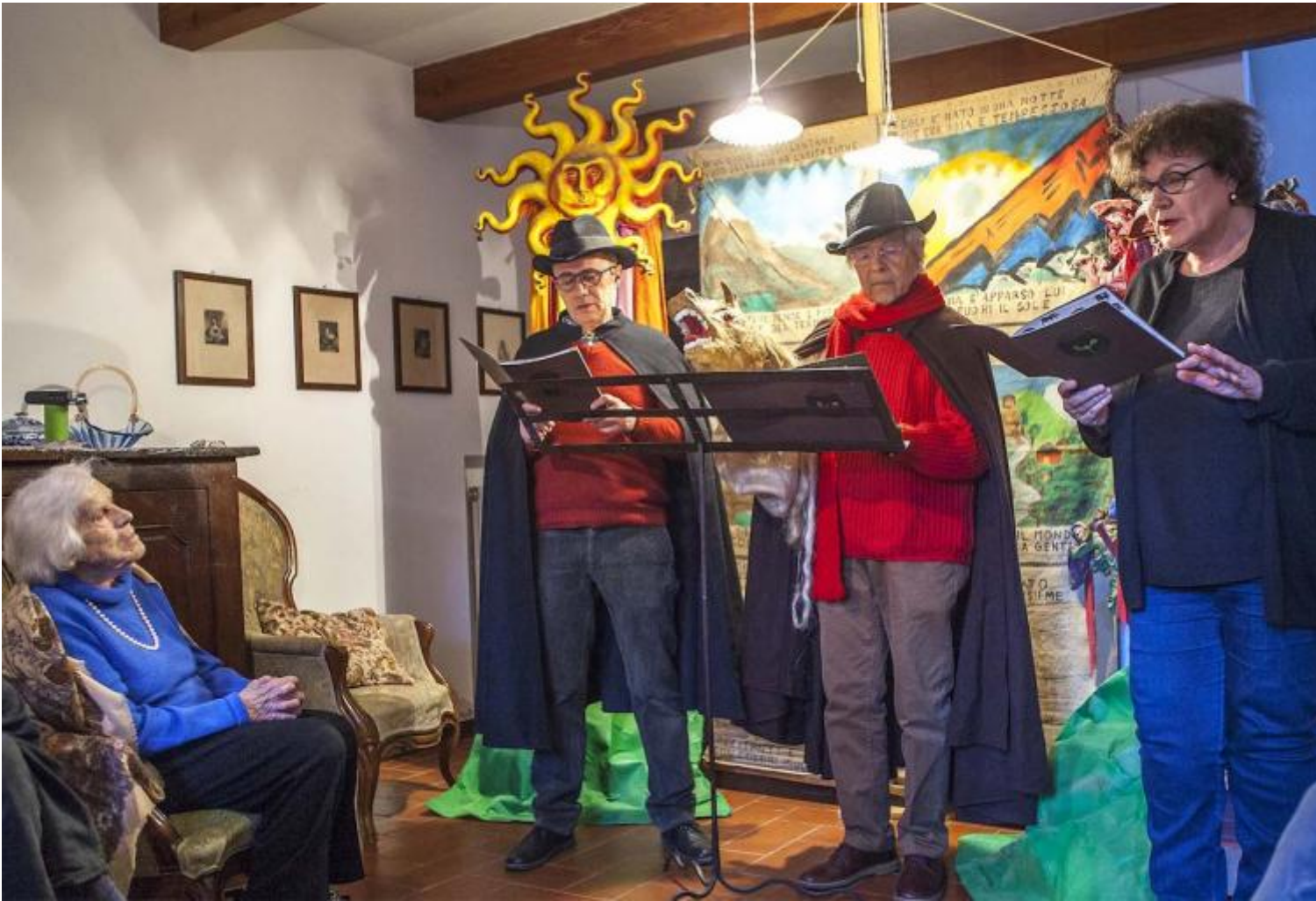
Marmoreto di Busana, Scabia e Marino Notari