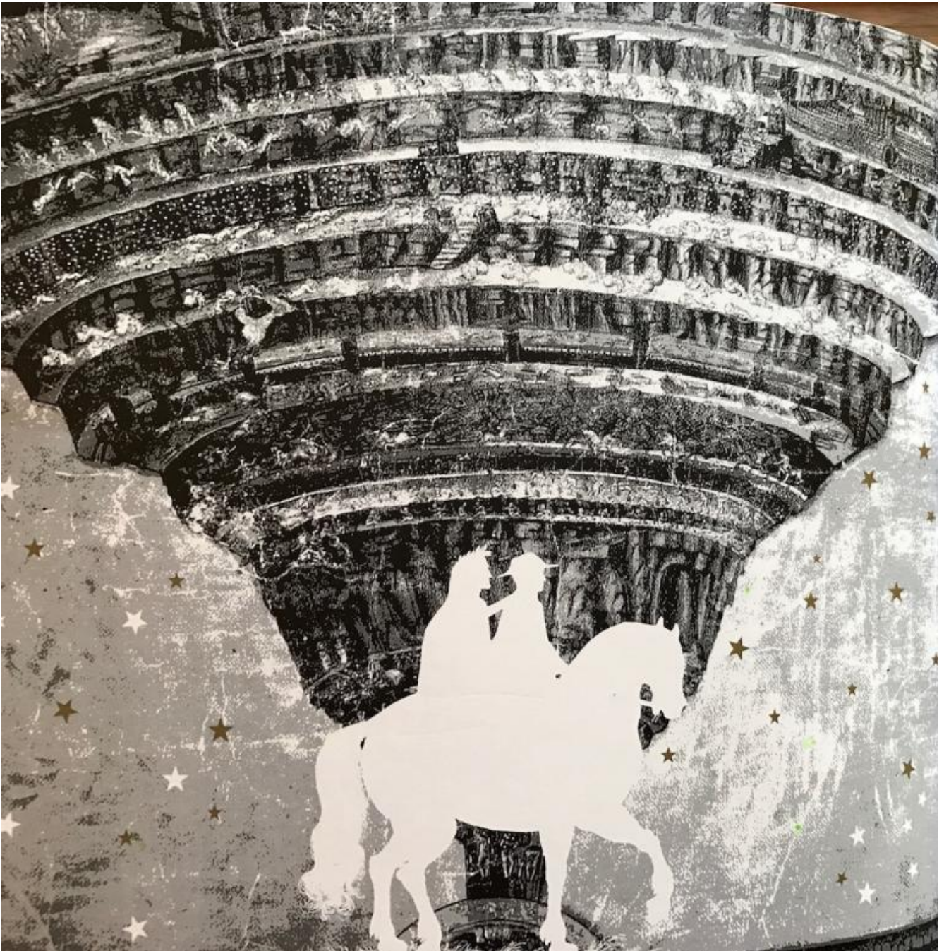
Il poeta Dante con cavaliere e cavallo benegheli

paesaggi umani, già devastati dalla povertà e dall'emigrazione, orgogliosi di un passato che era stato anche lotta ai nazifascisti. Trovammo un poema dall'andamento tassiano sulla Resistenza in quelle valli, la Vera storia di Amilcare Vegeti, merciaio ambulante. Trovammo giovani e meno giovani che si interrogavano sullo sviluppo diseguale, che svuotava la montagna, che cambiava, travolgeva. Incontrammo Minghín e la sua famiglia, soprattutto allora Svenò dagli occhi di cielo e dalle mani da muratore che correvano agili sui tasti della fisarmonica in un prato sotto il suo monte Ventasso.