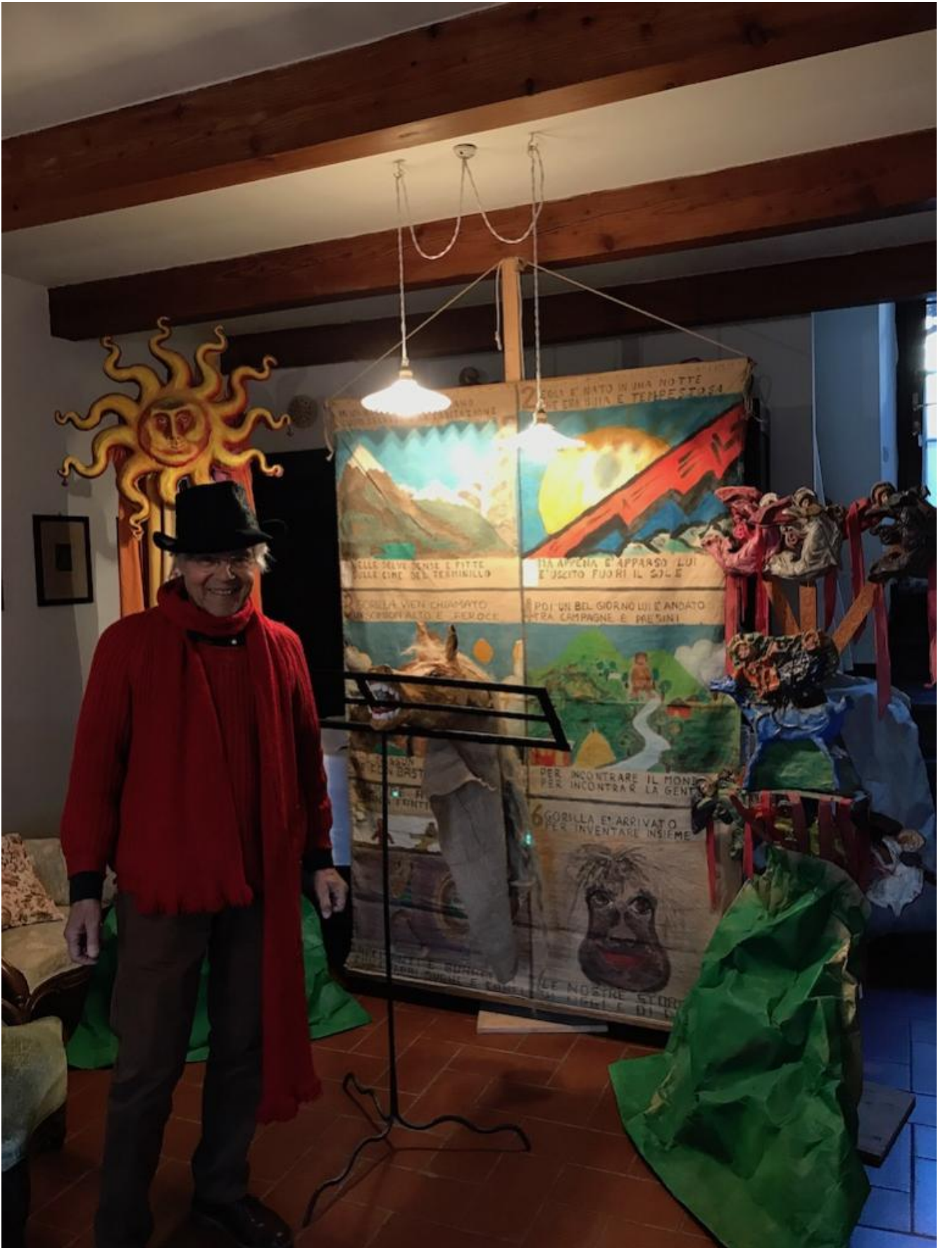
Scabia e cantastorie gorilla; ph. Castorp