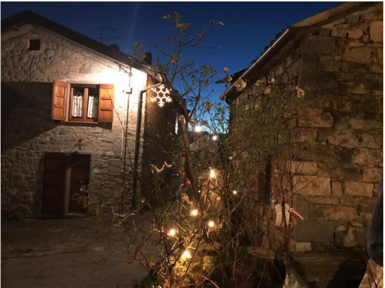
La casa della sera

Teatro segreto, teatro del dono: quello in cui si esce semplicemente da se stessi per incontrare. Con mezzi elementari, carta stoffa cartapesta corone dorate di niente mantelli di fuoco o di stelle sorrisi che fanno l'incrinatura del mondo, che cercano di vedere nelle trasformazioni personali e sociali, che scrutano perfino nel divenire del mondo infinitesimale delle molecole e in quello siderale dell'universo. Siamo lanciati, cavalli e cavalieri, in un viaggio detto vita che sembra breve ma è composto dalla polvere delle ere, dal lampeggiante divenire della materia che si fa spiriti.