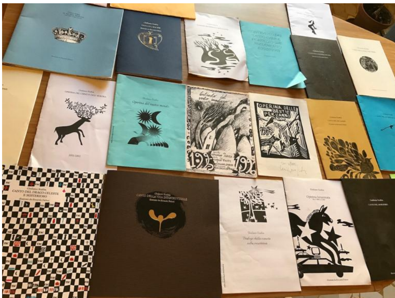
Le operine di auguri

Teatro di poesia, teatro che cerca di guardare oltre ciò che appare, oltre lo spettacolo, la vita come sembra essere, di lato, dentro, a fondo, sopra... Poesia che nella voce, nel ritmo del passo nel mondo, nell'apparizione davanti a altri si realizza. Pietra di Bismantova, stelle, comete, microbi, vita nell'epoca postindustriale e postmateriale e favole in testi che hanno bisogno della voce e del suo trasduttore, il corpo. Che necessitano degli sguardi per realizzarsi.