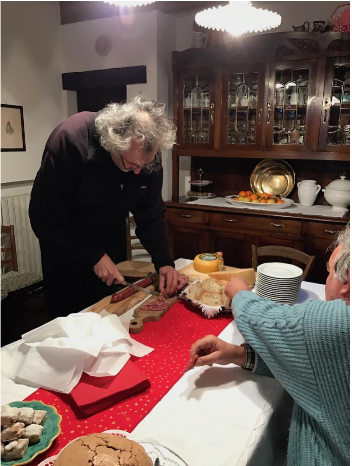
Dopo la lettura