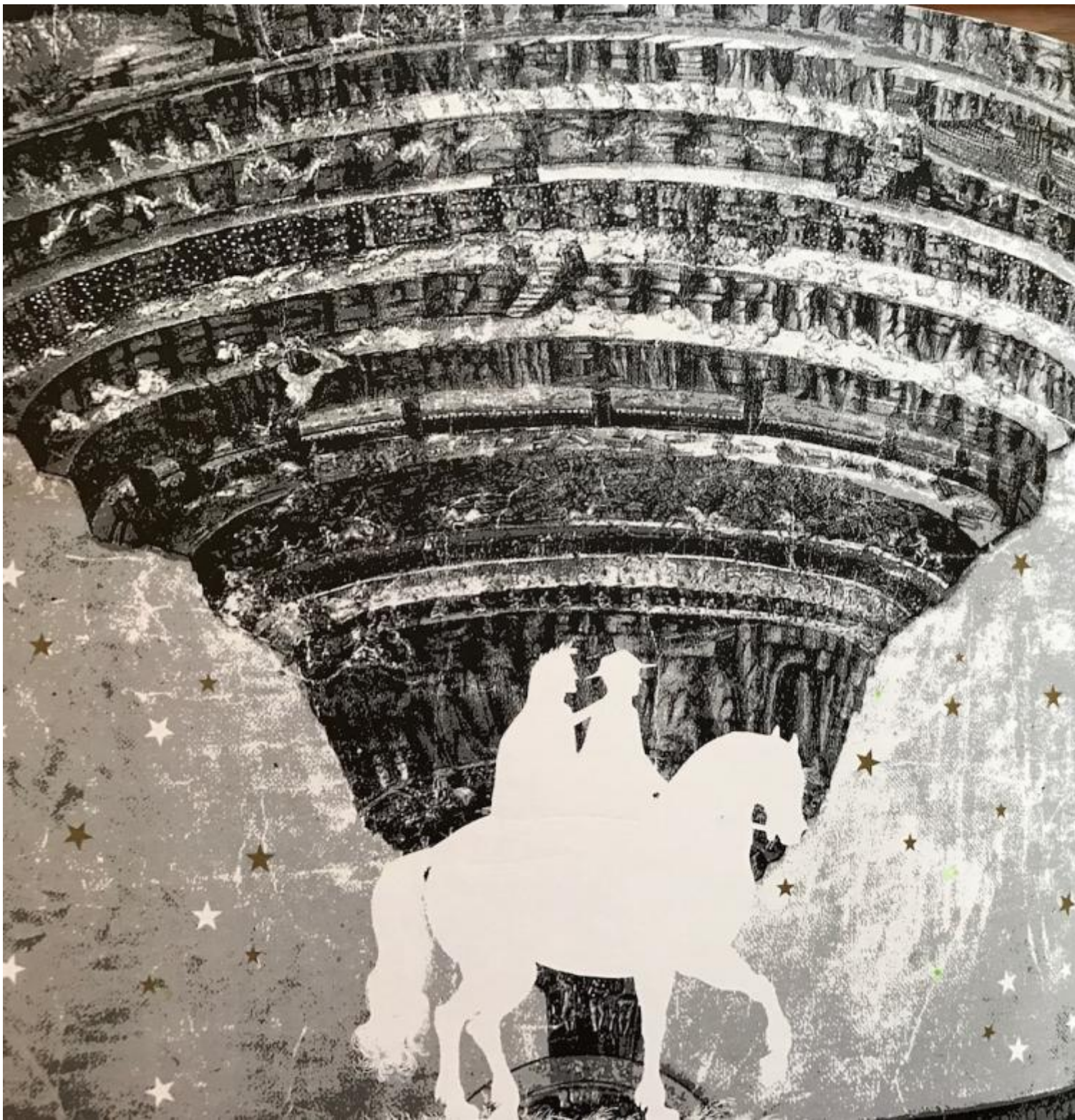
Il poeta Dante con cavaliere e cavallo benegheli

Fu per i venti studenti davvero (come scrisse Scabia) un “Viaggio verso le radici profonde di una cultura – la nostra, quella di chi ci sta accanto, quella che non conosciamo –: come itinerario verso le radici del nostro io e dell’ambiente dentro cui ci muoviamo”. Io e mondo, i poli in tensione di questo teatro dilatato, a partecipazione (scusate la rima, ma con Scabia e con i ricordi può scappare).