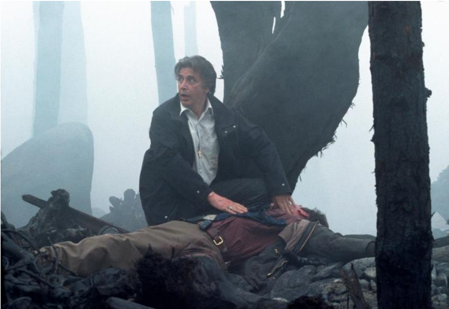
Al Pacino in Insomnia di Christopher Nolan (2002)

Sicché – continua Crary – l’antica metafora del risveglio (da San Paolo a Matrix passando per la Scuola di Francoforte), come segno del «recupero dell’autenticità» e della condizione eretta dell’essere umani contro ogni forma di sopraffazione, «è ormai inadeguato per un sistema globale che non dorme mai». La nostra condizione è più simile a quella dei personaggi di Kafka, o di Stalker di Tarkovskij (a me viene in mente soprattutto l’investigatore Al Pacino, istupidito dalla luce perenne dell’estate artica, in Insomnia di Christopher Nolan): perennemente deprivati del sonno viviamo in una condizione limbica, allucinatoria. E allora oggi, secondo Crary, rivendicare il diritto al sonno può essere considerata una forma di resistenza – ancorché, purtroppo, solo passiva –: perché proprio il sonno «interrompe risolutamente il furto di tempo che il sistema capitalistico compie ai nostri danni». La fortuna filosofica recente del personaggio di Bartleby di Melville, o quella letteraria dell’opera-vita di Albert Cossery, a proposito della quale vale davvero la formula di Giuseppe A. Samonà (curatore di recente del suo primo libro tradotto da noi, da Einaudi: I fannulloni della valle fertile ), «la rivoluzione del non fare», sono esempi di quella potenza destituente dell’ inoperosità che è divenuta cavallo di battaglia di tanto pensiero contemporaneo, da Blanchot ad Agamben passando per Nancy.