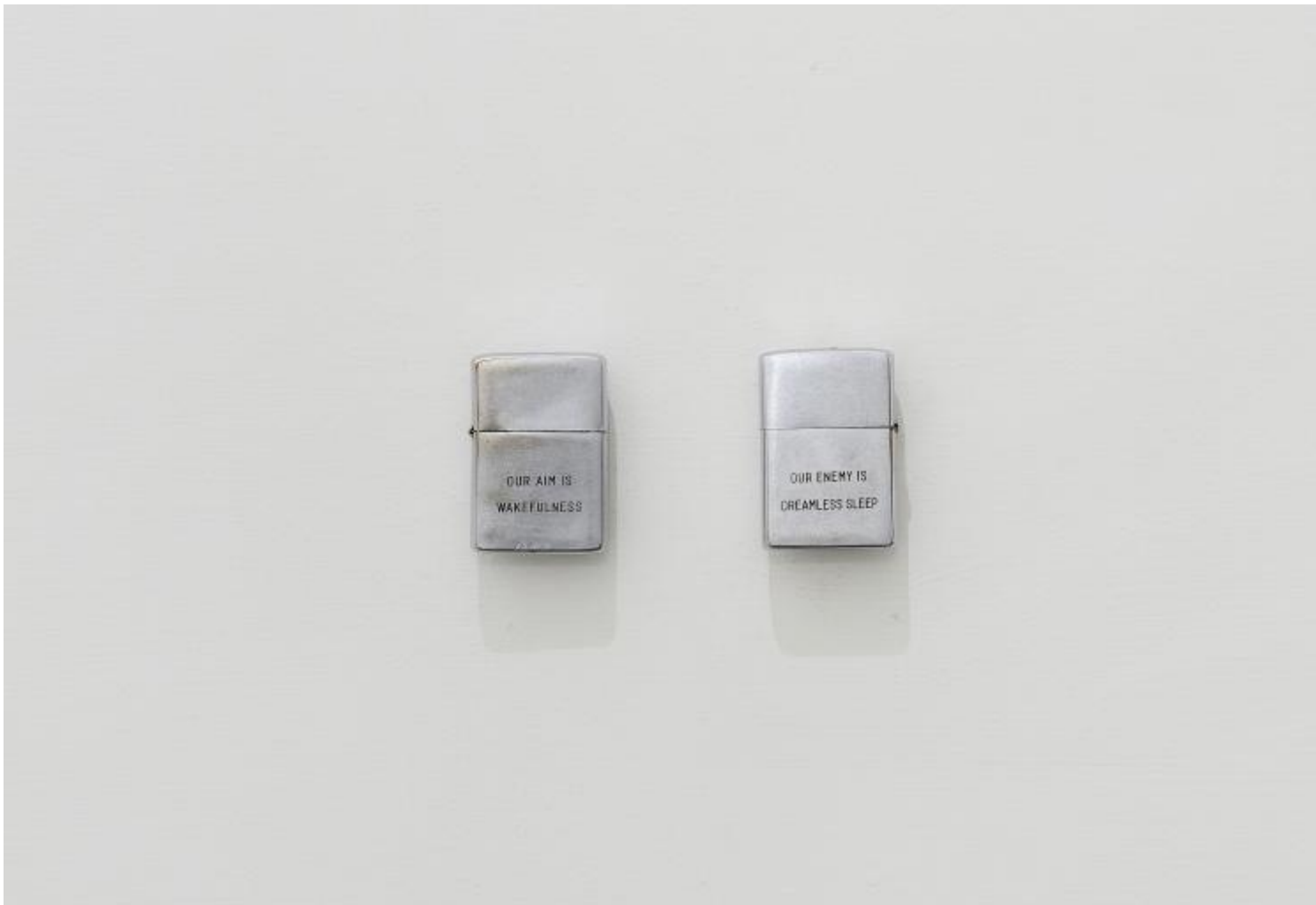
Elisabetta Benassi, Casse-Pipe , 2016, accendini Zippo, incisione laser su accendini, due elementi, ognuno 6,5 x 3,5 x 1 cm, Courtesy l'artista e Magazzino Roma

Fra le altre opere di Elisabetta esposte in Letargo , ce n'è una che pare riassumere in sintesi estrema tutte queste ambiguità. Sono due comunissimi, elegantissimi accendini Zippo, dalla superficie levigata e luccicante, sulla quale sono incise due scritte a tutte maiuscole, OUR AIM IS AWAKEFULNESS e OUR ENEMY IS DREAMLESS SLEEP: le parole d'ordine dell'odierna Mobilitazione Totale. E infatti il titolo del lavoro è Casse-Pipe , come quello del libro del 1949 in cui Louis-Ferdinand Céline raccontava il suo servizio militare, fra i corazzieri, alla vigilia della Grande Guerra. In argot , l'espressione casse-pipe designa il tirassegno e dunque allude appunto alla guerra (raccontata nel precedente Viaggio al termine della notte ) in cui i soldati, come pipe di gesso, sono esposti alla casualità del fuoco. Dunque il risveglio dal Letargo, bruciante e luminoso, coincide con la morte; e la nostra stessa vita letargica non è, allora, che una morte a credito. Se così stanno le cose, davvero, meglio restare ciechi.