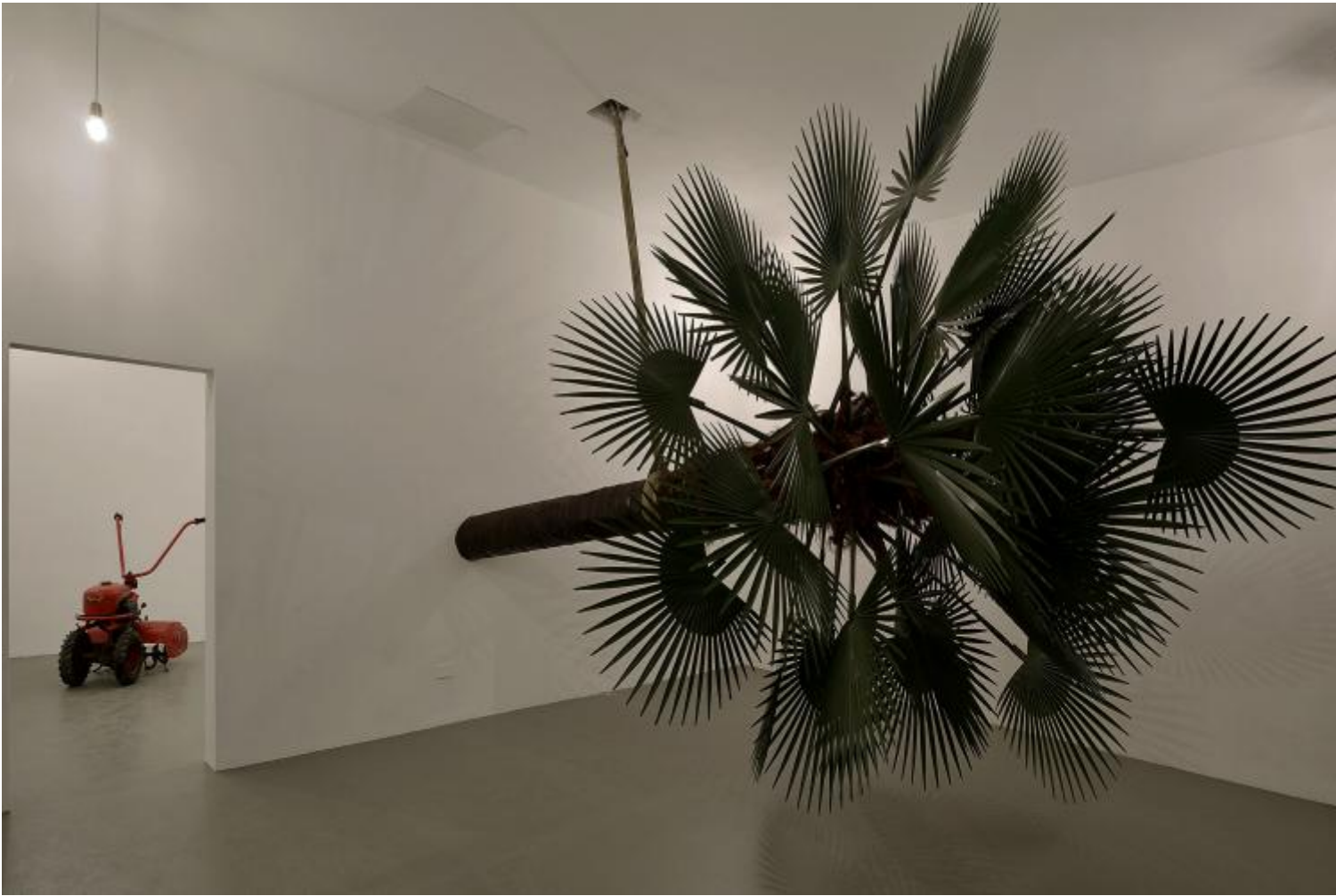
Elisabetta Benassi, Mimetica , 2016, palma artificiale, acciaio, resina, fibra naturale e polipropilene, 310 x 300 x 690 cm, Courtesy l'artista e Magazzino Roma

Shit! s'intitola un minuscolo e vezzoso gioiello in una teca da esposizione, come in un'oreficeria; e che si rivela essere, invece, un coprolite: l'escremento fossile di un dinosauro, cioè, raccolto in Madagascar. Ma il vero punto saliente della mostra è il lavoro che le dà il titolo, Letargo appunto.