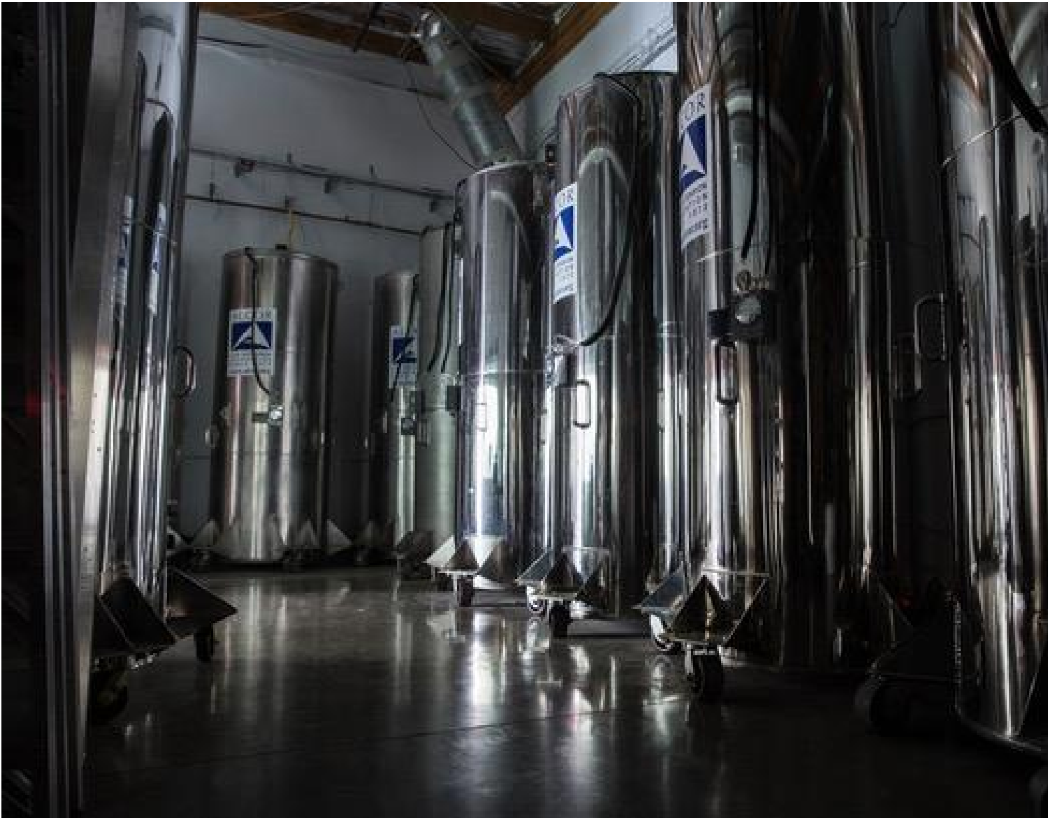
Alcor Life Extension Foundation, Scottsdale (Arizona)

dall'apostata Joyce). È sommamente ambiguo, DeLillo, nel far raccontare la storia di Convergence – la tecnologia biomedica d'avanguardia sovvenzionata dal miliardario Ross Lockhart, cui a un certo punto decide di sottoporsi lui stesso, seguendo nel suo destino la giovane moglie malata terminale di sclerosi – a uno che al suo fascino resta ostinatamente refrattario, a uno scettico insomma, come suo figlio Jeff. Ma non per questo penso sia corretto identificare Convergence, come è stato fatto, con l'inferno (la «ghiaccia» vitrea di Cocito, nell'interpretazione dantesca). Semmai essa viene presentata come un paradiso, o almeno l'inizio di un paradiso possibile («è questo l'aldilà lunare del pianeta»; il Cielo della Luna è la prima sfera attraversata dalla Terza Cantica dantesca dove, come si ricorderà, «trasumanar significar per verba / non si poria»: proprio l'inadeguatezza delle parole umane viene denunciata dalla giovane consorte di Ross Lockhart, Artis Martineau, quando si prova a rendere lo stato di sospensione in cui si trova, nel lancinante intermezzo di Zero K ).