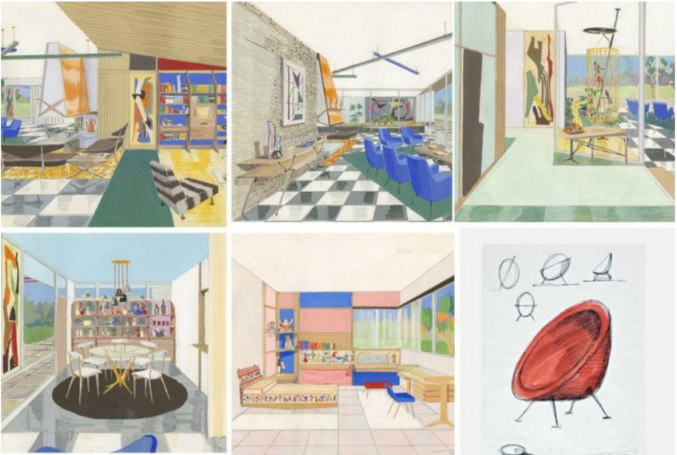
Ico e Luisa Parisi, rendering di un progetto di interni realizzato per un cliente degli Stati Uniti nel 1953; gouache su carta. Collezione privata. In basso a destra: schizzo per la Poltrona Uovo (penna su carta, Galleria Civica. Modena).

Ricordare Ico Parisi è il titolo della mostra che il Triennale Design Museum dedica al maestro comasco per celebrarne il centenario della nascita. Visitabile dal 15 gennaio fino al 19 marzo 2017 è allestita presso la sede della Villa Reale di Monza.