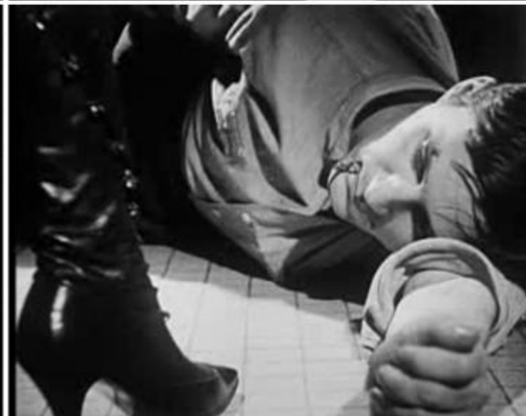
“Noviciat” (1965), di Noël Burch.

Si tratta insomma di passare al cinema tout court . Non necessariamente facendo film, ma rimanendo fedeli, da dentro la teoria, a ciò che davvero definisce il cinema, ovvero l'estraneità di ciò che penseremmo come intimo. Questo è quanto compie L'amour des femmes puissantes , un volume in cui Burch si mette letteralmente a nudo, innanzitutto in senso biografico. In esso egli rivela, infatti, ciò che molti indizi nel corso