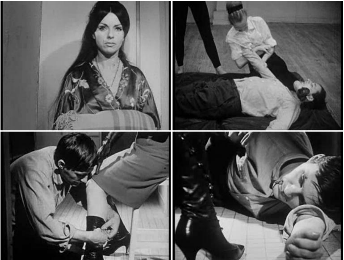
“Noviciat” (1965), di Noël Burch.

Si tratta insomma di passare al cinema tout court . Non necessariamente facendo film, ma rimanendo fedeli, da dentro la teoria, a ciò che davvero definisce il cinema, ovvero l'estraneità di ciò che penseremmo come intimo. Questo è quanto compie L'amour des femmes puissantes , un volume in cui Burch si mette letteralmente a nudo, innanzitutto in senso biografico. In esso egli rivela, infatti, ciò che molti indizi nel corso della sua carriera (ad esempio la fantasia erotica Noviciat , cortometraggio da lui realizzato nel 1965) lasciavano presagire, e cioè che la sua intera esistenza è ruotata intorno a un preciso fantasma masochista. E in quest'ultima frase l'aggettivo “preciso” ha ancora più rilevanza di “masochista”. Fin dalla più tenera età, Burch ha sognato di essere sottomesso fisicamente da donne sufficientemente capaci di usare il proprio corpo (soprattutto con il determinante ausilio delle arti marziali) per soggiogarlo. L'amour des femmes puissantes è un tentativo di dettagliare con il distacco dello scienziato (o dello scrittore flaubertiano) la sua viragofilia , termine che designa una sorta di sottoinsieme del masochismo maschile caratterizzato dall'attrazione per le donne forti capaci letteralmente di “mettere il maschio sotto”, rendendolo