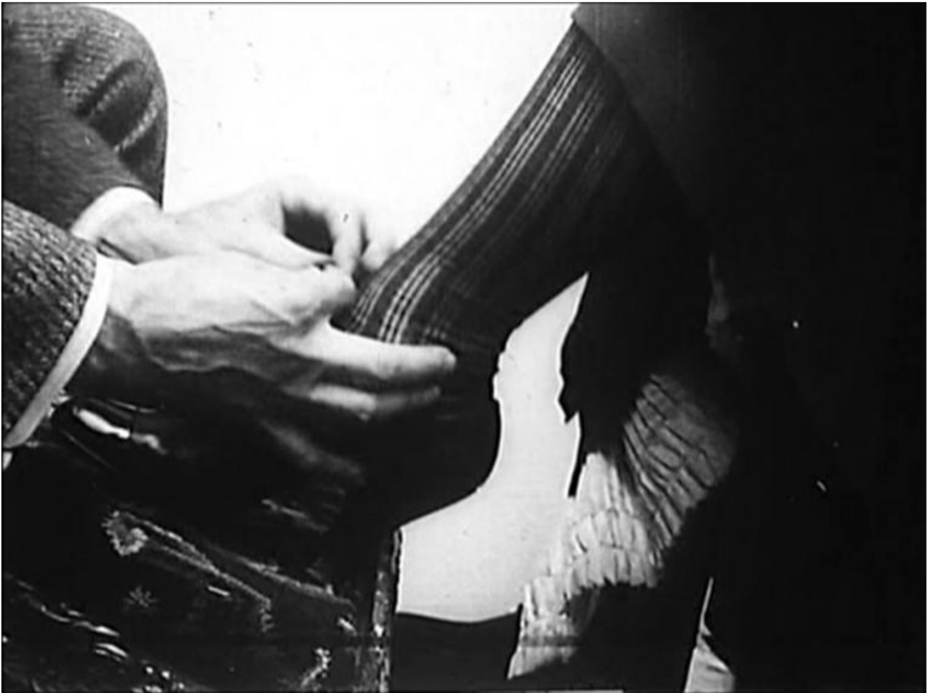
"The Gay Shoe Clerk", (1903), di Edwin S. Porter.

Non meno indispensabile è Il lucernario dell'infinito (1991), documentatissima dissezione del cinema delle origini compiuta al fine di ricostruire come si sia passati dalla ricchezza primigenia a quel Modo di Rappresentazione Istituzionale che imbriglia le risorse del cinema negli schemi narrativi mutuati dal teatro naturalista dell'Ottocento, e che conoscerà con Hollywood il proprio apogeo. Fra i due, il giustamente pluricelebrato To the Distant Observer (1979, inedito in Italia), frammenti di un discorso amoroso verso il cinema giapponese, cuciti insieme in modo da far sembrare quest'ultimo come una sorta di alternativa vivente all'imperialismo dell'incorreggibilmente occidentale Modo di Rappresentazione Istituzionale . Prendendo spunto da Barthes e ritorcendolo con un colpo da maestro contro lo strutturalismo stesso, Burch impugna un impressionante numero di film nipponici per dimostrare che da quelle parti si è riusciti a mettere in piedi un cinema maggiormente capace di staccarsi dalla standardizzazione hollywoodiana, grazie a un modo di legare insieme campo e fuoricampo inconcepibile alle nostre latitudini.