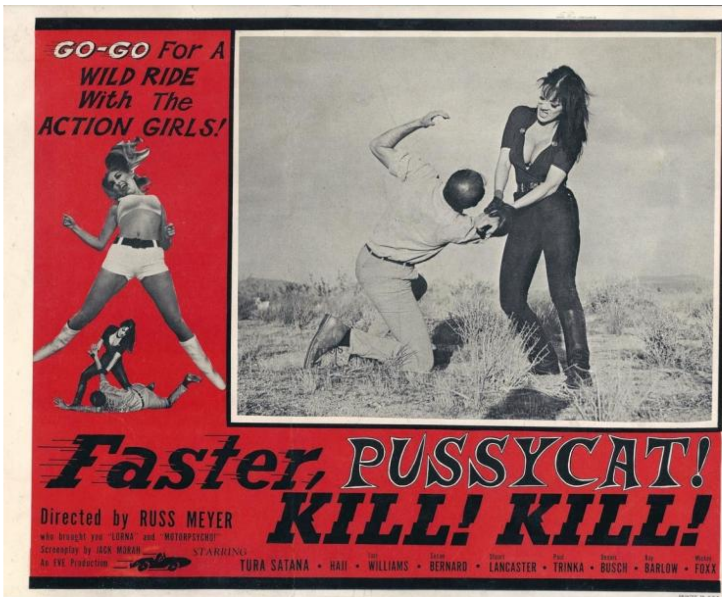
Locandina di "Faster, Pussycat! Kill! Kill!" (1965), di Russ Meyer.

Dai fumetti del periodo interbellico a Russ Meyer, da serie tv di successo come Dark Angel e Relic Hunter ai video amatoriali sul tema facilmente reperibili in rete: tutto contribuisce, secondo Burch, a indicare nella viragofilia l'elefante nella stanza dell'antropologia statunitense, lo scenario fantasmatico segretamente (ma nemmeno troppo) soggiacente di un'intera civiltà. Come già sottolineava Leslie Fiedler nel capitale Amore e morte nel romanzo americano , l'imponente processo di civilizzazione di un intero continente che ha dato luogo agli States ha avuto come premessa fondativa l'allontanamento e finanche l'esclusione della "europea" autorità paterna. Da qui il grande potere simbolico che l' homo americanus è disposto a concedere all'altra metà del cielo, controbilanciato da quello reale (politico, economico, sociale etc.) che invece mantiene saldamente nelle proprie mani.