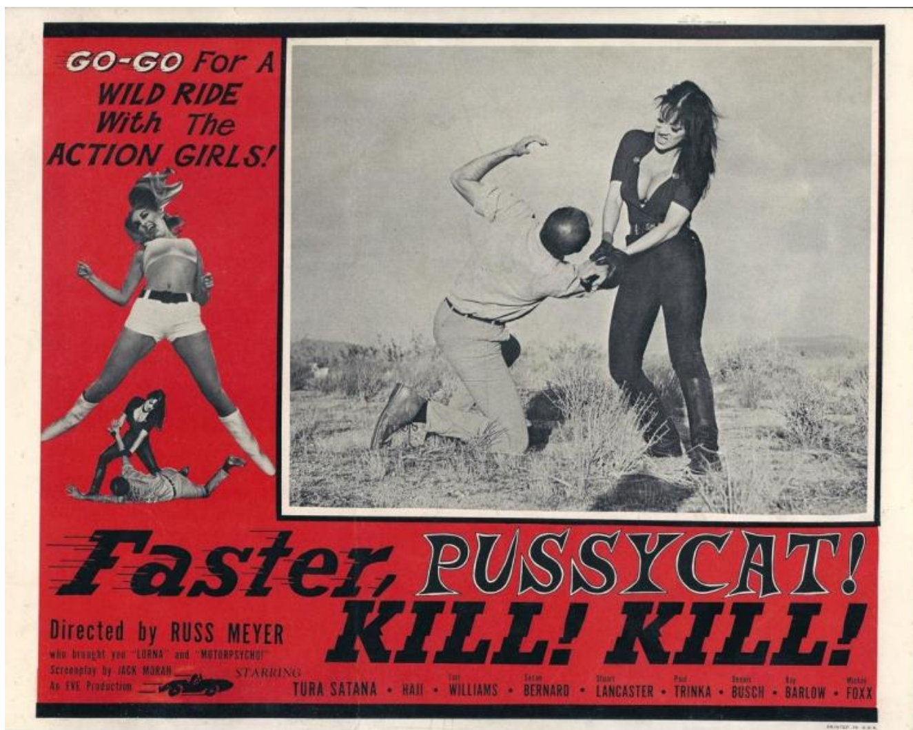
Locandina di "Faster, Pussycat! Kill! Kill!" (1965), di Russ Meyer.

Dai fumetti del periodo interbellico a Russ Meyer, da serie tv di successo come Dark Angel e Relic Hunter ai video amatoriali sul tema facilmente reperibili in rete: tutto contribuisce, secondo Burch, a indicare nella viragofilia l'elefante nella stanza dell'antropologia statunitense, lo scenario fantasmatico segretamente (ma nemmeno troppo) soggiacente di un'intera civiltà. Come già sottolineava Leslie Fiedler nel capitale Amore e morte nel romanzo americano , l'imponente processo di civilizzazione di un intero continente che ha dato luogo agli States ha avuto come premessa fondativa l'allontanamento e finanche l'esclusione della "europea" autorità paterna. Da qui il grande potere simbolico che l' homo americanus è disposto a concedere all'altra metà del cielo, controbilanciato da quello reale (politico, economico, sociale etc.) che invece mantiene saldamente nelle proprie mani.