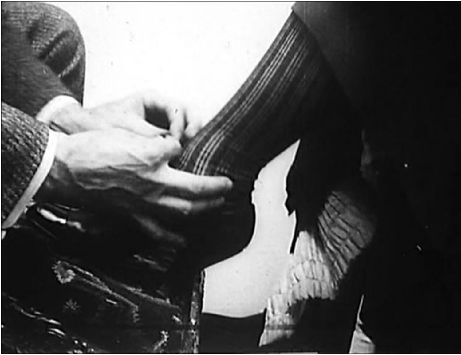
“ The Gay Shoe Clerk ”, (1903), di Edwin S. Porter.

Non meno indispensabile è Il lucernario dell'infinito (1991), documentatissima dissezione del cinema delle origini compiuta al fine di ricostruire come si sia passati dalla ricchezza primigenia a quel Modo di Rappresentazione Istituzionale che imbriglia le risorse del cinema negli schemi narrativi mutuati dal teatro naturalista dell'Ottocento, e che conoscerà con Hollywood il proprio apogeo. Fra i due, il giustamente pluricelebrato To the Distant Observer (1979, inedito in Italia), frammenti di un discorso amoroso verso il cinema giapponese, cuciti insieme in modo da far sembrare quest'ultimo come una sorta di alternativa vivente all'imperialismo dell'incorreggibilmente occidentale Modo di Rappresentazione Istituzionale . Prendendo spunto da Barthes e ritorcendolo con un colpo da maestro contro lo strutturalismo stesso, Burch impugna un impressionante numero di film nipponici per dimostrare che da quelle parti si è riusciti a mettere in piedi un cinema maggiormente capace di staccarsi dalla standardizzazione hollywoodiana, grazie a un modo di legare insieme campo e fuoricampo inconcepibile alle nostre latitudini.