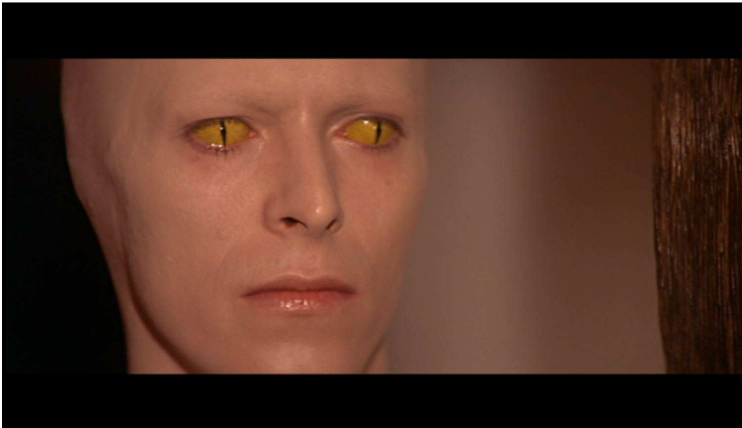
The man who fell to earth, David Bowie.

Anche nella cultura popolare della musica rock, nello stesso periodo, sono apparse figure memorabili, recentemente scomparse, come Lou Reed o David Bowie. Simon Critchley ricorda il significato dirompente che per la sua generazione ebbe l'«erotismo alieno» di Bowie: come nel film L'uomo che cadde sulla terra (diretto da Nicolas Roeg nel 1976, dal romanzo omonimo di Walter Tevis), in cui Bowie «si toglie le palpebre, i capezzoli e i genitali per mostrare il suo vero corpo alieno alla sua ragazza Mary-Lou, completamente atterrita, e decidono entrambi di ubriacarsi. Affrontando l'alieno, si affrontava l'alienazione. Per me significava apprendere a fare i conti con la mia sessualità alienata amando l'alieno» ( Bowie , il Mulino 2016).