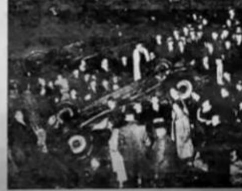
THE PATROL WAGON BURIED IN WRECKAGE AT BRATTLE STREET.

POLICE, BRIDAL Mystery Veils Fatal Injuries AUTO IN CRASH