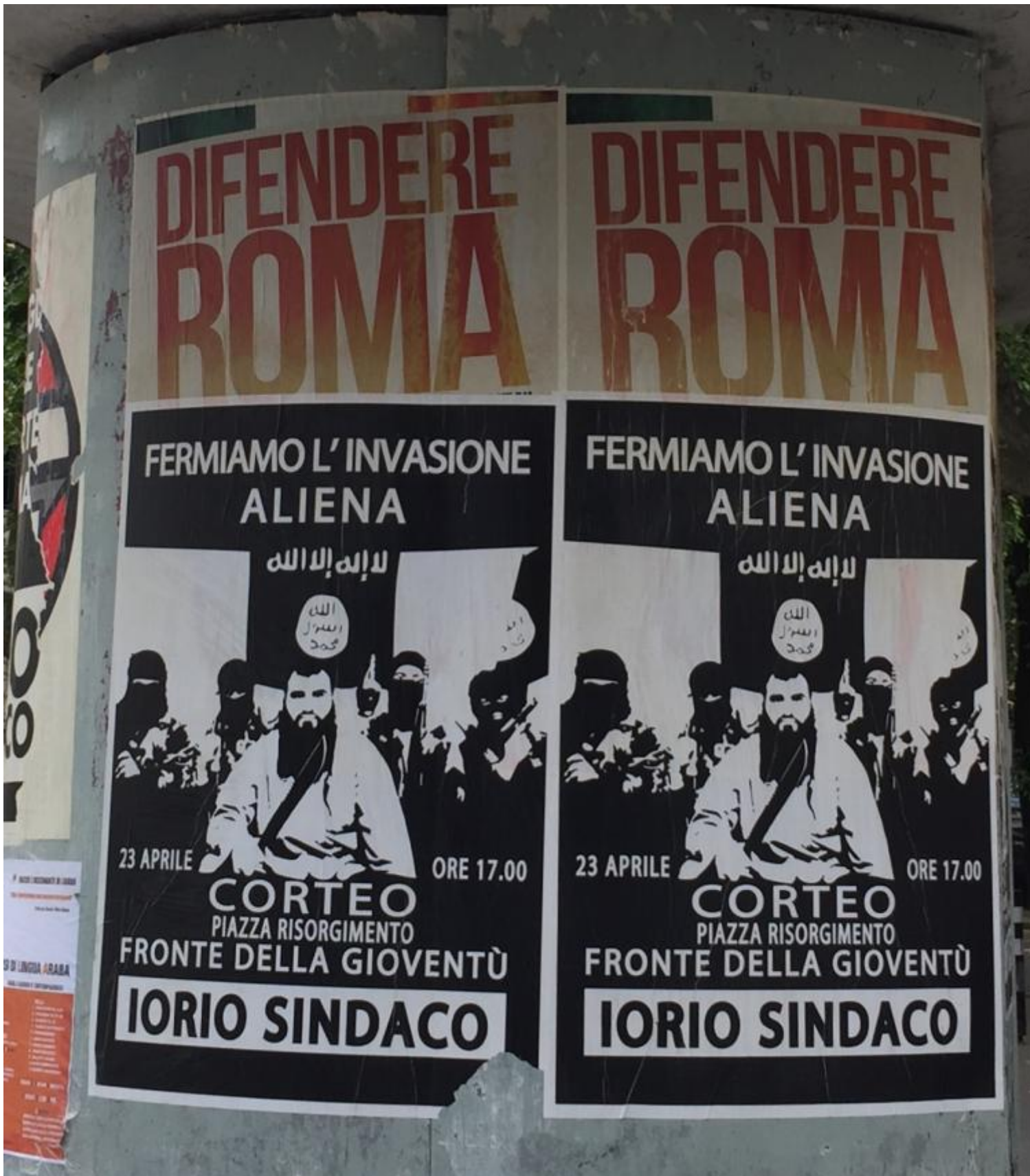
fermiamo l'invasione aliena, aprile 2016.

Non è la prima volta che, in positivo o in negativo, un connotato «alieno» viene attribuito a politici della città. Il sindaco uscente Ignazio Marino – che si era presentato quale homo novus , estraneo alle correnti di