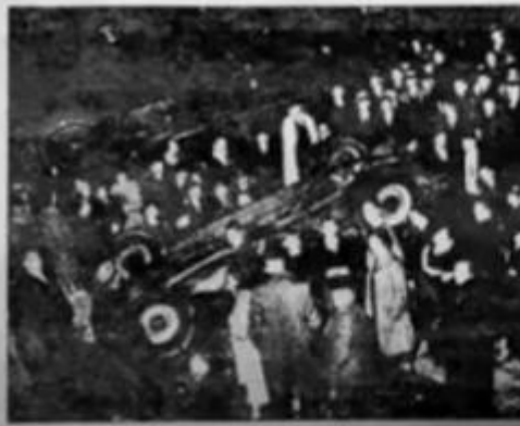
THE PATROL WAGON PLUNGED ON WEDNESDAY AT BOSTON.

POLICE, BRIDAL Mystery Veils Fatal Injuries AUTO IN CRASH T. WIL... I. W. I.