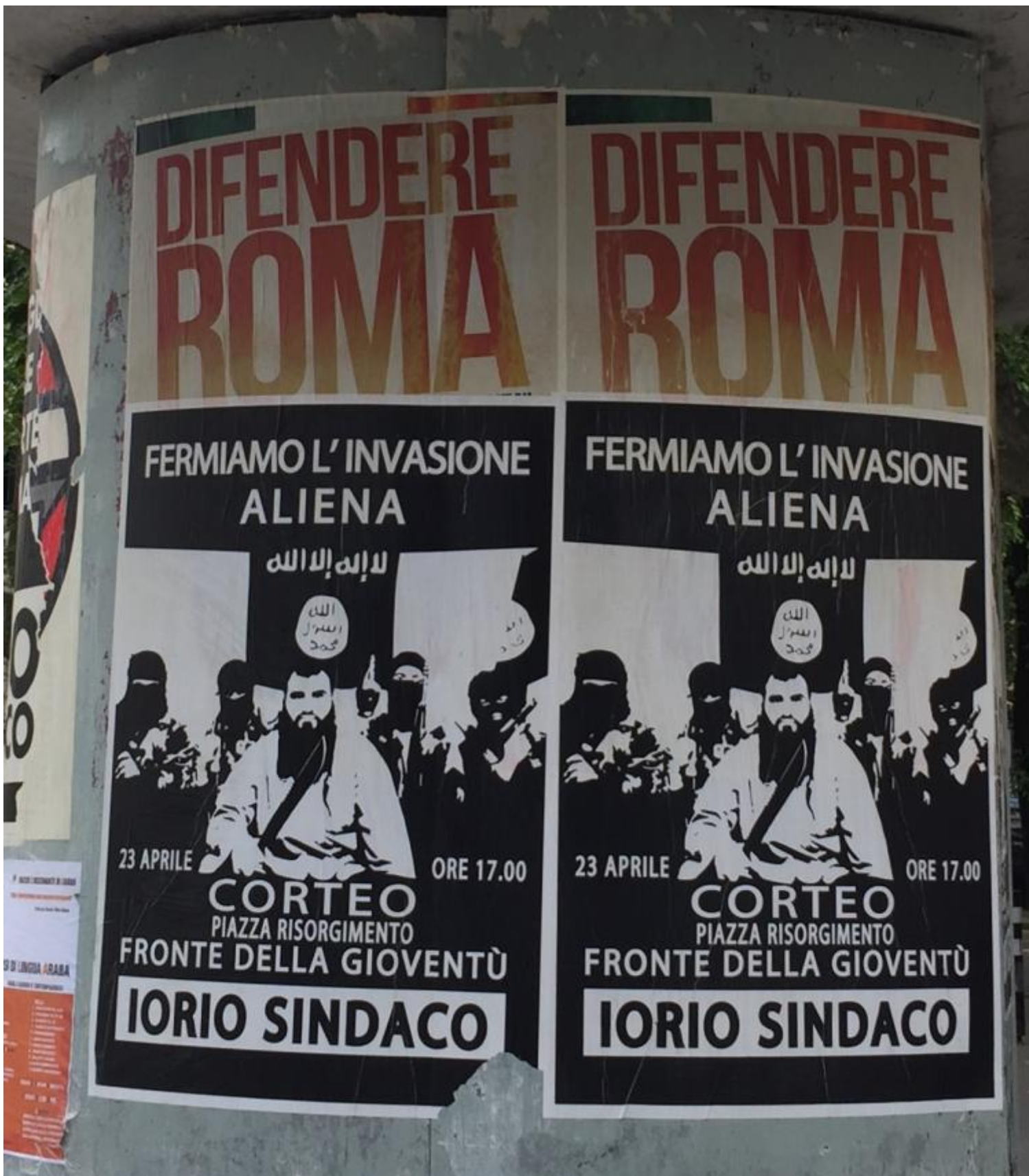
fermiamo l'invasione aliena, aprile 2016.

Non è la prima volta che, in positivo o in negativo, un connotato «alieno» viene attribuito a politici della città. Il sindaco uscente Ignazio Marino – che si era presentato quale homo novus , estraneo alle correnti di