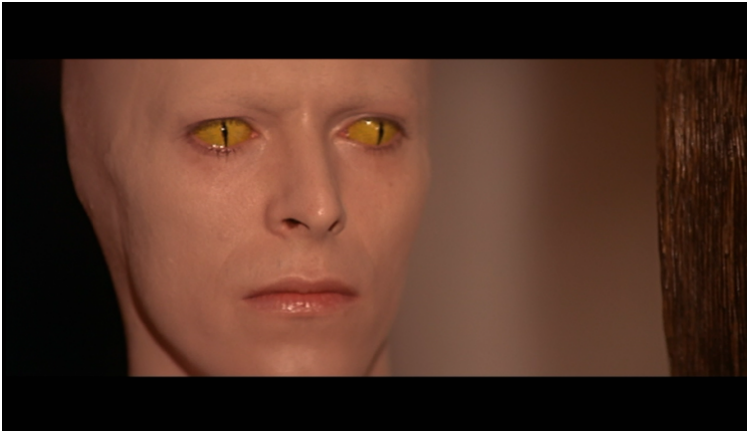
The man who fell to earth, David Bowie.

Anche nella cultura popolare della musica rock, nello stesso periodo, sono apparse figure memorabili, recentemente scomparse, come Lou Reed o David Bowie. Simon Critchley ricorda il significato dirompente che per la sua generazione ebbe l'«erotismo alieno» di Bowie: come nel film L'uomo che cadde sulla terra (diretto da Nicolas Roeg nel 1976, dal romanzo omonimo di Walter Tevis), in cui Bowie «si toglie le palpebre, i capezzoli e i genitali per mostrare il suo vero corpo alieno alla sua ragazza Mary-Lou, completamente atterrita, e decidono entrambi di ubriacarsi. Affrontando l'alieno, si affrontava l'alienazione. Per me significava apprendere a fare i conti con la mia sessualità alienata amando l'alieno» ( Bowie , il Mulino 2016).