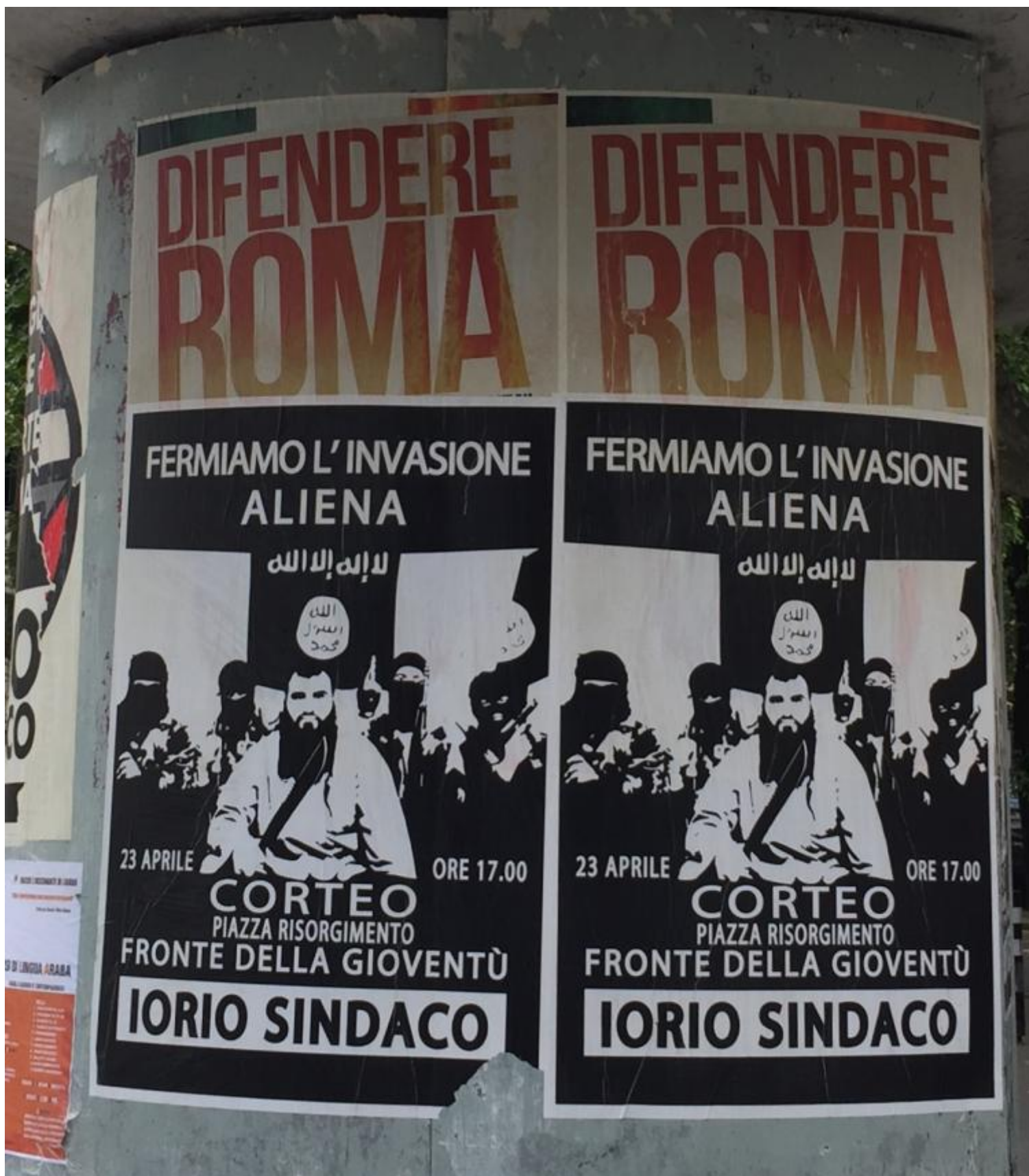
fermiamo l'invasione aliena, aprile 2016.

Non è la prima volta che, in positivo o in negativo, un connotato «alieno» viene attribuito a politici della città. Il sindaco uscente Ignazio Marino – che si era presentato quale homo novus , estraneo alle correnti di