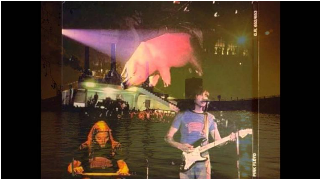
Pink Floyd 1977.

storia, in questo caso dell'arte popolare che, sintonizzata prima sulla rivoluzione psichedelica, ora coglie che "il decennio breve" è finito. The dream is over , aveva cantato John Lennon: Animals è l'epitaffio di quel sogno.