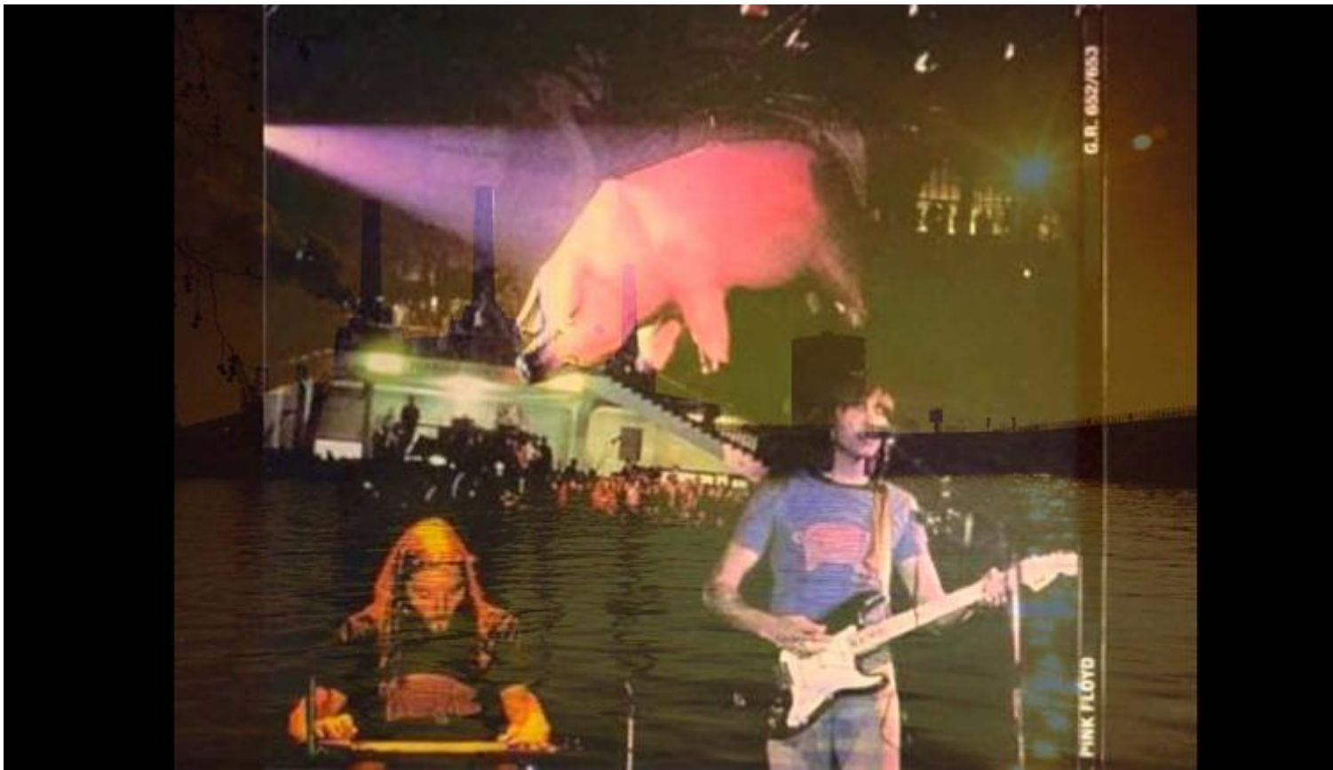
Pink Floyd 1977.