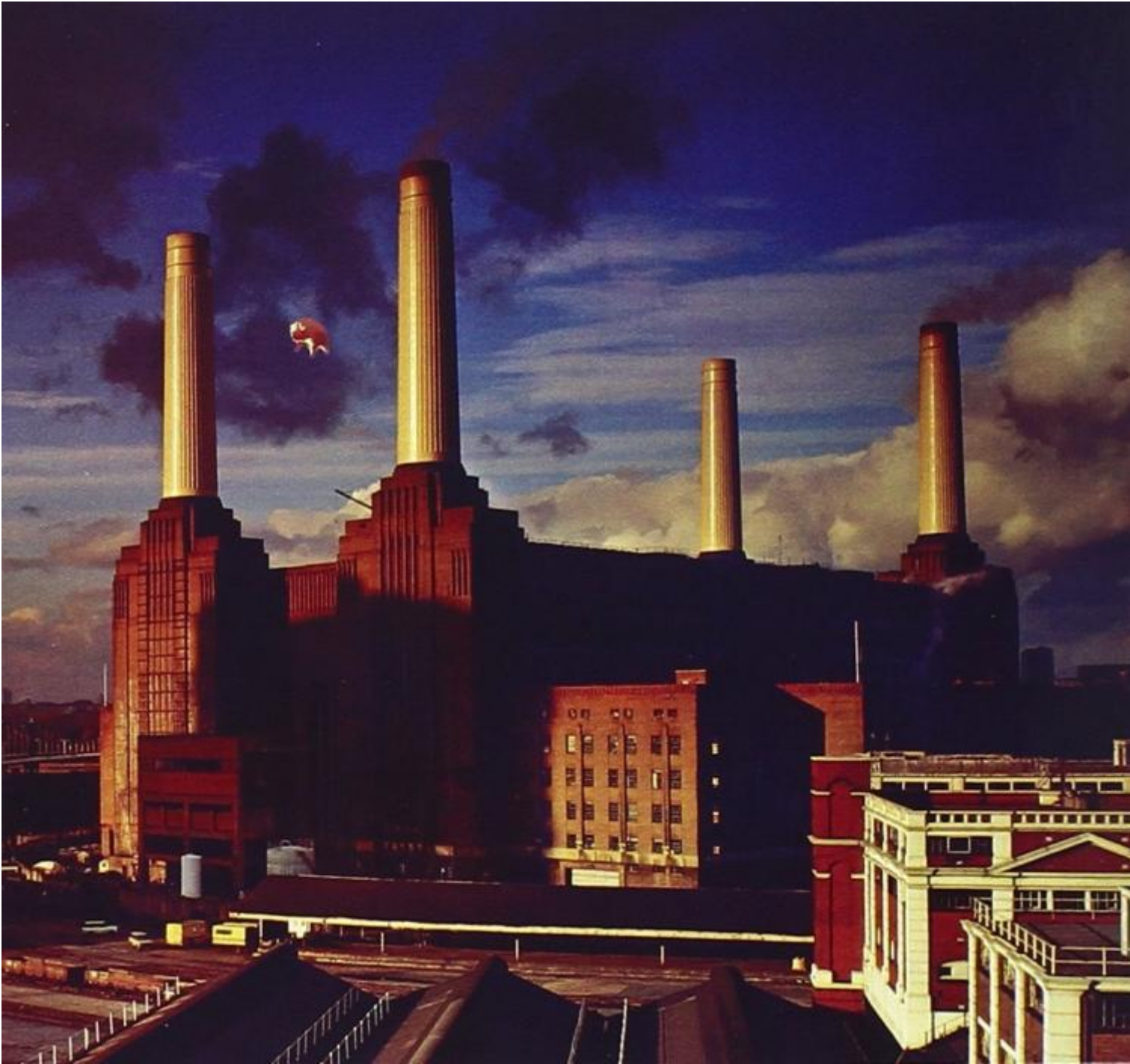
Pink Floyd, Animals.

Wall , album e frattura che si ergerà tra lui e la band (ho avuto la fortuna di intervistare Waters nel 1992, per capire anche dal suo modo di esprimersi quanto fece male quel conflitto che “terminò” i Pink Floyd come unità artistica dagli anni ‘80 in avanti).