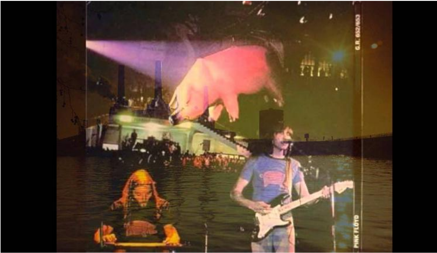
Pink Floyd 1977.