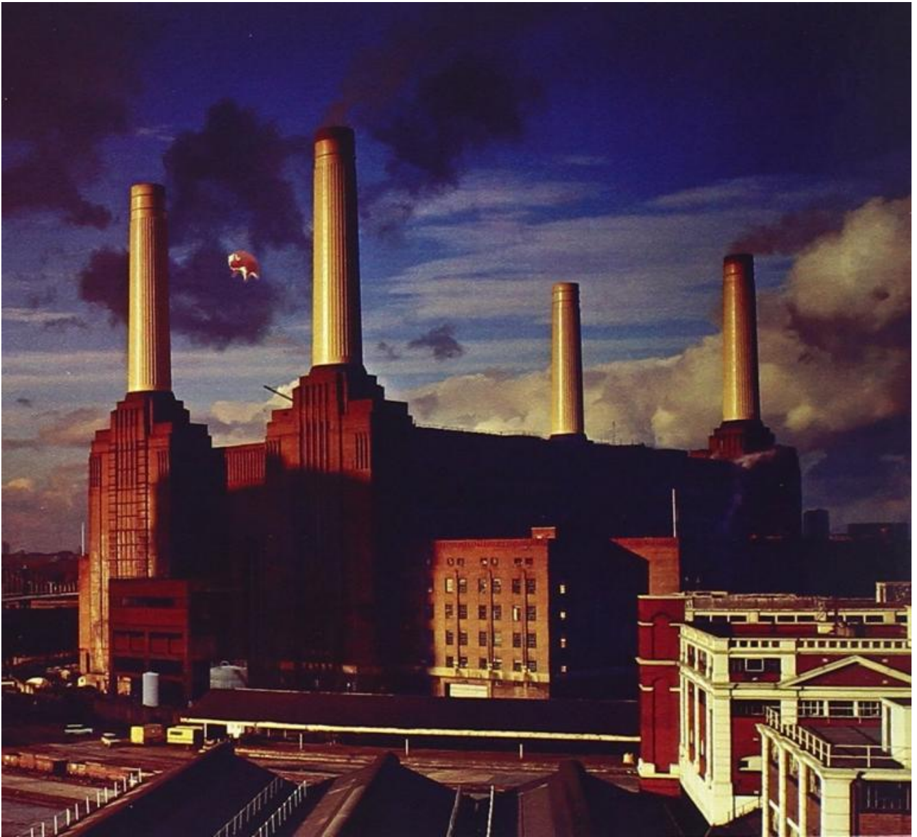
Pink Floyd, Animals.

Dell'opera musicale mi ha sempre colpito il "genius loci" che riesce a farci vedere: Animals , come ogni album dei Floyd, rappresenta un luogo. La indimenticabile copertina, con la centrale di Battersea e il maiale gonfiabile, presenta una località del lato oscuro della psiche; i riferimenti a La fattoria degli animali di Orwell, con i testi - durissimi, cupi, senza vie di scampo - sviluppano temi cari a Waters, che dopo i testi di The Dark Side Of The Moon ("Time" e "Us and Them" relativamente al conflitto) approfondisce la poetica che nasce dall'idea di guerra - militare e relazionale; del tradimento e della lealtà, della paura e del cupo destino dell'uomo che vive nelle società industrializzate, tecnologicamente avanzate, quel "21st Century Schizoid Man" tratteggiato magistralmente dai King Crimson alla soglia degli anni '70. Per Waters il tema della finzione è fondamentale. È forte la