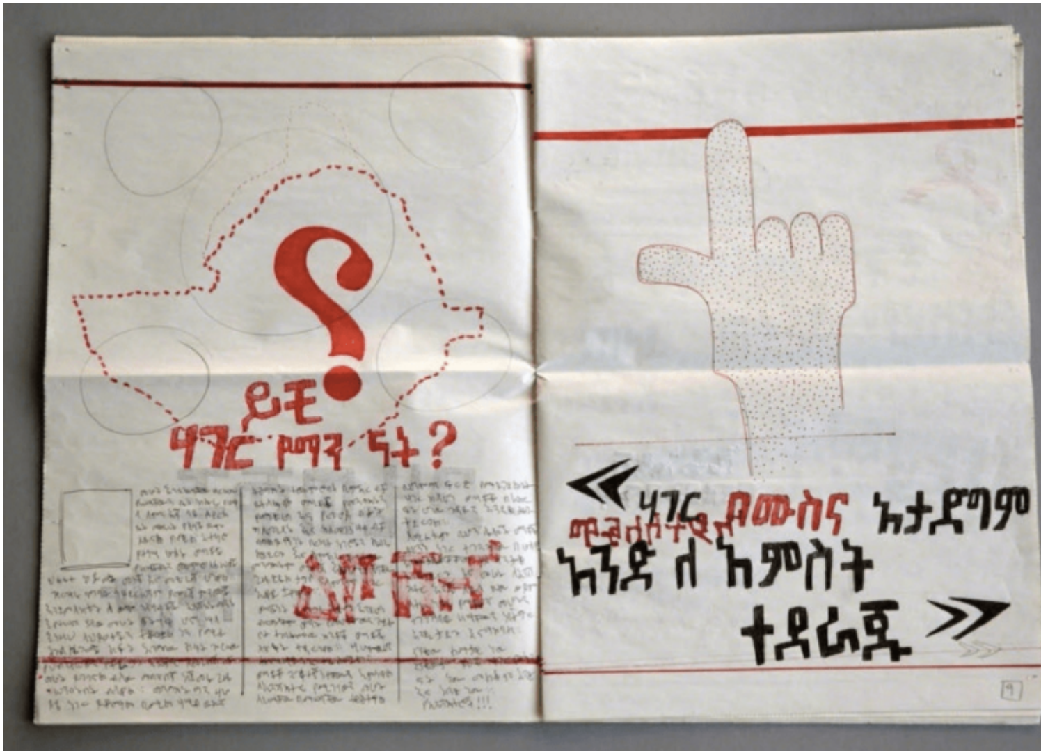
Robert Temesgen, Another Old News (2016), Courtesy of the artist and Tiwani Contemporary.