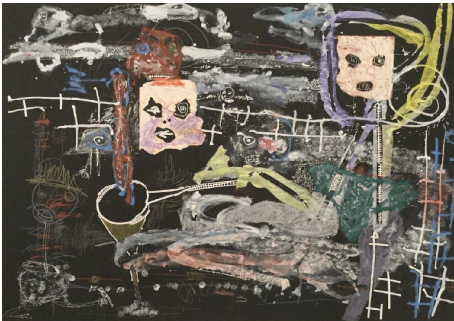
Thierry Oussou, Untitled (2016), Courtesy of the artist and Tiwani Contemporary.

L'intimo e poetico video di Kitso Lynn Lelliott, I was her and she was me and those we might become (2016), concentra la riflessione su un tempo non lineare. In questo lavoro linee temporali distanti si uniscono, in costellazioni mutevoli e frammentarie. L'artista rimarca l'impossibilità che una valida narrazione storica, personale o collettiva, si configuri come un singolo, immutabile oggetto di conoscenza. La storia è il risultato di un costante intrecciarsi di racconti plurali e dissonanti. Irriducibile complesso di tracce, impressioni, sogni.