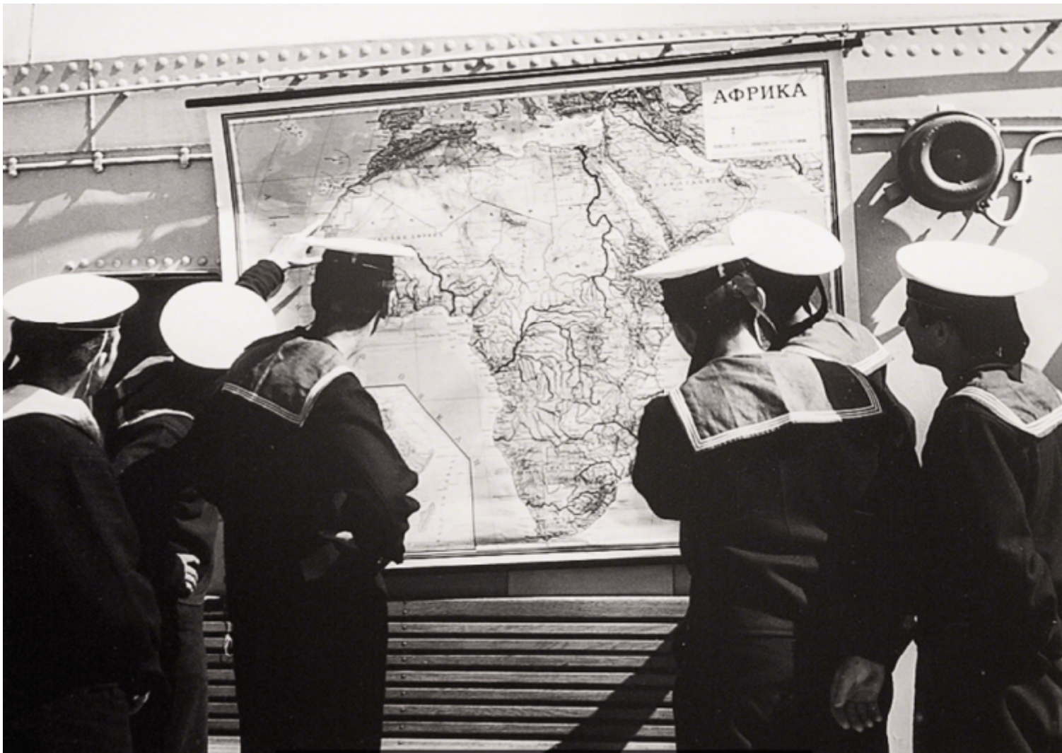
Theo Eshetu, The Mystery of History and My Story in His Story (2015), Courtesy of the artist and Tiwani Contemporary.

La galleria londinese Tiwani Contemporary presenta Field Work , una mostra collettiva che include i lavori di otto artisti africani e della diaspora “le cui pratiche sono ancorate in un profondo scrutinio dei meccanismi della storia”, come dichiara il comunicato stampa. Esplorando il modesto spazio della galleria, il visitatore si trova a incontrare otto distinti approcci alle questioni del tempo e del racconto storico; approcci che mettono in luce nuovi modi di registrare, recuperare e studiare le molte forme del passato, mettendo in discussione la dominante storiografia di matrice occidentale. Ognuno dei lavori presenti in mostra è espressione di pratiche artistiche molto più complesse, che possono, in alcuni casi, entrare in dialogo e rivelare interessanti connessioni metodologiche.