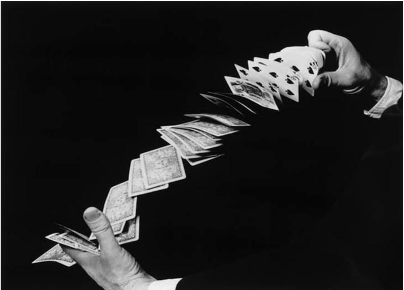
Ph Harold Eugene "Doc" Edgerton.

4. Perché l'apertura di un dibattito sulla legittimità della tortura è di per sé inquietante? Dopotutto, sappiamo che la validità universale e suprema del divieto di tortura non ha fatto venir meno le violazioni: non è coincisa, cioè, con la sua assoluta e uniforme efficacia. Un libro di Darius Rejali, Torture and Democracy , contiene una rassegna delle pratiche di tortura in epoca contemporanea e una dettagliata distinzione fra stili di tortura - francese "classico" e "moderno", anglosassone, slavo e mediterraneo "moderni", sovietico e israeliano - caratterizzati in base alle varie combinazioni di elettroshock, annegamento, asfissia, assideramento, deprivazione del sonno e sensoriale, uso di droghe e agenti irritanti, pestaggi, percosse sui piedi, torture posizionali, abusi sessuali, ecc. Il libro dimostra l'esistenza di "una lunga, ininterrotta eppure largamente dimenticata storia della tortura praticata dalle democrazie a casa propria e all'estero, una storia che risale a circa duecento anni fa e che coinvolge le principali democrazie dei tempi moderni" (ivi, p. 4). Si potrebbe quindi concludere che il principale risultato del divieto di tortura è stato quello di costringere le democrazie a inventare tecniche di tortura "pulite", che non lasciano segni visibili sul corpo delle vittime, tecniche che nel corso del Novecento hanno raggiunto una