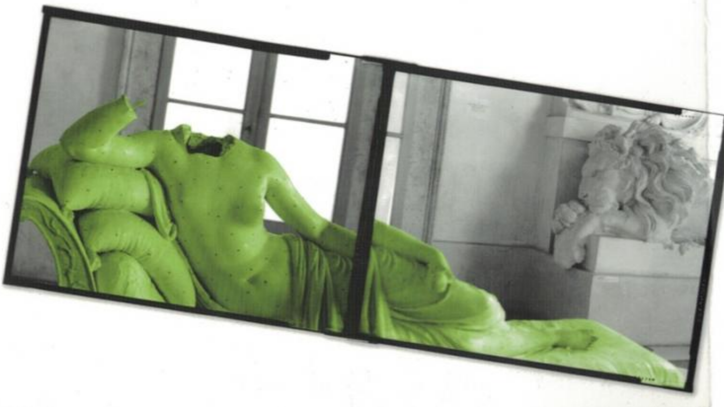
Gianantonio Battistella, foto di Antonio Canova, Paolina Borghese come Venere vincitrice 2013.

Pantone quindi ci propone il greenery e ci assicura la possibilità di abbinarlo con diverse palette di colori; addirittura un articoletto nel sito della ditta ci assicura che il verde rallenta gli ormoni dello stress. In effetti il verde si è affermato nella nostra società come colore della natura, dell'ecologia, della salute e della freschezza, ma anche della gioventù e della libertà. Anche la sua storia ne conferma la positività, almeno: un filone della sua storia.