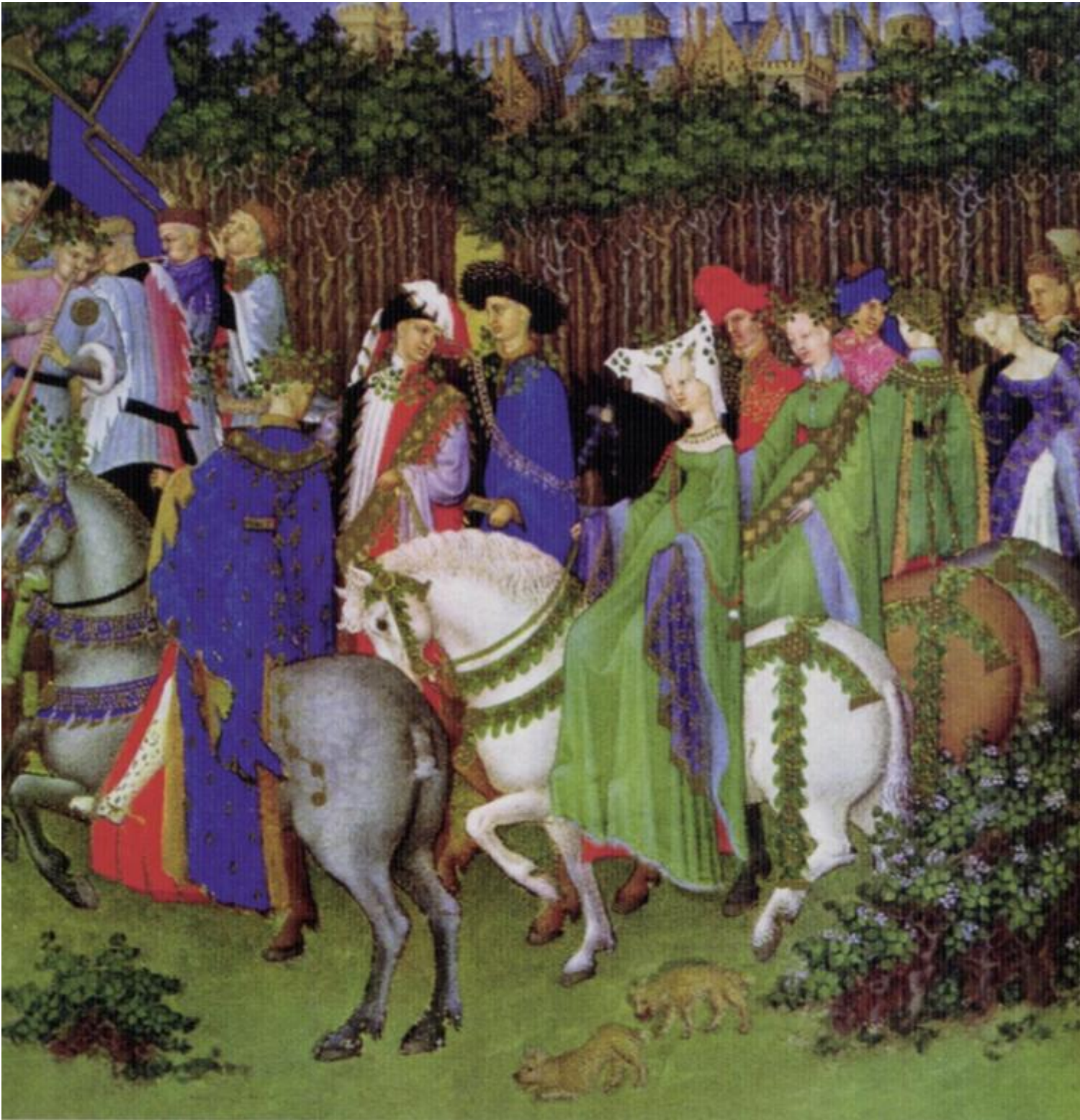
Miniatura delle Très Riches Heures del duca Jean de Berry, mese di maggio, Chantilly (Parigi, 1414-1416 ca).

L'orizzonte simbolico è chiarissimo: la sfumatura di verde proposta è precisamente quella delle prime foglie di primavera, allude alla rinascita, al risveglio e al rivitalizzarsi della natura e si associa alla freschezza dell'acqua e dell'aria pura, vuole ricreare in un mondo, impotente di fronte dalla disperazione dei migranti e minacciato dal terrorismo e dalla guerra, un angolo di serenità. La proposta viene da una grande azienda, Pantone Inc., fondata nel 1962 a Carlstadt nel New Jersey e ora parte del colosso americano X-Rite, che domina nel settore grafico, industriale e chimico. Nel catalogo dei prodotti troviamo le mazzette per grafici e pittori, ma anche oggetti comuni, come cartoline tazze taccuini e accessori, applicazioni per il cellulare e,