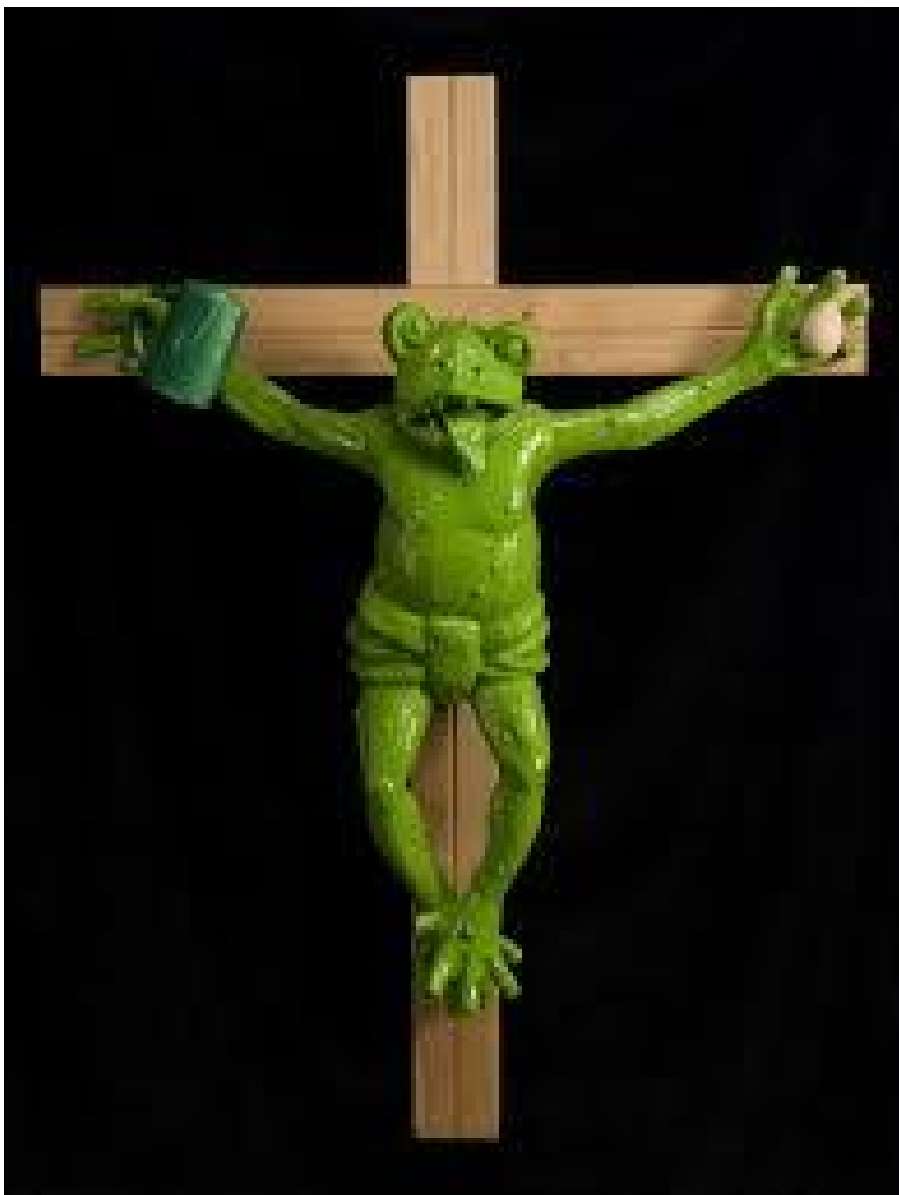
Martin Klippenberger, Rana crocifissa, Museion, Bolzano 1988.